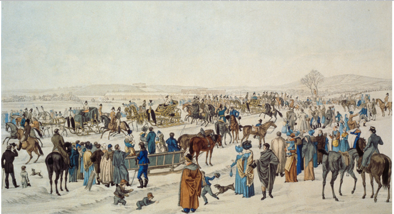
A nagy birodalmi szánkóverseny Hofburgtól Schönbrunnig, 1815. január 22. Rézkarc vízfestékkel színezve, 1820-as évek, ismeretlen szerző