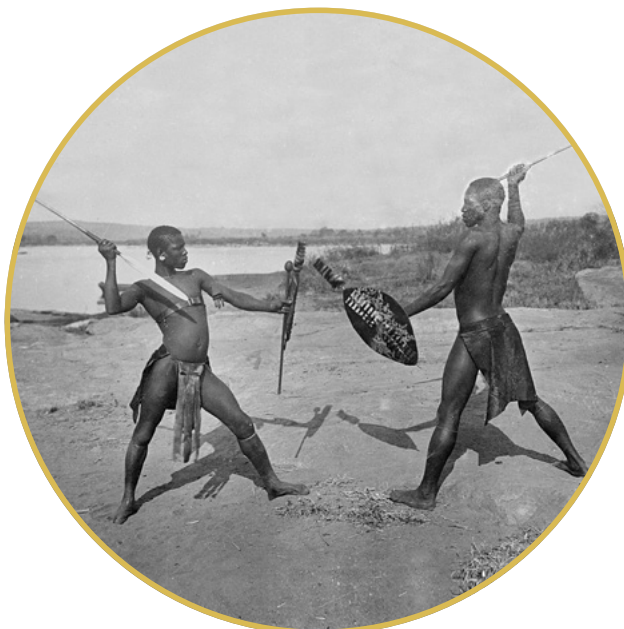
Zulu harcosok, Dél-Afrika, 1910-es évek