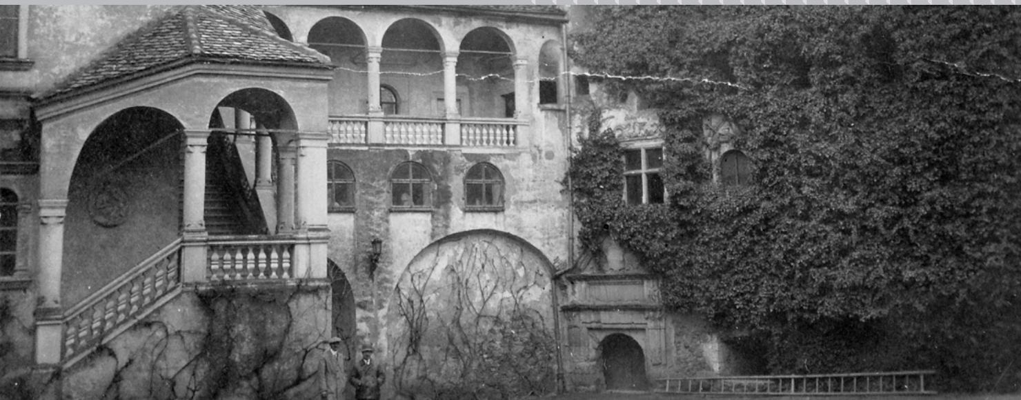
Sárospatak, a Rákóczi vár előtérben a Lorántffy-loggia és a Vörös-torony