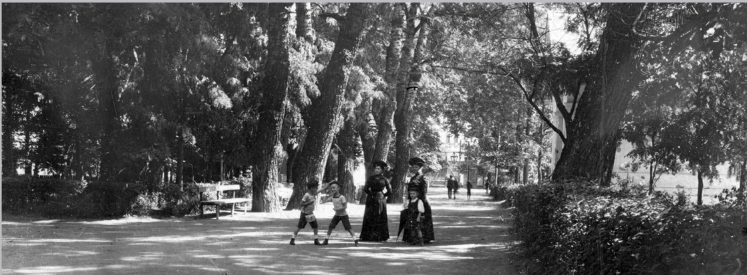
A kolozsvári sétatér 1909-ben