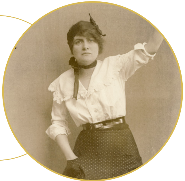
Jelenetkép az Apacs nő szerelme c. filmből