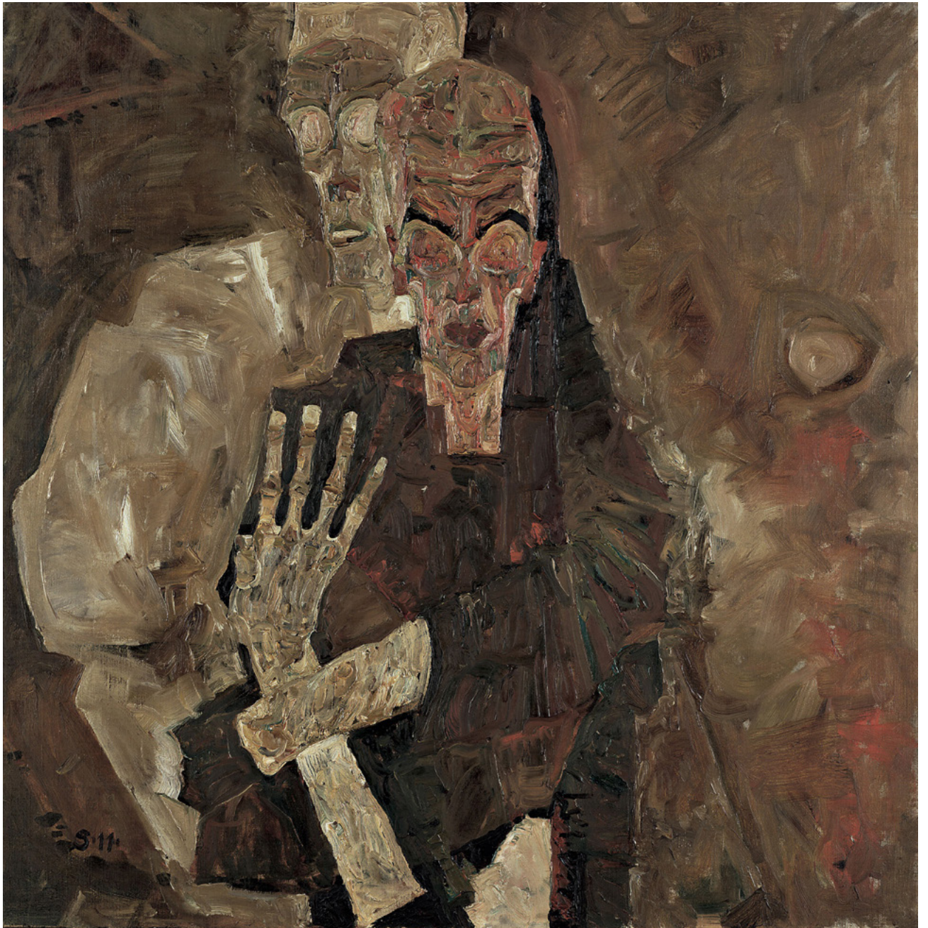
Egon Schiele (1890-1918): Halál és az ember; 80×80 cm, olaj, vászon, 1911