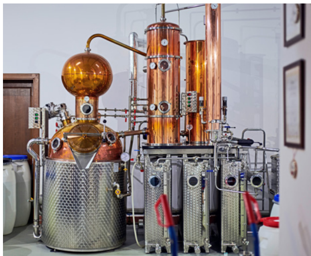
A hegykői pálinkafőzde

Hegykő nevezetessége a barokk pestis-szobor, amelyet az 1711-es nagy pestisjárvány után állíttatott a falu lakossága. Hűvösebb napokon tökéletes esti program a Masina-ház látvány pálinkafőzdéje, a 2014-ben