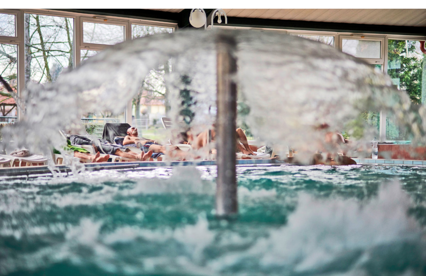
A SÁ-RA termál fedett wellness medencéje

megvásárolta a várostól, korszerű hidegvíz-gyógyintézetet létesített, ahol a mozgásszervi megbetegedések mellett epilepsziás betegeket is kezeltek. A település kénes forrásait 1975-ben nyilvánították gyógyvízzé: a sok évszázados tapasztalatok, majd a tudományos vizsgálatok is bebizonyították, hogy a balfi vízből elsősorban a szulfidkén fejti ki hatását, a bőrön, a légutakon és – ivókúra esetén – a bél nyálkahártyáján keresztül felszívódva. Jótékony hatással van a szervezet oxidációs folyamataira, fontos szerepet játszik a porc és a csont felépítésében, ezért ortopédiai és neurológiai megbetegedések esetén alkalmazható kiváló eredményekkel.