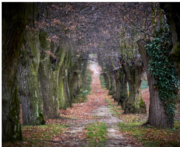
Nyulas Ferenc sétány, Balf