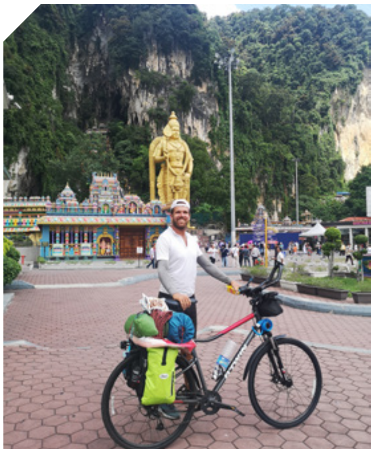
Kuala Lumpur (Malajzia), Batu Caves

– Sokszor aludtam kolostorokban a többi országban is, a szerzetesek befogadtak éjszakára, hajnalban a gong keltett, majd általában csatlakoztam a közös