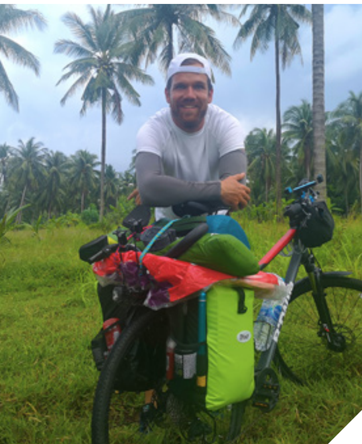
Thaiföld északi részén

– Ha előre tudom, hogy megkapom azokat a vállalkozásötleteket, amiket kaptam, igen. Sok ötletem volt már, de ha valamit nem tudok szívvel-lélekkel csinálni, akkor inkább nem csinálom. Rájöttem, hogy az út egy célkeresés is volt, hogy mit tegyek, hogy ne kelljen a mókuskereket pörgetnem. Teniszt 12 éve oktatok, ez meg is fog maradni, mellette Ausztriába járok ki dolgozni. Ezzel az úttal elengedtem a görcsöt, és így jöttek olyan ötletek, amelyek közül néhányat remélem, hogy már idén meg tudok valósítani. Az egyik ilyen a könyvírás is. Hosszabb távú tervem pedig egy árvaház létrehozása. Ásványrárón van egy telkem, az erdő szélén, itt megvalósítható lenne az az önellátó gazdálkodás, amire meg szeretném majd tanítani a gyerekeket, és amit még én is csak tanulok. Tavaly tavasszal elkezdtem egy alapszintű gazdálkodást Tényőn, erre vágytam már évek óta. ♦