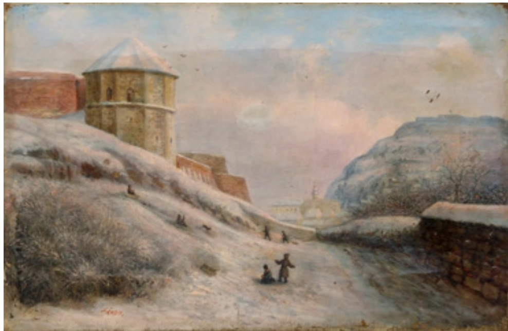
Id. Sándy Gyula: Középkori vártorony a budai Vár oldalában, 1875, olaj, vászon, a rimaszombati Gömör-Kishonti Múzeum gyűjteményéből

szemlélettel foglalkoztak az unokákkal, és nem utolsósorban teret adtak kreativitásuk kibontakozásának.