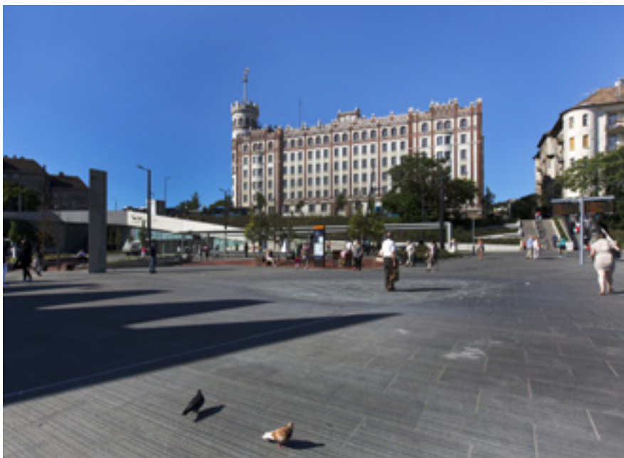
Az ifj. Sándy Gyula által 1923-ban tervezett budai Postapalota, fotó: Bélavári Krisztina / MÉM MDK, 2018