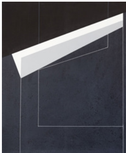
Konok Tamás: Leejtő II., 2018, akril, vászon (Konok Tamást a Molnár Ani Galéria képviseli)