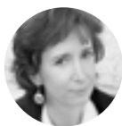
SZÖVEG – NAGY VILLŐ