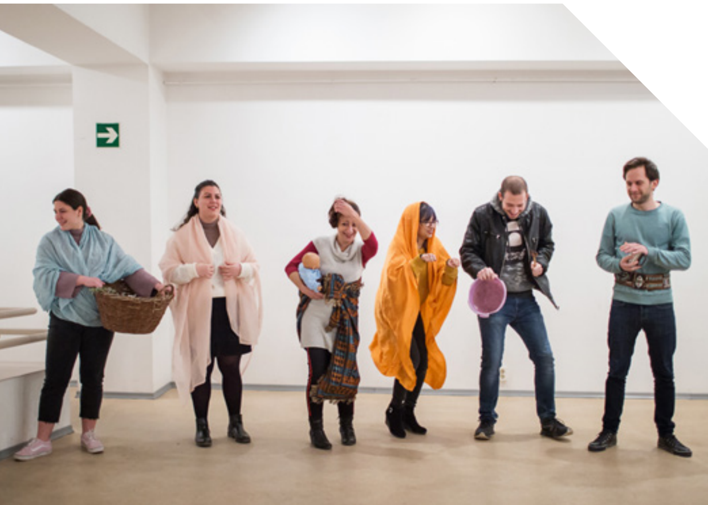
A Púnya próbája a Keret Alkotó Csoport szervezésében, Pécssett

kövekkel a lábunk alatt készülünk egy Jézus-történetre, miközben a saját élettörténetünkéből dolgozunk. Amikor például Cinka megy Keresztelő János elé, mi is megkerestük a magunk életében azokat a pontokat, amikor bántottak és bántottunk. Ez meg is jelenik majd a darabban, de a szereplőkben is dolgozik tovább. A próbák alatt fontos dolgok történnek. Egy egyetemista a második alkalommal megkérdezte, mi az a púnya, és a 18 éves cigány lány behozott a következő próbára egy meleg púnyát, amit a társulatnak sütött. Hálát adtunk, és megtörtük... olyan volt, mint egy szövetségkötés. A darabot május 16-án Nepomuki Szent János napján szeretnénk bemutatni, aki a hidak védőszentje, mert ez a színház arról szól, hogy hidak épüljenek köztünk.”