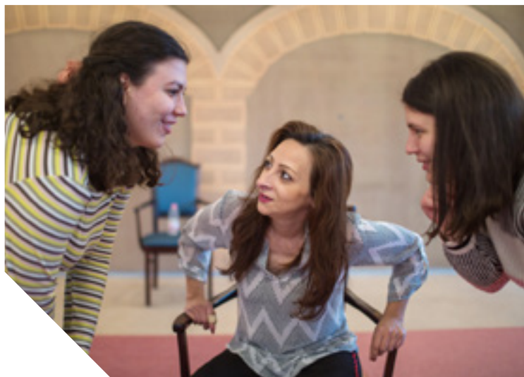
A Punya próbája a Keret Alkotó Csoport szervezésében, Pécssett