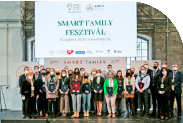
KINCS Smart Family Fesztivál díjátadó