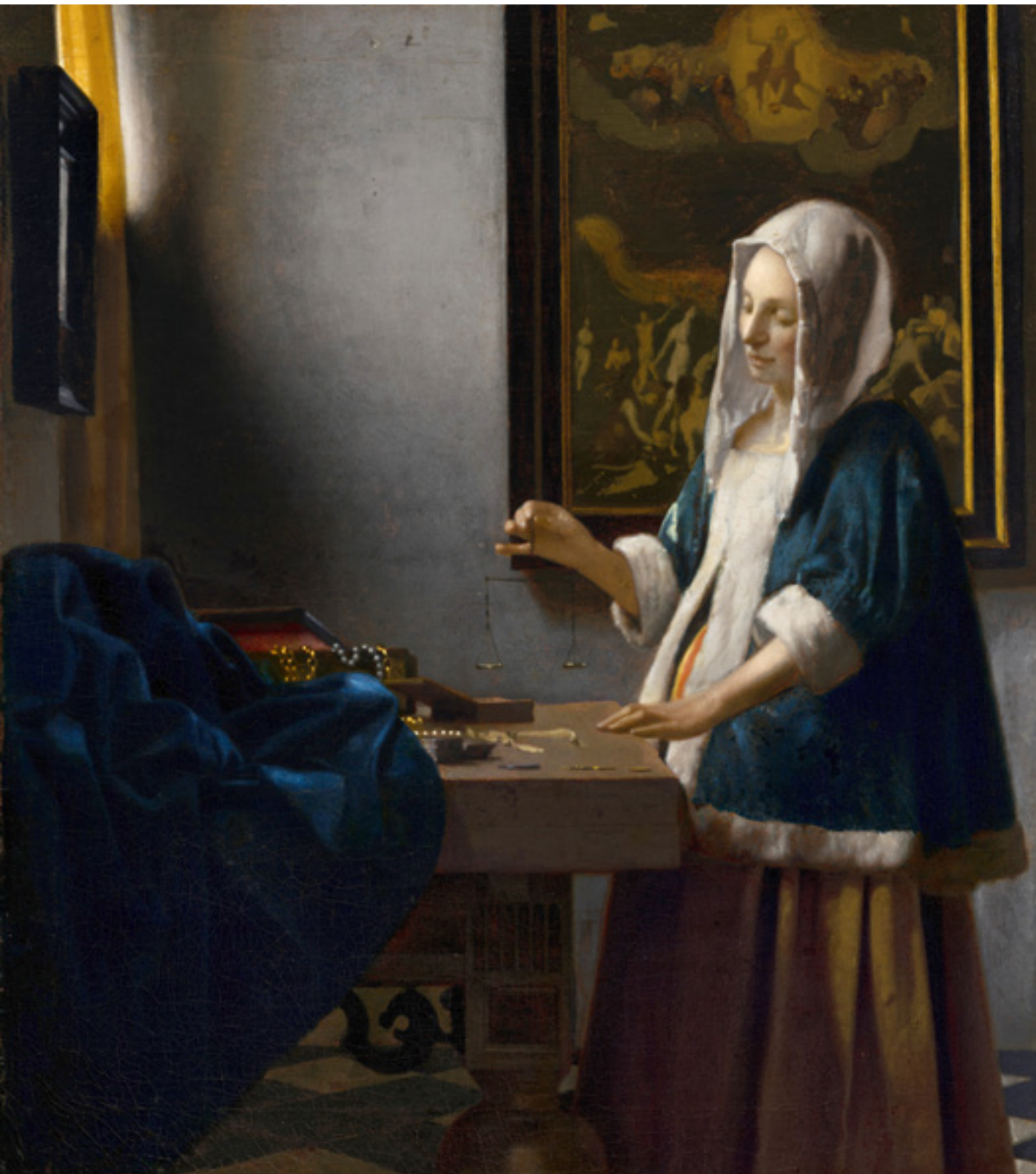
Jan Vermeer van Delft (1632–1675): Nő mérleggel. Olaj, vászon, 1664 körül