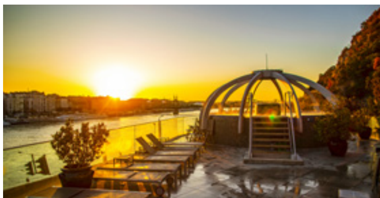
Rudas Gyógyfürdő, Budapest

lovának lába alatt bújik meg mintegy ezerméteres mélységben? Vagy hogy a Gellért-hegy sziklái alatt húzódó alagútban, a Gellért és Rudas fürdő között végigsétálva tucatnyi kútra akadunk, amelyekből forró víz tör fel? Hogy a télen-nyáron meleg, a budai Malom-tó partján álló, kupolás „török fürdő” bizony sohasem látott törököt, hiszen alig másfél évszázada emeltette egy merész vállalkozó? Hogy Budapest legpompásabb fürdőpalotája a termálvízben gazdag Margitszigeten állt? A Margit fürdőt, amely a háborúban megsérült, 1958-ban bontották le.