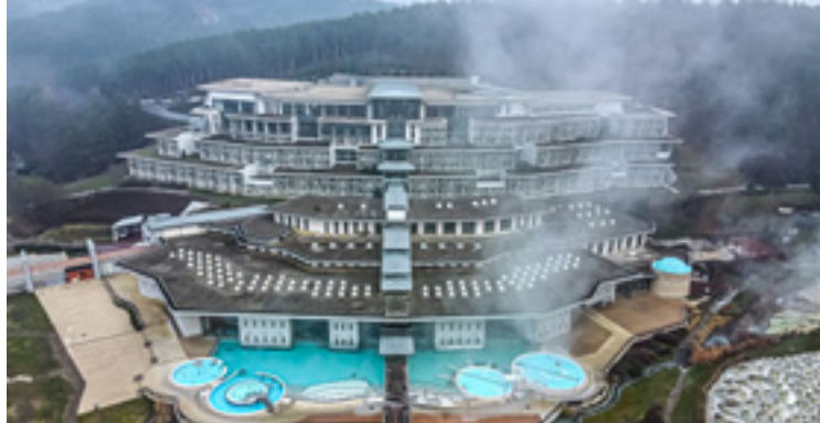
Saliris Resort, Egerszalók