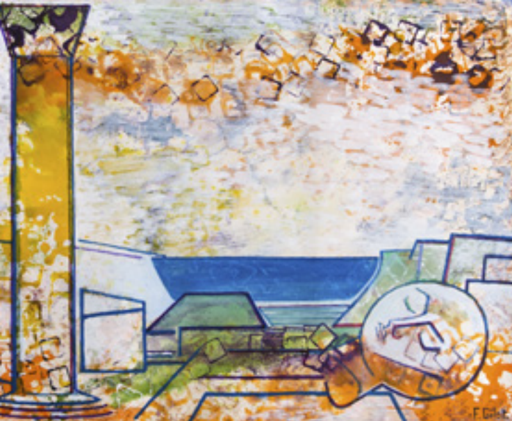
François Gilot: Tájkép oszloppal és fejjel. 1966. akvarell, papír, 56x76 cm