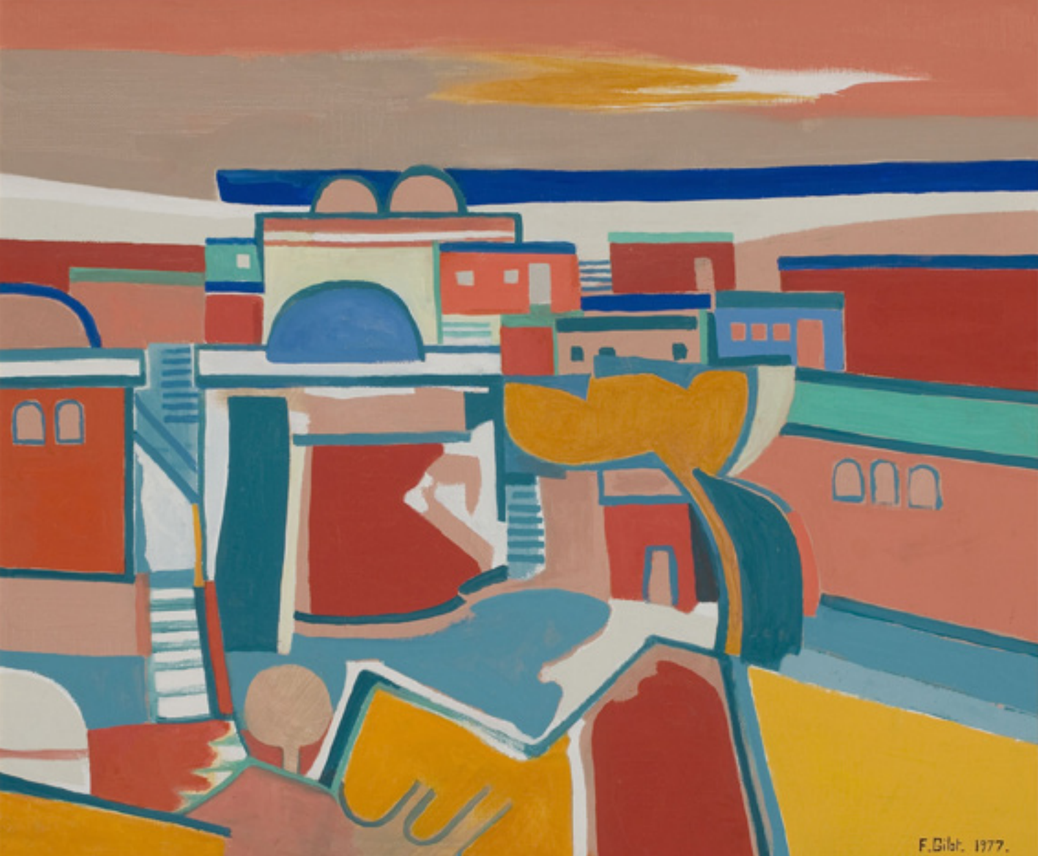
François Gilot: Keleti város II. 1977. olaj, vászon, 65x54 cm