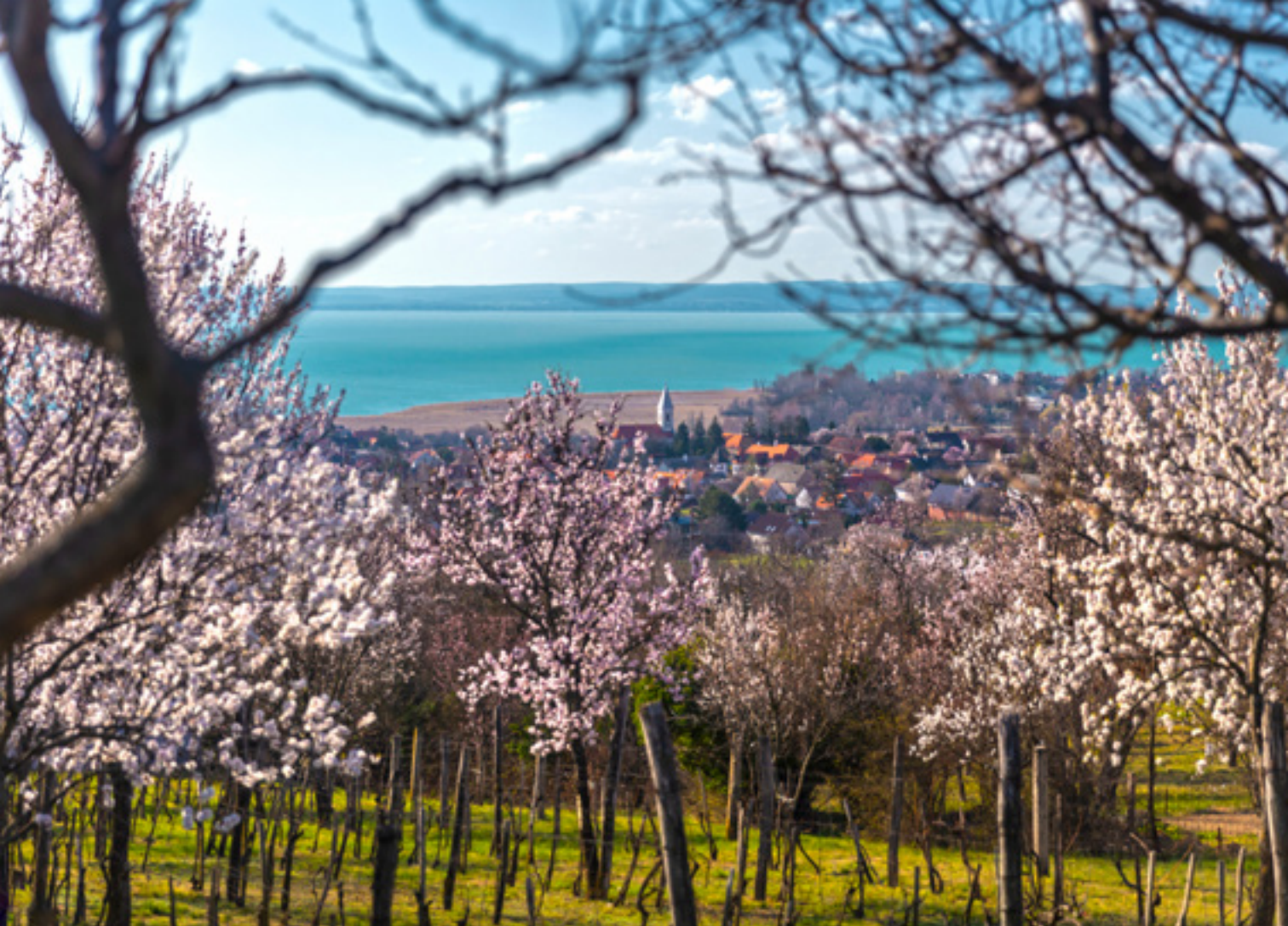
Mandulavirágzás a Balatonnál