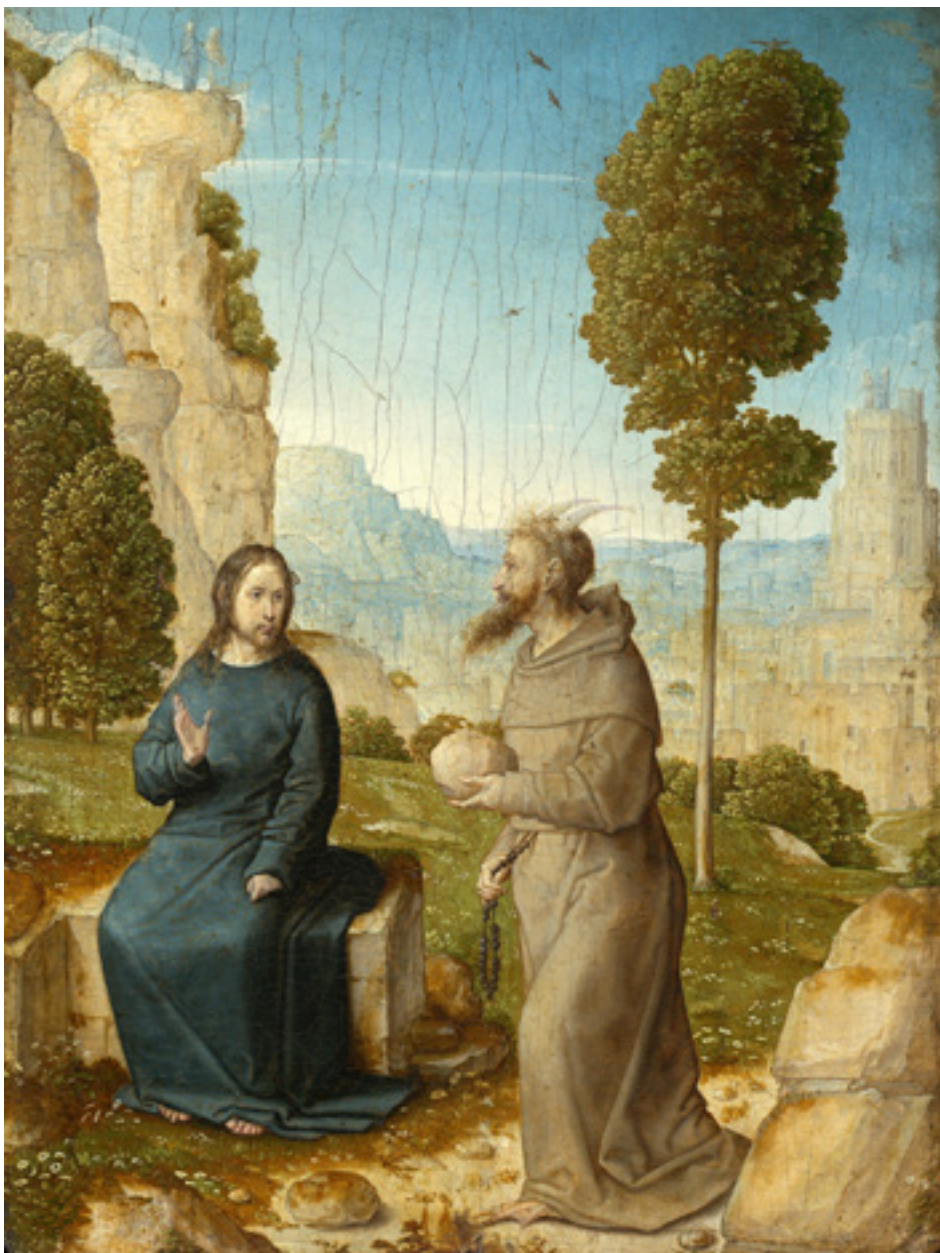
Juan de Flandes (kb. 1460–1519): Krisztus megkísértése a pusztában. Olaj, fa, 1500/1504 körül

Isten megmondta, hogyan kell a javakat igazságosan elosztani. Ám ha egy hatalom nem így tesz, hanem enged éhezteni, kizsákmányolni, elnyomni tömegeket, és az így cselekvőket még támogatja is, akkor ezt a helyzetet az Úr alapvetően nem orvosolja. Nem fog kenyérbőséget és általában jólétet teremteni ott, ahol a társadalom a javak elosztását az ő parancsolataival, törvényeivel,