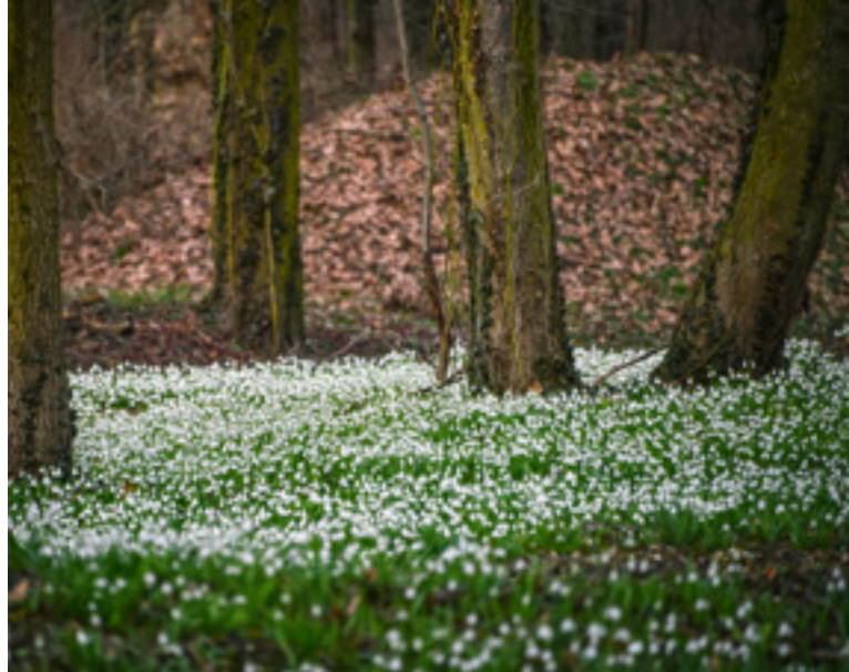
Hóvirágzás az Alcsúti Arborétumban