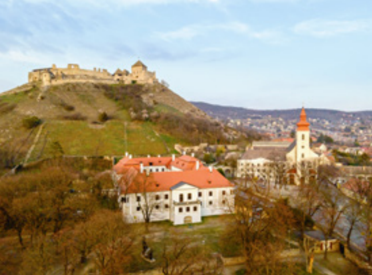
Sümeg, püspöki palota