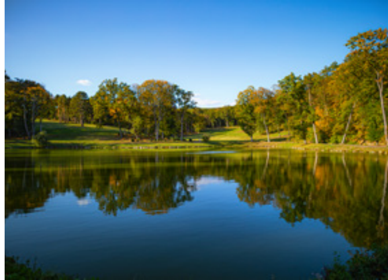
A Füzesrácdányi Károlyi-kastély kertje

jeleneteit, A gyertyák csonkig égnek című magyar filmet, illetve a több díjat is elnyert Magyar Golgota jeleneteit.