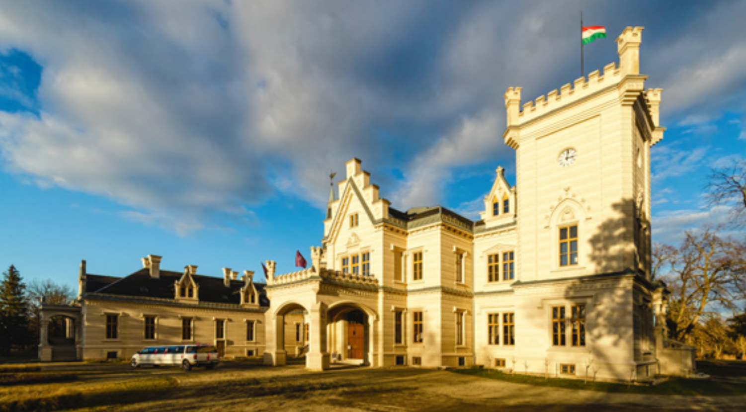
A nádasdladányi Nádasdy-kastély