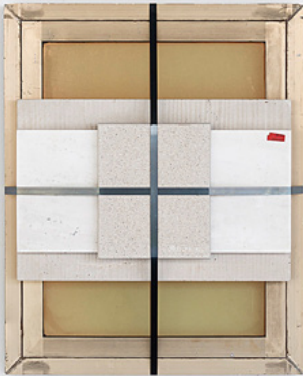
Nine Buildings, Stripped (Palast der Republik) 2019 Eloxidált alumínium, napvédő üveg, márvány (Palast der Republik, Kollektiv der Bauakademie der DDR, 1973–76); homokkő, beton (Humboldt-Forum, Franco Stella, 2013–2020); acél heveder 83×67×16 cm

Más munkákon több évtizeddel ezelőtti turista-térképek ikonjait kivágva, fehér alagra helyezve szembeülünk vele, mi számított építészeti értéknek, brandnek harminc-negyven évvel ezelőtt Párizsban, Berlinben vagy Budapesten, de vizsgálódás tárgyává teszi az egyes városok szlogenjének változását, tartalmának kiüresedését is.