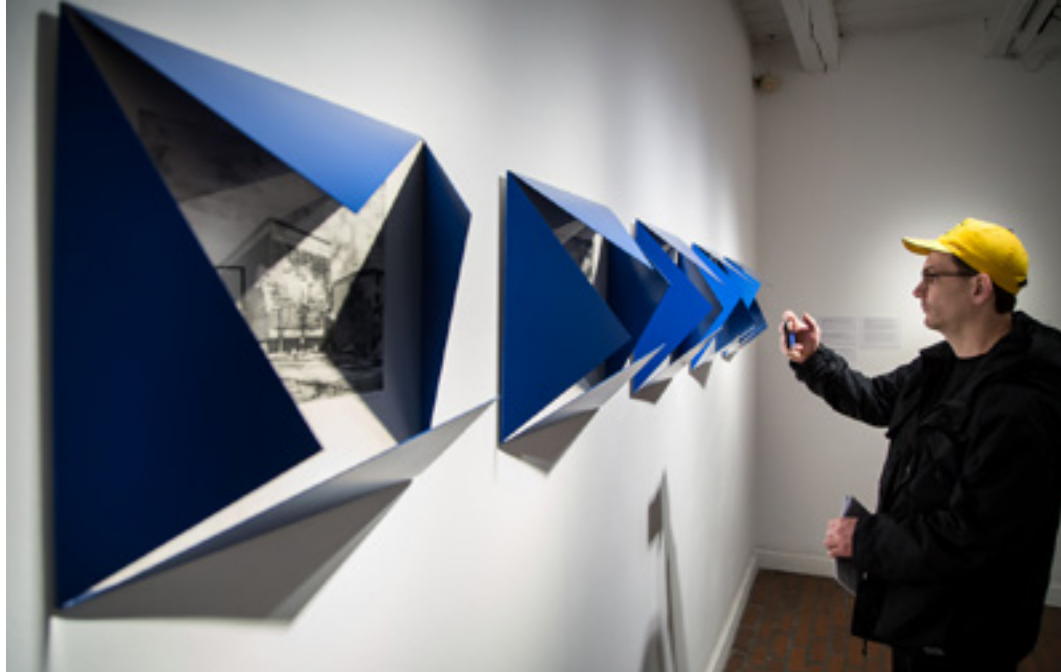
Részlet a kiállításról