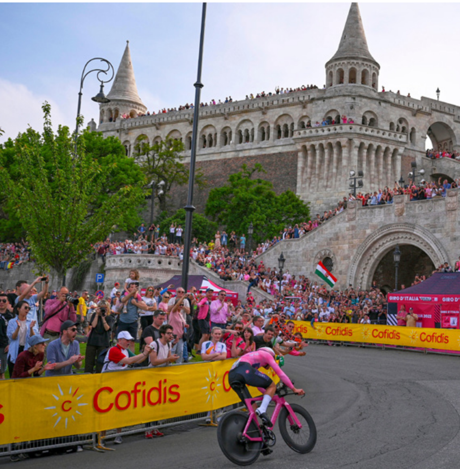
A Giro d'Italia kerékpáros verseny összetettjét vezető holland versenyző, Mathieu van der Poel teker fel a budai Várba a Hunyadi János úton a budapesti időmérő futamon 2022. május 7-én. A háromhetes versenyben vezető kerékpáros megkülönböztető meze hagyományosan a rózsaszín trikó, azaz a Maglia Rosa.