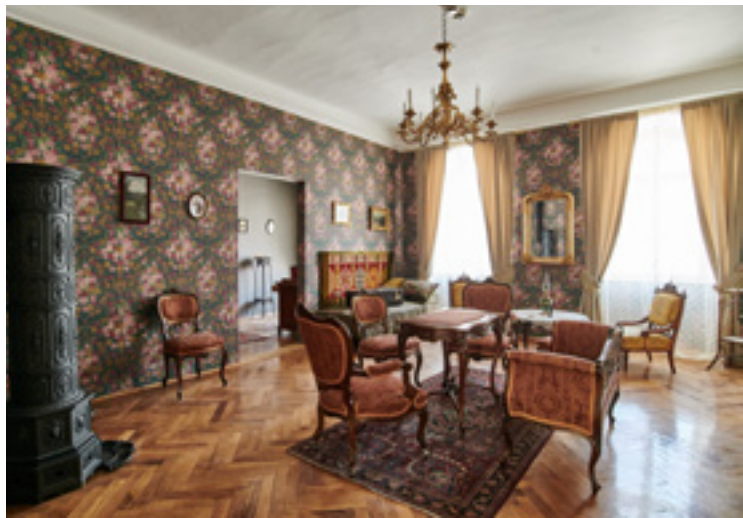
Az örmény ház szalonja