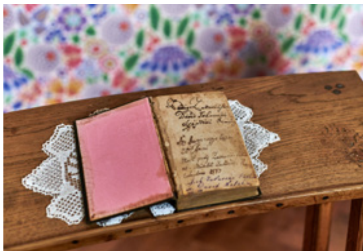
Imakönyv az örmény ház hálószobájában