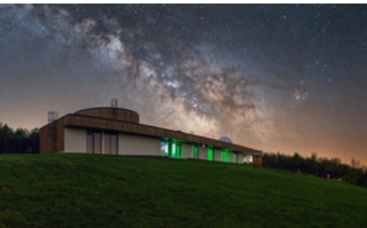
A Zselici Csillagpark

polarizációs mikroszkóp segítségével is vizsgálhatók a távoli világokból érkezett kövek. A fő attrakció pedig egy hatalmas, 32,3 kilogramm tömegű, földbe csapódott vasmeteorit, amelyet meg is érinthetünk.