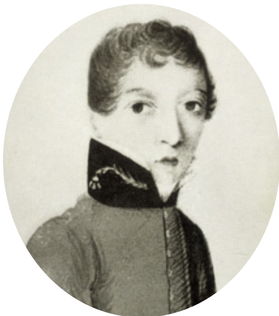
Ismeretlen szerző miniatúrája a fiatal James Barry-ről

James a gróf személyi kezelőorvosa lett, majd mélyreható reformokat vezetett be. Minden korábnál több figyelmet szentelt a tisztaságnak, a megfelelő vízellátásnak és csatornázásnak, minden ellenkezéssel szemben javított az elmebetegek helyzetén, a lepratelepek ellátását szinte megszállottan fejlesztette. Sokat küzdött a rabszolgák körülményeinek javításáért is, de a legtöbb ellenkezést azzal váltotta ki, hogy a börtönbe zárt feketéket személyesen kereste fel. Megkérdezte őket, hogy bánnak velük, és minden erejével azon volt, hogy ennek a végtelenen perifériára szorult csoportnak a helyzetén is javítson.