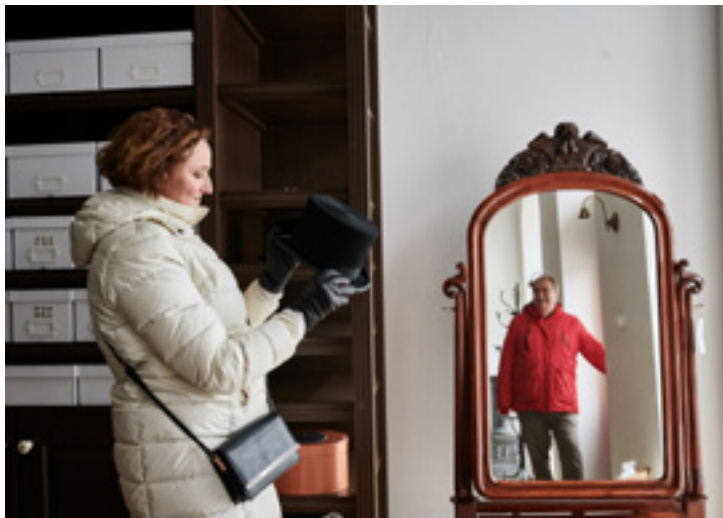
Próba a kalapszalokban