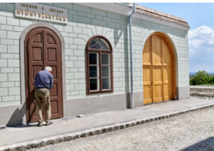
A gyógyszertár homlokzata

Erdély néprajzi, kulturális, történelmi tekintetben is önálló entitás, kiemelt, kitüntetett helye van a magyar történelemben. 1998-ig a régi, kommunista időkben létrehozott alapító okiratunk alapján működtünk: nem volt lehetséges, majdhogynem tiltott volt, hogy határon túli területekkel foglalkozunk. Amikor végre ez a lehetőség is bekerült a telepítési koncepcióba, el kellett döntőnünk, hogy legyen egy új, határon túli tájegységünk, vagy kövessük a szakmai megfontolásokat a skanzen bővítésénél. A szakmai kánon, nagyon helyesen, azt mondja, hogy a kulturális jelenségeket nem kötik a közigazgatási határok. Ebből az következik, hogy ha Burgenlandban ugyanazt találjuk, mint amink az Őrség-Göcsej tájegységben már felépült, akkor nem hozunk épületeket, eszközöket Burgenlandból. A Csallóköz a Kisalfölddel, a Felvidék