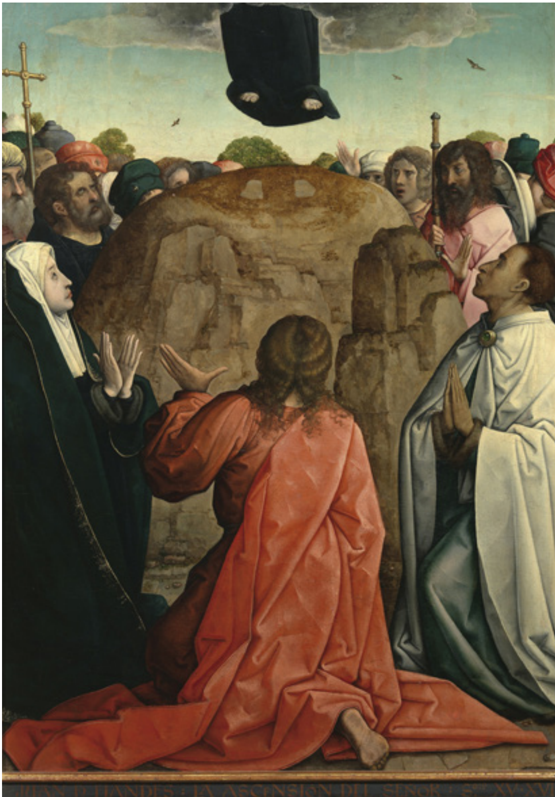
Juan de Flandes (1460–1519): A Feltámadás. A madridi (Spanyolország) Museo del Prado gyűjteményéből