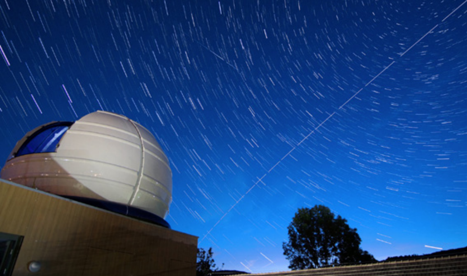
Pannon Csillagda, Bakonybél