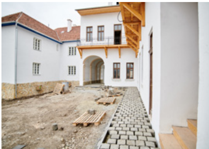
Márciusban még gőzerővel folyt az erdélyi tájegység építése