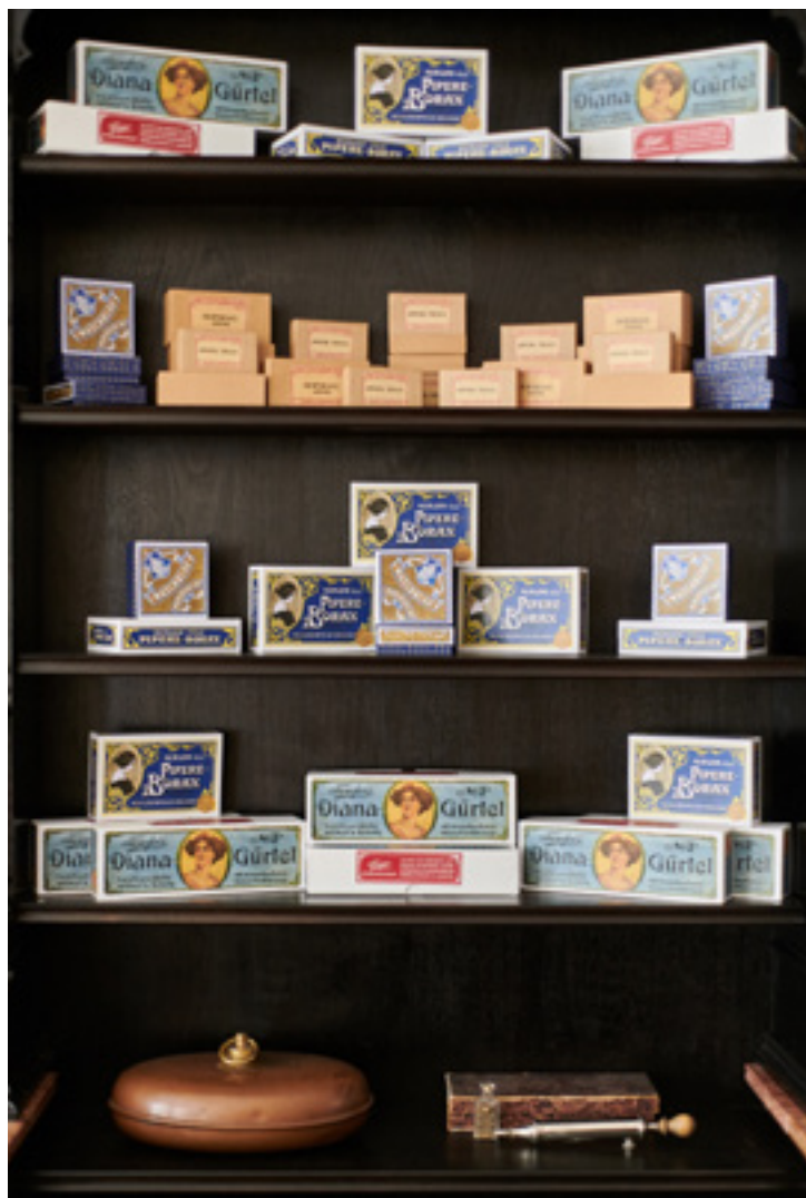
Polc a patikában

Erdély néprajzi, kulturális, történelmi tekintetben is önálló entitás, kiemelt, kitüntetett helye van a magyar történelemben. 1998-ig a régi, kommunista időkben létrehozott alapító okiratunk alapján működtünk: nem volt lehetséges, majdhogynem tiltott volt, hogy határon túli területekkel foglalkozunk. Amikor végre ez a lehetőség is bekerült a telepítési koncepcióba, el kellett döntőnünk, hogy legyen egy új, határon túli tájegységünk, vagy kövessük a szakmai megfontolásokat a skanzen bővítésénél. A szakmai kánon, nagyon helyesen, azt mondja, hogy a kulturális jelenségeket nem kötik a közigazgatási határok. Ebből az következik, hogy ha Burgenlandban ugyanazt találjuk, mint amink az Őrség-Göcsej tájegységben már felépült, akkor nem hozunk épületeket, eszközöket Burgenlandból. A Csallóköz a Kisalfölddel, a Felvidék