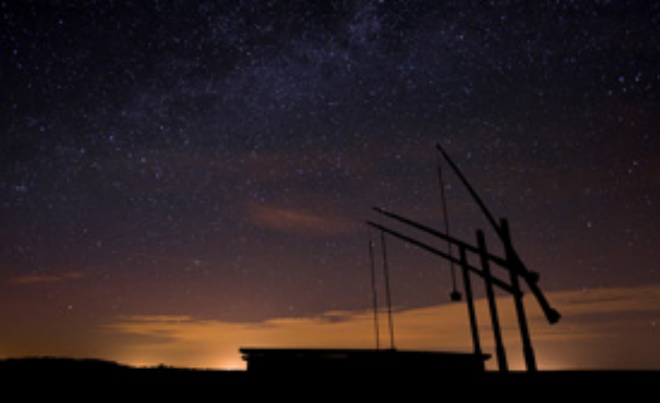
A Hortobágyi Csillagoségbolt-park