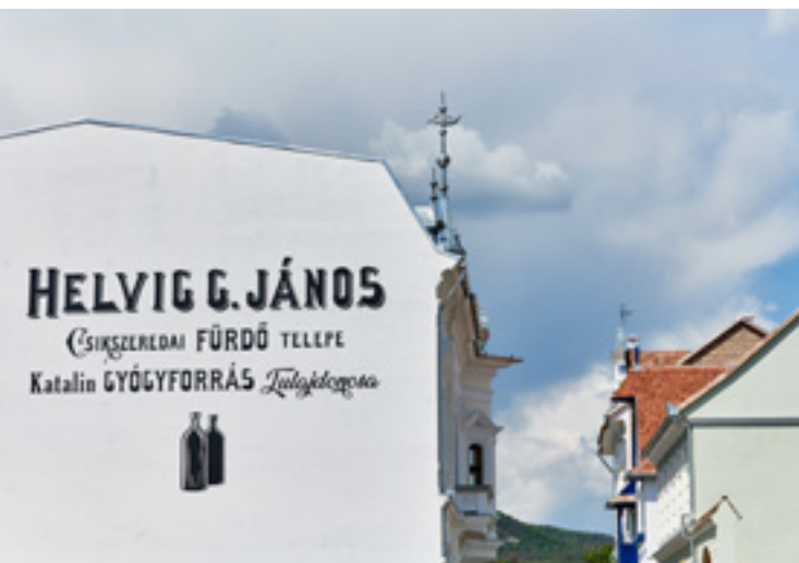
Korabeli reklám a kávéház tűzfalán