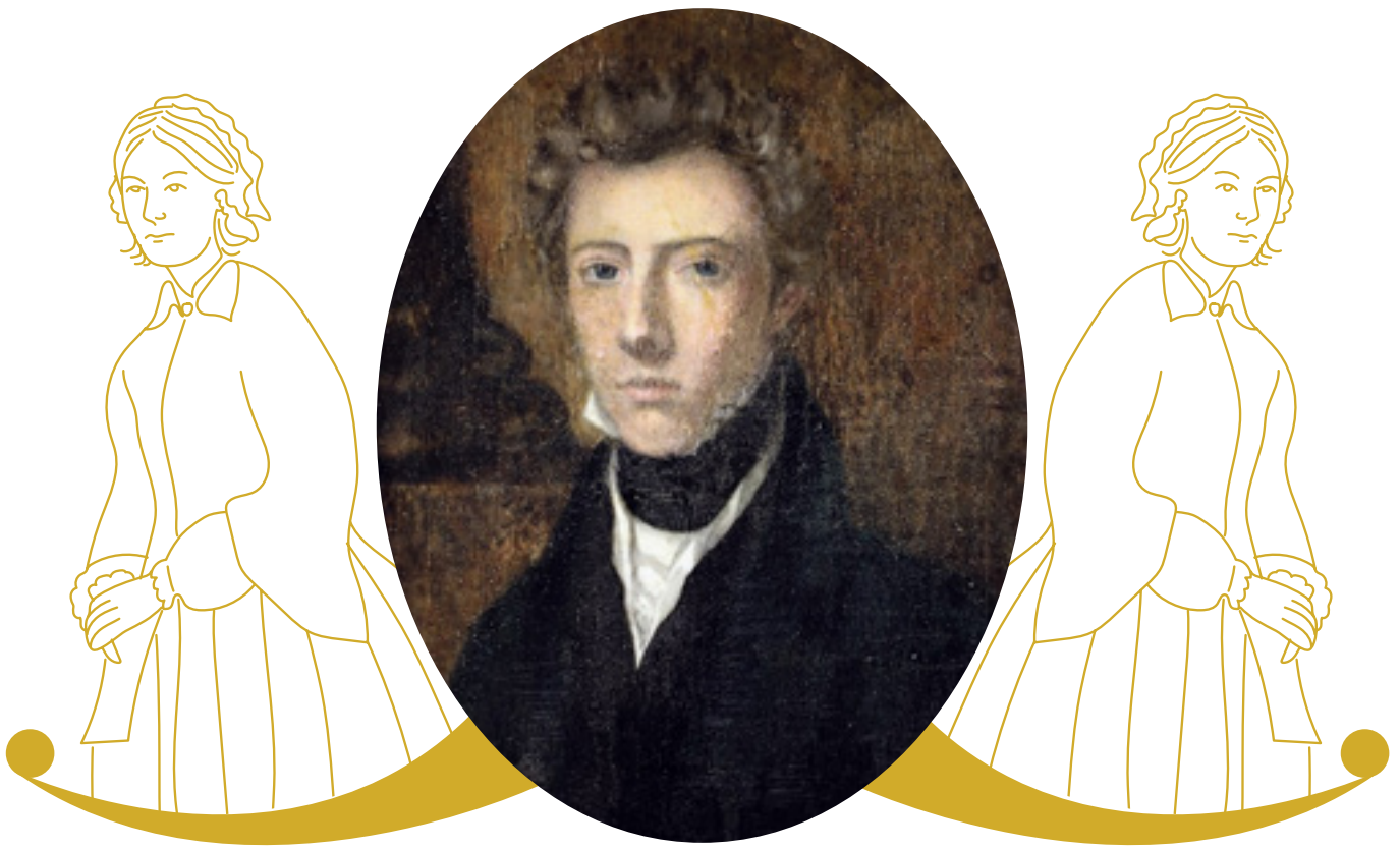
James Barry portréja az 1820-as évekből