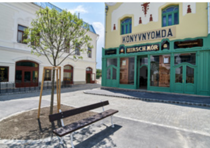
A „marosvásárhelyi” könyvnyomda homlokzata