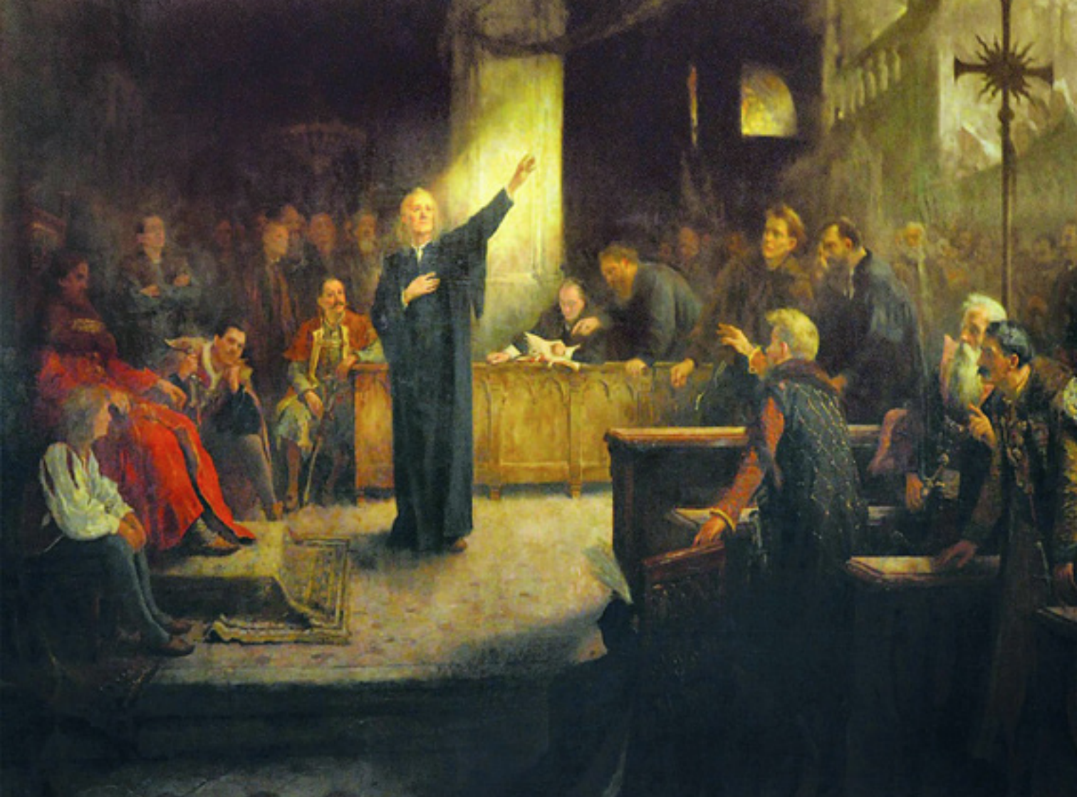
Körösfői-Kriesch Aladár (1863–1920): A tordai országgyűlés. 3×4 méter, olaj, vászon, 1896

gyülekezetbe, és annak lelkipásztoraként, majd püspökeként, János Zsigmond fejedelem udvari papjaként működött tovább. Az udvarnál került kapcsolatba Giorgio Biandratával, Blandrata Györggyel, aki a fejedelem orvosaként radikális antitrinitárius nézeteket képviselt. Dávid általa ismerkedett meg a Genfben máglyára küldött spanyol Miguel Servet és a lengyel földön menedéket találó itáliai Fausto Sozzini szentháromságot tagadó radikális nézeteivel, amelyekhez idővel maga is csatlakozott. 1565-től nyíltan kétségbe vonta a Szentháromságról és Krisztus istenségéről a reformátorok által is vallott tanítást, arra a meggyőződésre jutott, hogy „a Szentírás egy Istent mond, nem hármat, egy Krisztust, nem kettőt, egy hitet, egy keresztséget és egy úrvacsorát. Semmit sem mond kettősnek”.