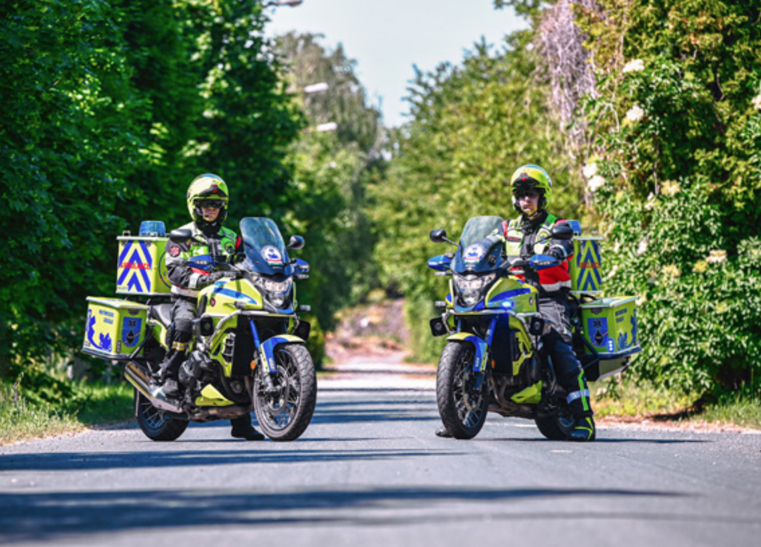
Önkéntesek készenlétben a balatonvilágosi autópálya-mérnökségnél