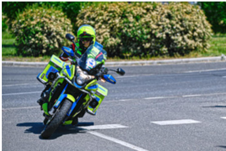
A motorok 30 km-es körzetben a helikopternél is gyorsabban kiérnek az esethez

A hatékony tervezésnek pedig európai hírneve is lett: angolok, csehek, szerbek és horvátok is jöttek már a Magyar Mentőmotor Alapítványhoz. „Hallottak rólunk, mert azt tudni kell, hogy az egész világon nincs még egy olyan