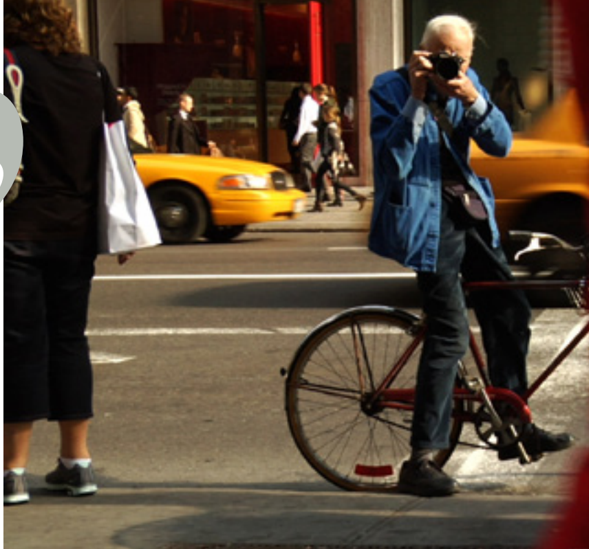
Bill Cunningham munka közben. New York, New York City, Egyesült Államok, 2010