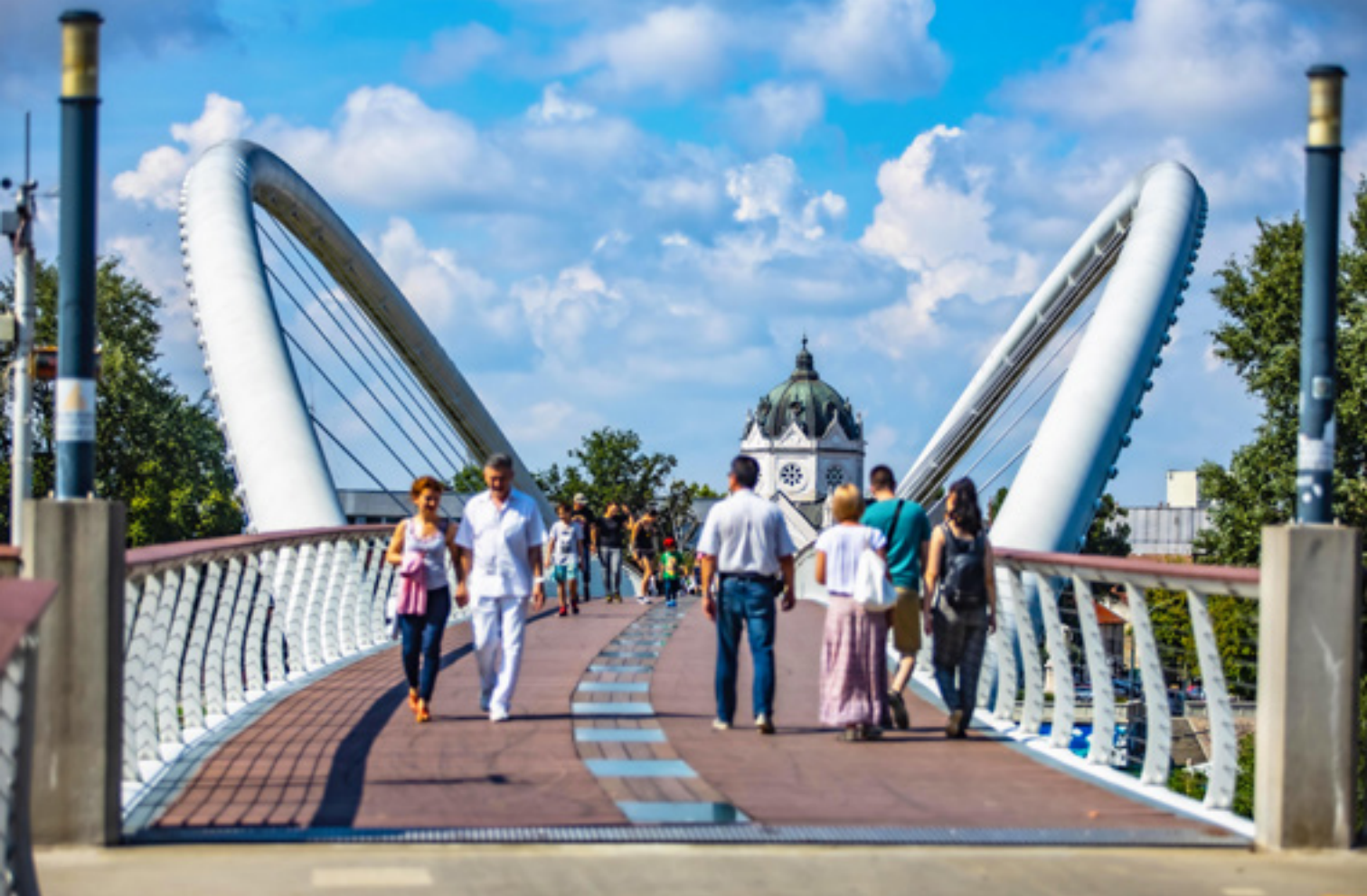
Szolnok, Tiszavirág híd

amikor 1849-ben Szegeden járt. Ennek a háznak az erkélyéről mondott beszédet a város népéhez. Az épület 1857-ben Ferenc József osztrák császár lakhelyéül szolgált szegedi látogatása idején. 1918-ban erről az erkélyéről hirdették ki az őszirózsás forradalom győzelmét, majd 1919-ben az ellenforradalmi kormány megalakulását.