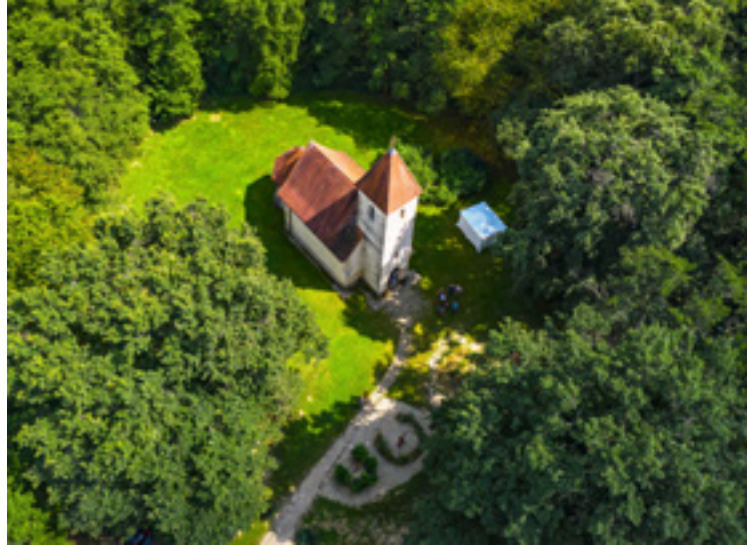
A veleméri Árpád-kori templom

Az Őrség jellegzetes településtípusai a dombtetőkre épült házcsoportok, a szerek. Lakóit még Árpád-házi királyaink bízták meg a vidék őrző-védő feladataival, innen a tájegység elnevezése. Az egykori őrállók, őrzők és gyepűőrök leszármazottai ma is büszkén hangoztatják, hogy az ő népcsoportjuk az egyetlen az országban, amely a honfoglalás óta ugyanott él. Az Őrségre jellemző szeres településrendszert szerről szerre is bebarangolhatjuk, de akár bringára is pattanhatunk. Látnivaló pedig szinte