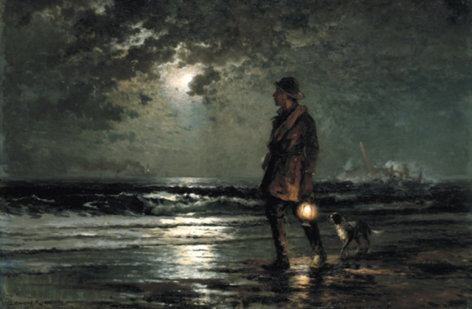
Edward Moran (1829–1901): Az életmentő lámpás. Olaj, lenvászon, 1893 körül

A bizonyosságot azért nem találjuk meg, mert nincsen mérték, amihez hozzámérhetnénk magunkat, életünket, igazunkat. Korunk az érték- és mértékvesztés kora. A rengeteg hiábavaló keresésben a költemény igazságot kutató kapitányának reményei meghiúsultak – az emberéi általában, avagy az egyénéi, mert elvben mindenki a saját élethajójának kapitánya. Olyannyira meghiúsultak ezek a remények, hogy a modern kor legtöbb embere már nem is hiszi, hogy megtalálhatja valaha, amit a szív legmélyén pedig mindenki keres, az igazságot. Ezért olyan életveszélyes a mi korunk. „Mi az igazság?” – kérdezi Poncius Pilátus, a Szentföld római helytartója, a hatalom embere a megkötözött, hozzá kihallgatásra vezetett Jézustól János evangéliumának 18. fejezetében. Megkaphatná a választ, Jézus Krisztus, és egyedül ő megadhatná azt neki, ám Pilátus, a kora divatos relativista