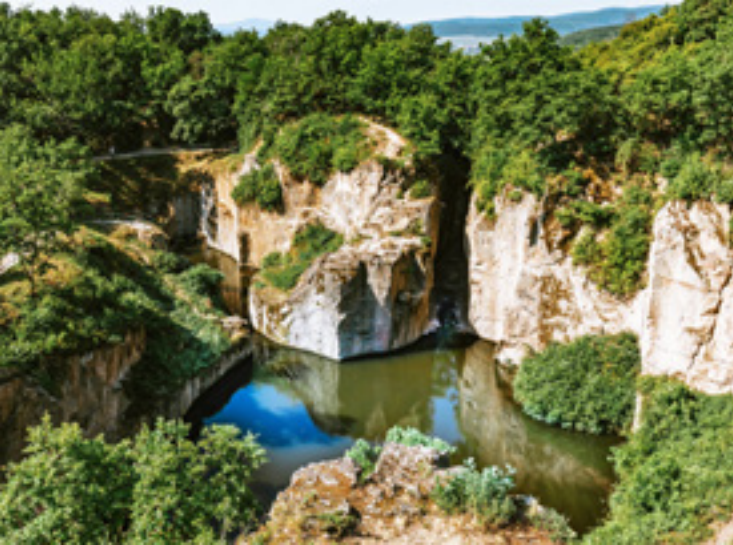
A Megyer-hegyi tengerszem

de a járókelők rövid üzenetei is. A különleges formavilágú hidat, amely az esti kivilágításban még impozánsabb, 2021-ben az Év Hídjává is választották. Mivel kerékpárt is kialakítottak rajta, nemcsak gyalogosan, de két keréken is teljesíthetjük a közel fél kilométeres távot.