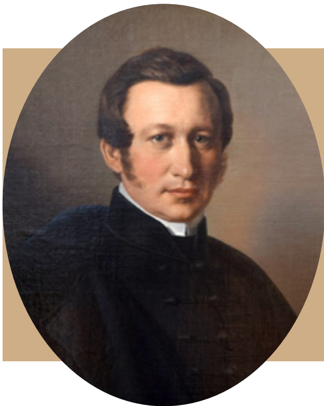
Barabás Miklós (1810–1898) portréja Czuczor Gergelyről (1837, részlet)

Pannonhalmára, de megfordult a rend győri gimnáziumában is. Közben sokat fordított, olyan klasszikusok antik műveit tolmácsolta, mint Cornelius Nepos , Horatius , Tacitus vagy a középkori himnuszköltők, de átültetései között ott voltak La Fontaine írásai is. Amikor az Akadémia 1845-ben őt bízta meg a tervezett Magyar Nyelv Szótárának kidolgozásával, rendi jóváhagyással és akadémiai támogatással a zavartalan munka érdekében ismét Pestre költözött.