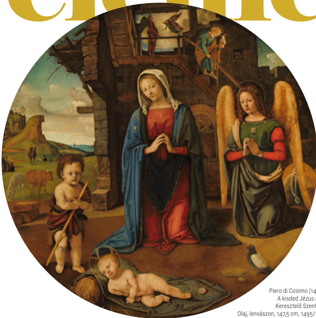
Piero di Cosimo (1462–1522): A kisded Jézus a gyermek Keresztelő Szent Jánossal. Olaj, lenvászon, 147,5 cm, 1495/1505 körül