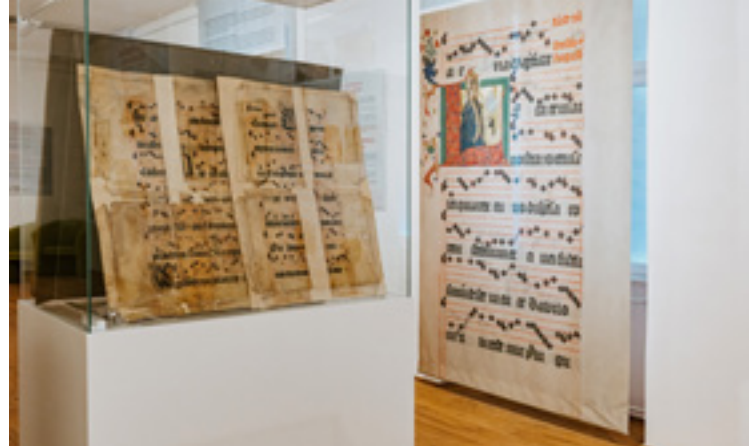
A Zalka-antifonále a győri Egyházmegyei. Kincstár és Könyvtár kiállítóterében

A Kállay ősi magyar család, még a honfoglalás idején érkeztek hazánk területére, és meghatározó szerepet töltek be történelmünkben. Kúriáik közül