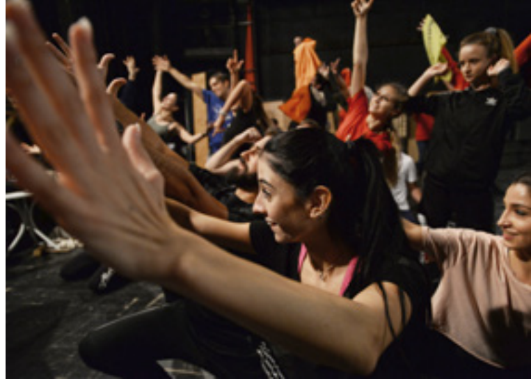
Csoportjelenet az előadás egyik próbáján