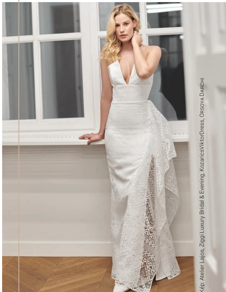
Kép: Atelier Lajos, Ziggi Luxury Bridal & Evening, KozaricsViktorDress, ORSOVA DARCHI

A Ziggi Luxury Bridal & Evening menyasszonyi és alkalmi ruha márkát Oláh Zsigmond hozta létre 2020-ban. Több mint 10 éves dizájnertapasztalatára építve Zsigmond mestere a formázásnak. Ahogy annak idején Cristóbal Balenciaga , ő is magabiztosan nyúl a legrágább kelmékhez, és úgy formázza az anyagokat, hogy a látvány lélegzetelállító legyen. Vallja, hogy minden nőben ott lakozik az a különleges és megfoghatatlan erő, amelyet nőiességeként emlegetünk. Művészi szemlélettel megalkotott ruháival eléri, hogy minden nő megélje azt a kivételes érzést, amikor egygyé válik az öltözékével. Rafinált, kecses és egyben kényelmes darabokat készít tiszta selyemből és csipkéből – kortól és testalkattól függetlenül mindenkinek.