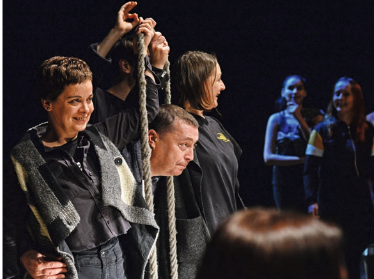
A háborún innen, a megmaradásért küzdve