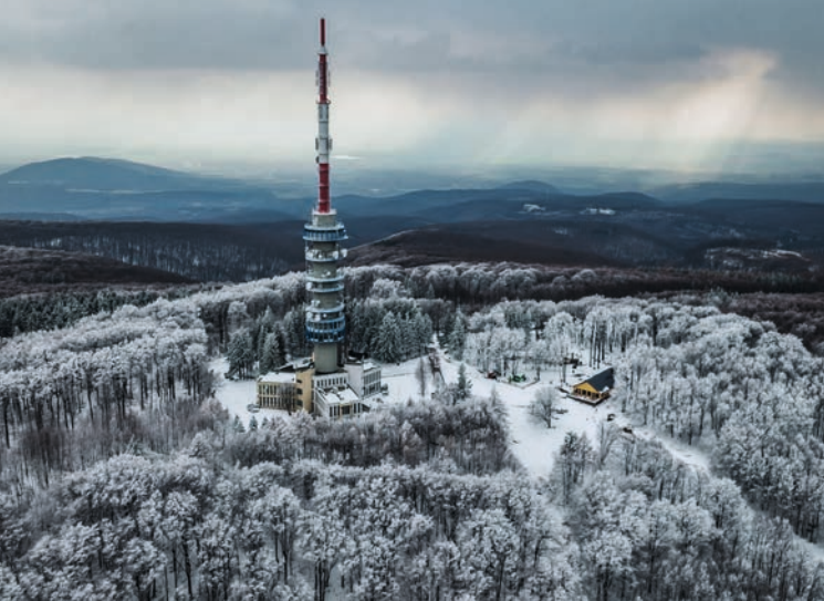
A Kékes téli időben