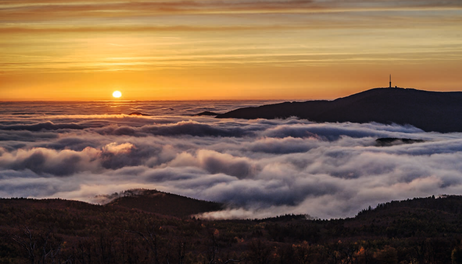
Téli napfelkelte Galyatetőről nézve, a képen jobb oldalon a Kékes

Akik kedvelik a kilátókat, azokat az előbbi bemelegítés után várja a Kozmáry-, a Hanák Kolos- és a Muzsla-kilátót érintő 6,5 km-es körtúra. Közülük a legikonikusabb a Mátra jelképévé vált Kozmáry-torony, amely 1900-ban épült, és több mint 370 m magasan áll a Dobogó-kő hegyen – amely nem összetévesztendő a Visegrádi-hegység közismert csúcsával.