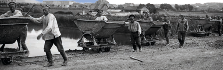
Csatornaépítésen résztvevő orosz hadifoglyok a mai Feneketlen-tónál, 1915

amelyet mélyre és egyre mélyebbre bocsátott alá a mérnök, míg aztán elfogyott a zsinege és a türelme is.