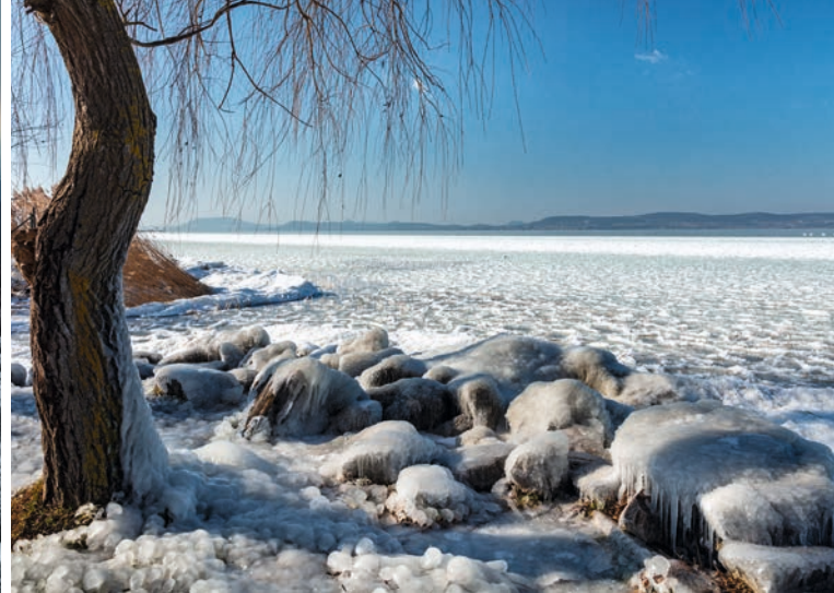
A befagyott Balaton

A barlang a Dunántúl egyik legfontosabb régészeti lelőhelye, és egyben az egyik leglátványosabb is. A mélyből feltörő termásvíz boltozatos üregeket oldott a mészkőben, így keletkeztek az Öreg-kő barlangjainak járatai és nagyobb termei.