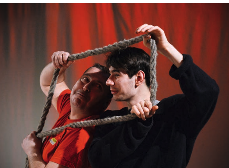
Közös hurokban Petőfivel