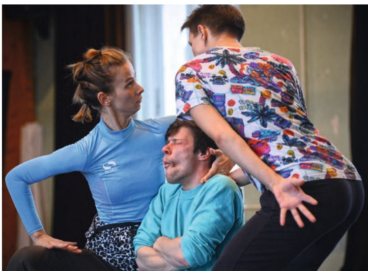
„Csak két éhes pók harcolt életre-halálra”