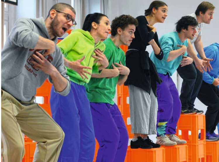
Az énekeszéd új jelentésréteget ad a szövegnek