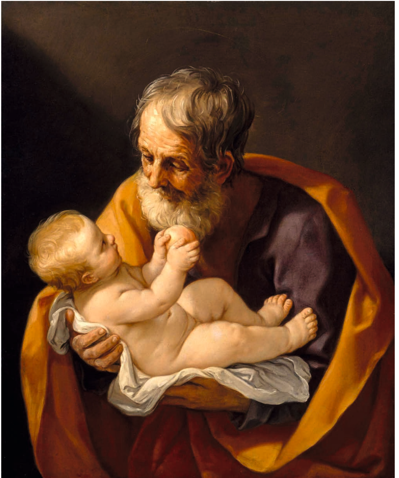
Guido Reni (1575–1642): Szent József a kisdéd Jézussal. Olaj, lenvászon, 121×101 cm, 1640