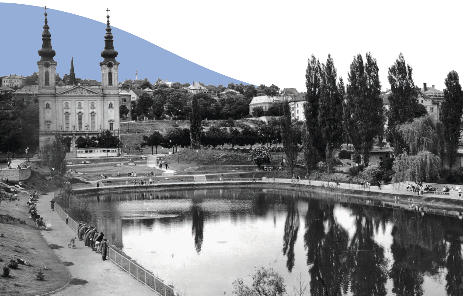
Feneketlen-tó, szemben a Szent Imre-templom

hordott erre a területre, hogy közvetlenül a gyár mellől bányászhatták a nyersanyagot. Az évek során a téglagyári munkások egyre mélyebbre ástak, amíg 1877-ben egy víz alatti forráshoz értek az agyaggödörben. A szóbeszéd szerint a feltörő víz olyan erős volt, hogy a dolgozók felszerelésüket, gépeiket hátrahagyva menekültek ki a gödörből, ami 24 óra alatt tóvá duzzadt. Vannak, akik szerint az esz-közök még mindig a tó fenekén pihennek. Sokkal valószínűbb azonban az a forgatókönyv, hogy a téglagyár 1889-es bezárása után a talajvíz szép lassan feltöltötte az egykori agyagbányát.