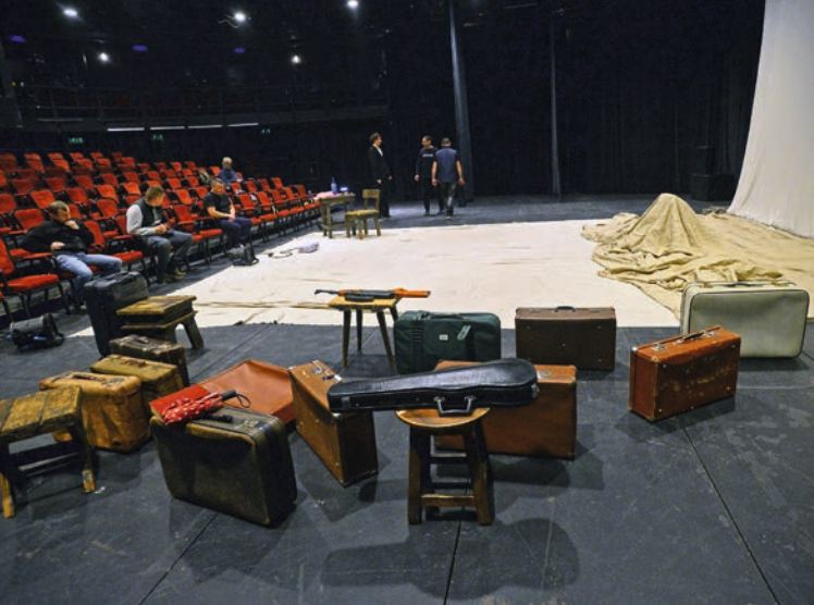
Az előadás hatalmas vásznai: kötőszövet és vitorla