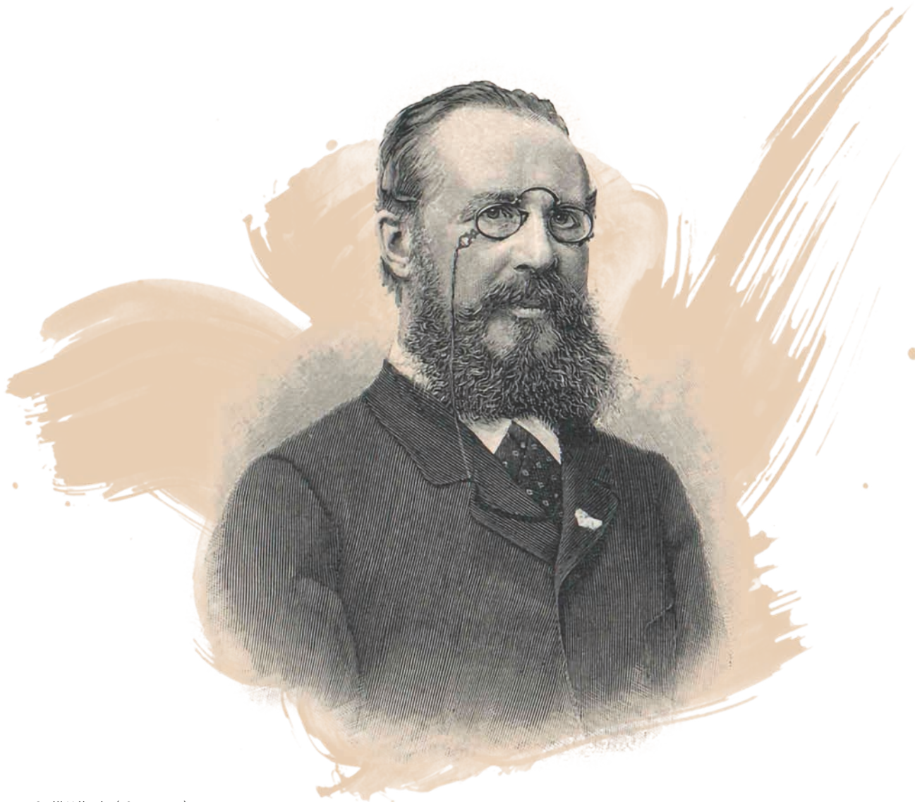
Széll Kálmán (1843–1915)

az atyai barát, Deák Ferenc gyámleányát, Vörösmarty Mihálynak és feleségének, Csajághy Laurának árván maradt Ilona lányát vette feleségül. A házasság révén a Széll család a magyar irodalom egy másik nagy alakjával, Bajza Józseffel és annak családjával is rokonságba került. A parlamentbe bekerülve Széll Kálmán a kormánypárt soraiban Deák szűkebb környezetéhez tartozott, éveken át viselte az országgyűlés jegyzői tisztségét, előadója volt az országgyűlés pénzügyi bizottságának, tagja a horvát ügyek bizottságának és a hadügyi bizottságnak, de közben gazdálkodott is rátóti birtokán, ahol a Széll kúriában Deák Ferenc is gyakran vendégeskedett.