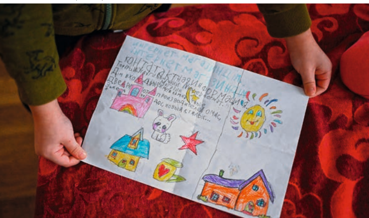
A gyerekrajzok otthonosabbá teszik a szállást