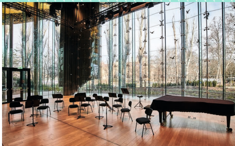
A koncertterem zongorája, háttérben a Városligettel