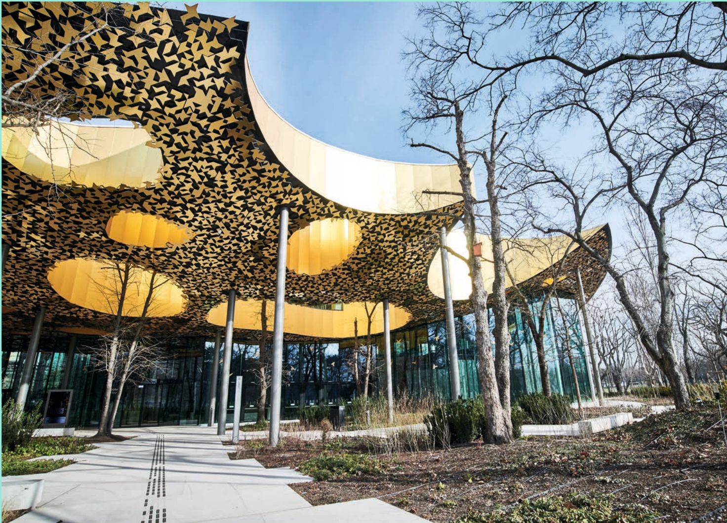
A Magyar Zene Háza főbejárata

A MAGYAR ZENE HÁZA 2022-BEN 8. HELYEZETT LETT.