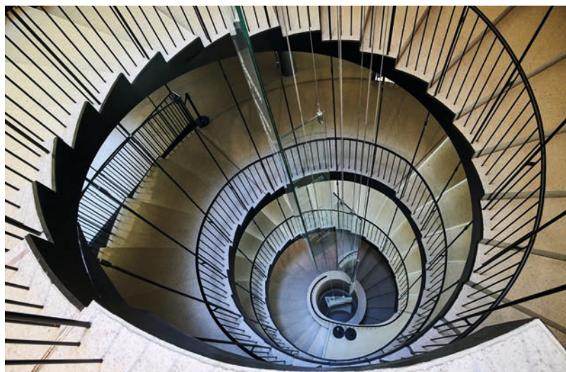
Az épület egyik leglátványosabb eleme a csigalépcső

A Városligeti-tó, a Vajdahunyad vára és a Műjégpálya épülete közelében felépült, 2022 januárjában átadott épületet a japán sztárpépítész, Sou Fujimoto tervezte. Tervét nyílt pályázaton, 2014-ben választották ki 168 pályamű közül. A megvalósulást az eredményhirdetés óta világszerte komoly figyelem övezte: A BREEAM elnevezésű nemzetközi épületminősítési rendszer környezettudatossági szempontból példaértékűnek minősítette az építési munkálatokat, a CNN és a World Architecture Community (WAC) pedig 2021 egyik legjobban várt új