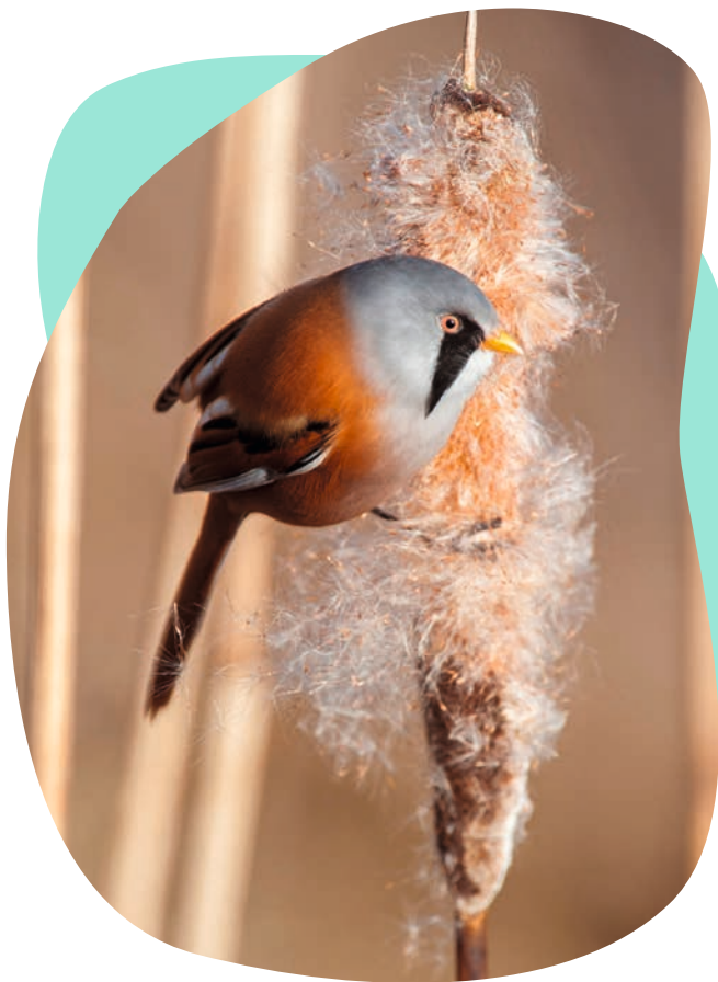
A barkóscinege ( Panurus biarmicus ) a verébalkatúak ( Passeriformes ) rendjébe tartozik, 2023-ban az év madarának választotta az MME

megszerzéséhez. A madarakat fel kell ismerni küllem alapján, szabad szemmel, távcsővel vagy teleszkóppal, ismerni kell a fiatalok, a hímek és a tojók hangjait” – emeli ki Orbán Zoltán.