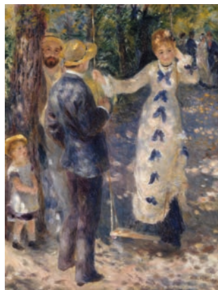
Pierre-Auguste Renoir: A hinta, 1876