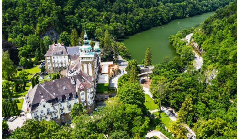
A lillafüredi kastélyszálló

A holtágakkal és a belső tavakkal szabdalta ártéri rezervátum az egyik legszebb hazai látnivaló Közép-Magyarország déli részén, amelyet leginkább hajóba szállva, evezés közben ismerhetünk meg. A Duna mentén kialakult mocsaras vidék páratlan ökoszisztémával, kivételes növény- és állatvilággal rendelkezik, amelynek mindennapjait a Duna vízállása határozza meg. Túránk során különleges vízimadarakat, kócsagokat, gémeket, jégmadarat, rétisast, békászó sast, kerecsensólymot és hódokat, sőt akár nagyvadakat: őzet, vaddisznót is könnyen megpillanthatunk. A legnagyobb magyar ártéri erdő „legjeit” hosszan lehet sorolni: itt található az ország