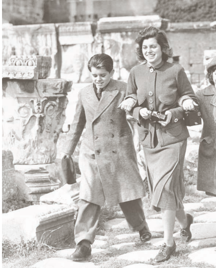
Joseph Kennedy családja Rómában; 1939. A képen Rosemary Kennedy kiemelve

Rosemary ezalatt minden korábbinál rosszabb állapotba került: éjjelente megszökött a bentlakásos iskolából, ott-hon tört-zúzott, és egy különösen vad kitörés alkalmával még a saját nagyapját is megtámadta. Epilepsziás rohamai voltak, alvajárá lett, és az egész létezése egyre kínosabb lett a családja számára. Ráadásul az apja – mivel a személyes hitelét nagyrészt elveszítette a politikai életben – minden energiáját a két legidősebb fia, Joseph és John előmenetelére fordította, így különösen kellemetlennek találta a lánya jelenlétét.