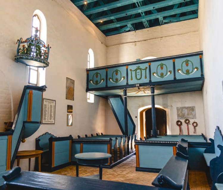
A szamosújlaki templom – Középkori templomok útja

az Alföld ősi arculatát felidéző mocsarak, valamint a Tápiómente gazdag néprajzi hagyományai várnak itt ránk.