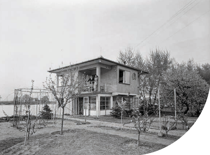
Nyaraló a Lupa-szigeten. Budakalász, 1941