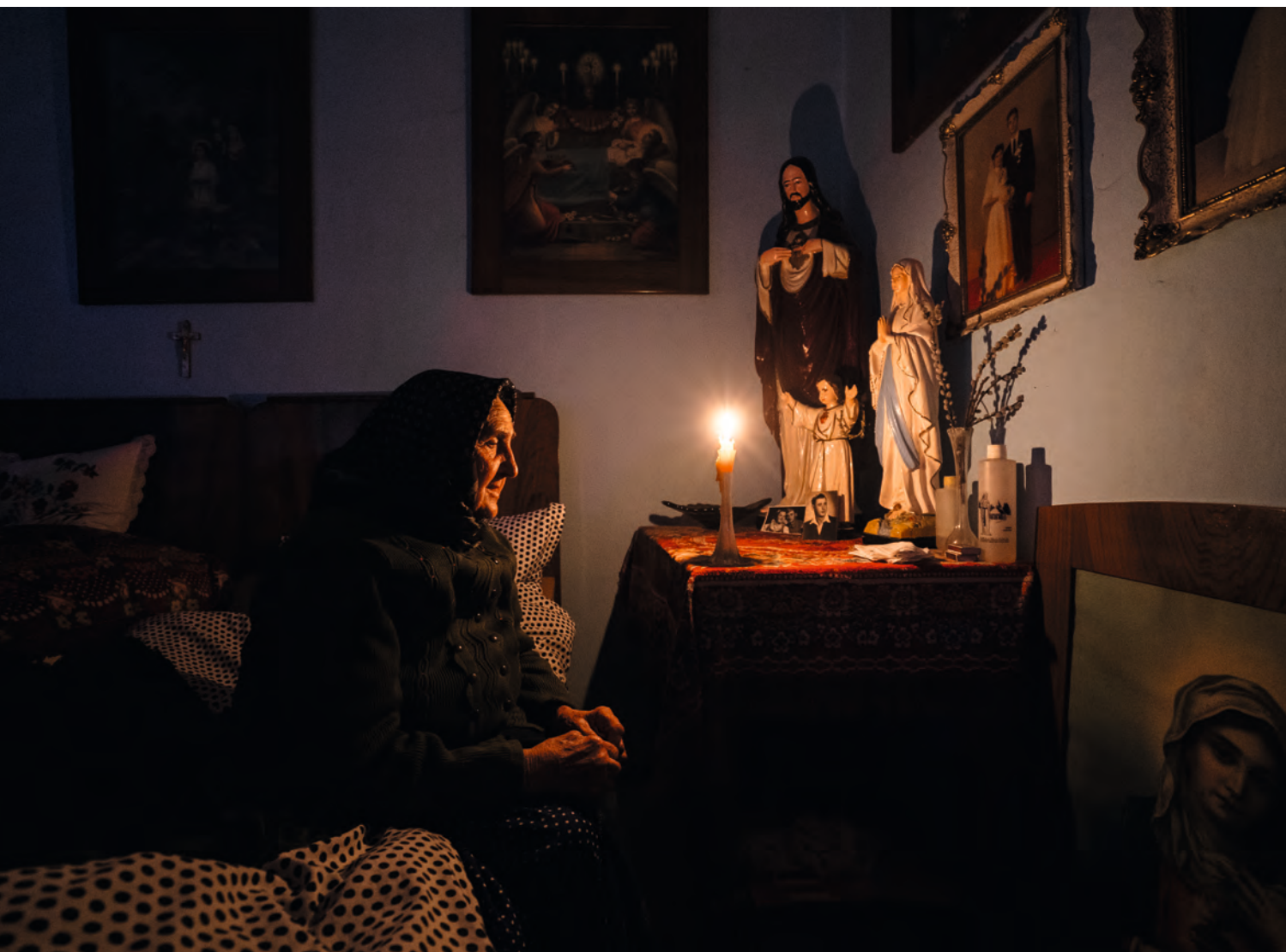
Erzsi néni esti imádsága