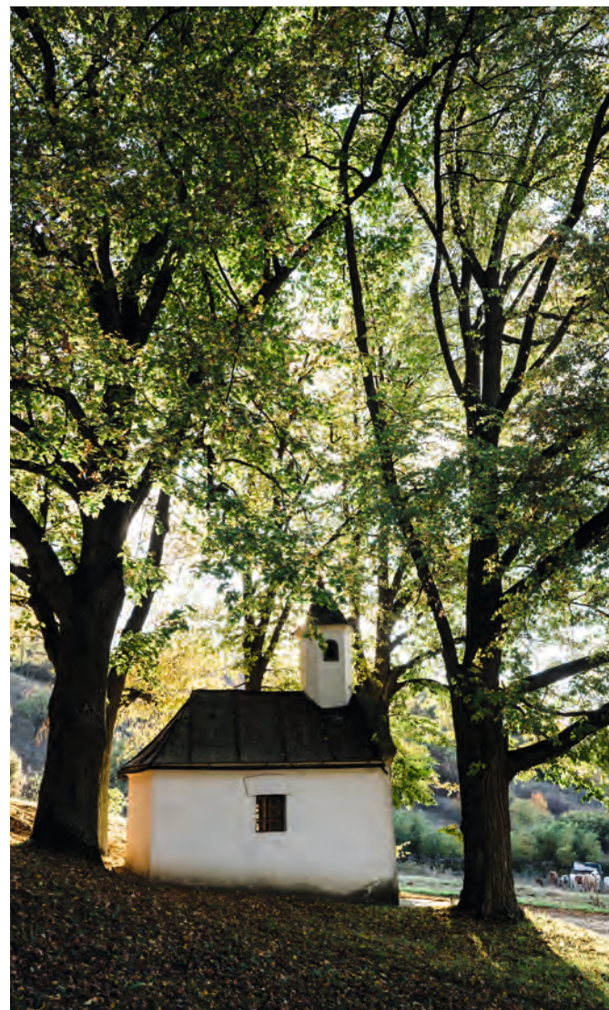
Fogadalmi kápolna, Rimóc