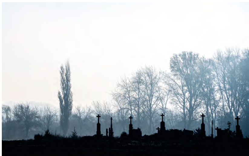
Novemberi reggel a temetőben, Kupuszina, Vajdaság

Fiatal lány vagy legény halálakor olyan szokások is éltek, amelyek több mozzanatban is megegyeztek a lakodalmi szokásokkal. A halott lakodalmának megülvése a halál utáni élet képzetköréből ered, általa mintegy megadják a halottnak, ami neki jár. A szokás nagyjából az egész magyar nyelvterületen egyformán ismert volt. A lakodalmi jelleget a viselet őrizte meg legtovább. Az eladó lány halottat menyasszonynak öltöztetve ravatalozták fel és tették koporsóba, kezébe jegykendőt adtak, a legény halottat ünneplő ruhába öltöztették. A századfordulón még többfelé előfordult, hogy a fiatalság a sírnál vagy a halotti toron táncolt.