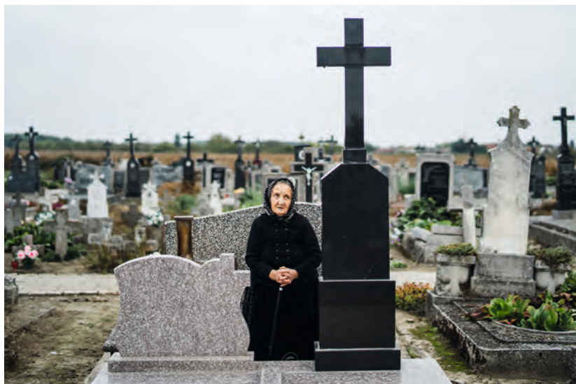
Idős asszony 17 évesen elhunyt lányának sírjánál