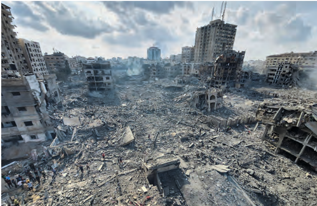
Izraeli légitámadásban megsemmisült épületek Gázavárosban. Gáza, 2023. október 10.