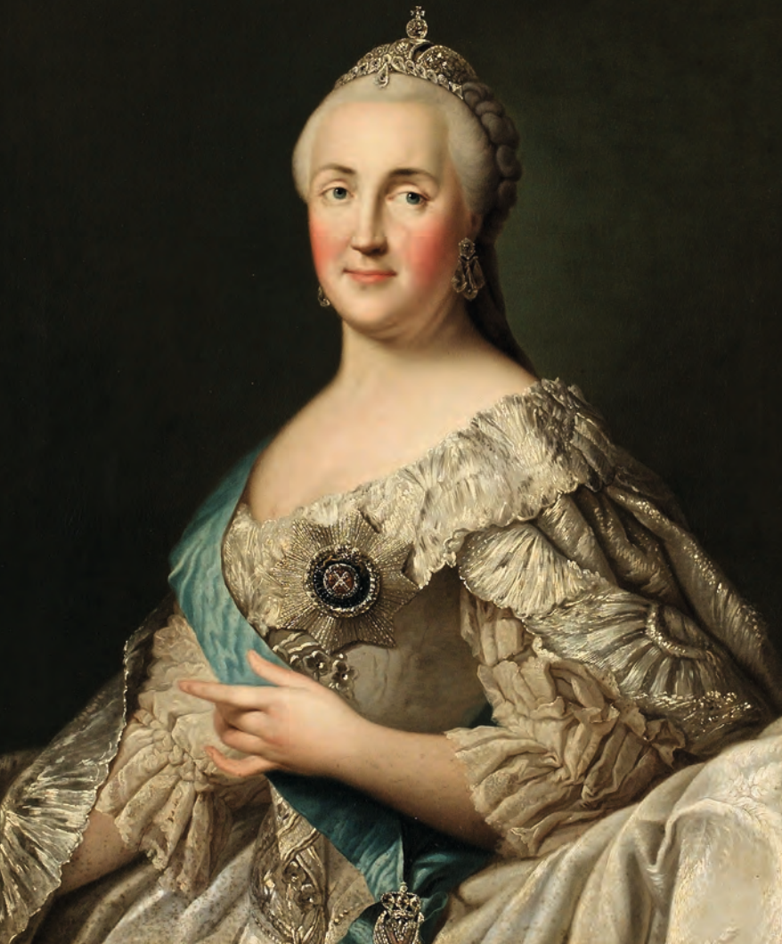
Vigilius Eriksen (1722–1782): II. Nagy Katalin portréja 1780 körül