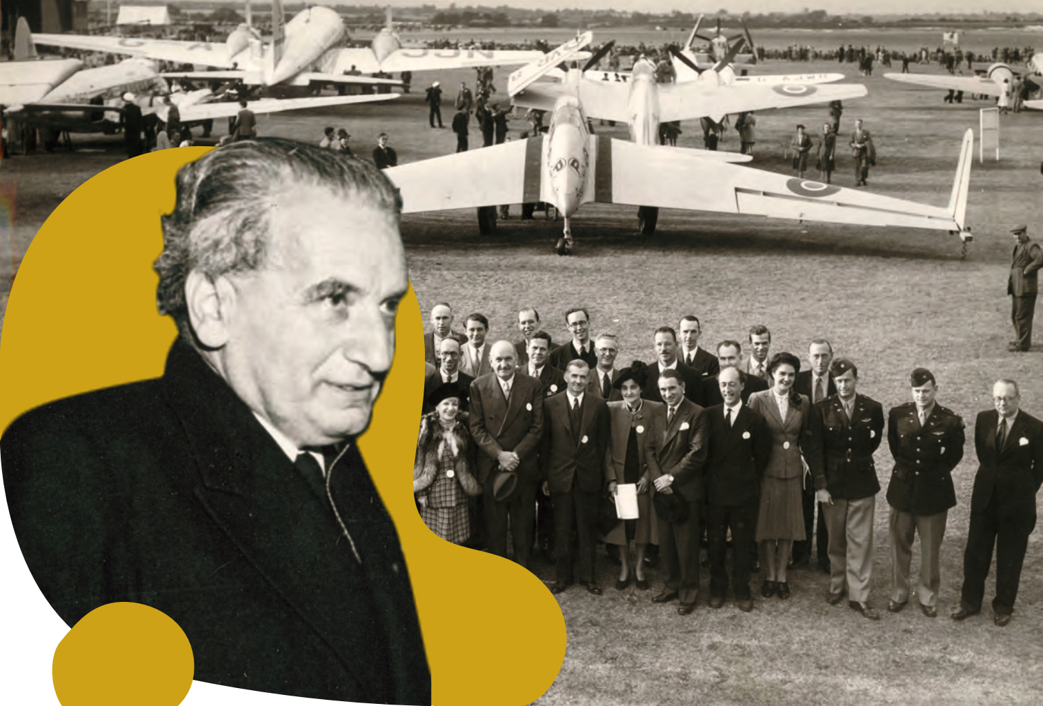
Kármán Tódor (1881–1963) | Csoportkép a farnborough-i (Egyesült Királyság) légitparádén, a képen Kármán Tóddal (1947)

Kármán Tódor az amerikai atomprogramban is dolgozó „marslakók” csoport tagja volt, nagy szerepet vállalt a szuperszonikus repülőgépek építésében, valamint a rakéta- és műholdtervezésben.