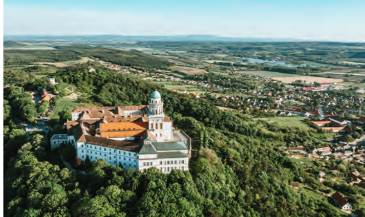
A Pannonhalmi Bencés Főapátság

– 118 méteres hosszúságával, 18 méter vastag alapfalaival, százméteres magasságával, 5660 négyzetméter alapterületével az ország legnagyobb temploma, sőt építése idején valószínűleg Európában is csak a római Szent Péter-bazilika, valamint a londoni Szent Pál-katedrális előzte meg?