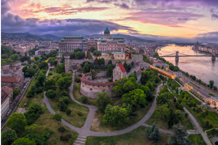
Budapest és a „nagy klasszikusok”