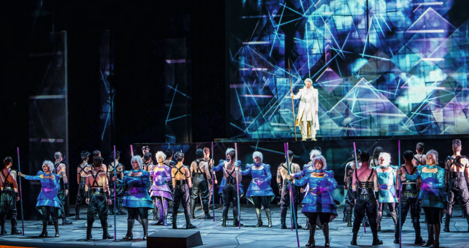
Jelenet A walkürből