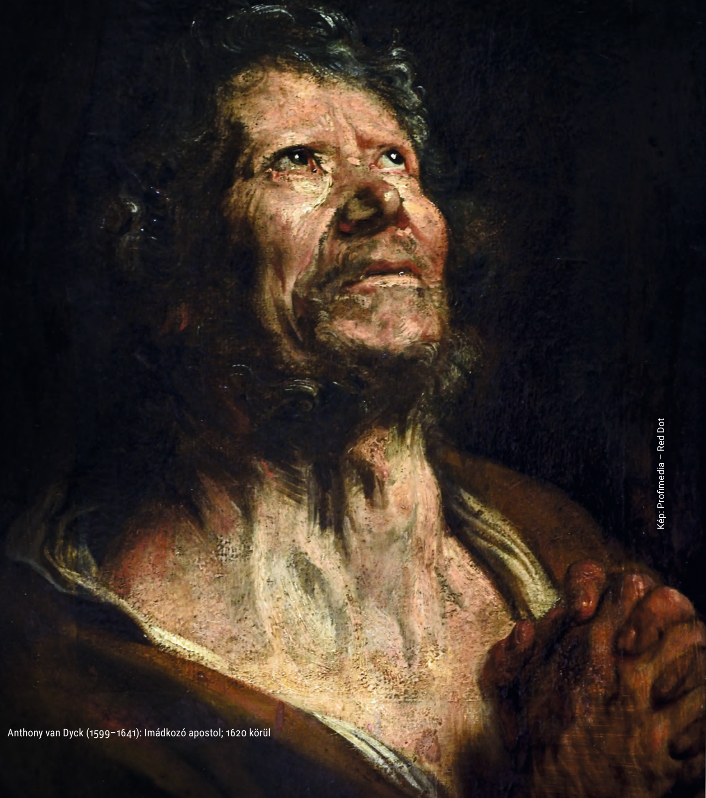
Anthony van Dyck (1599–1641): Imádkozó apostol; 1620 körül