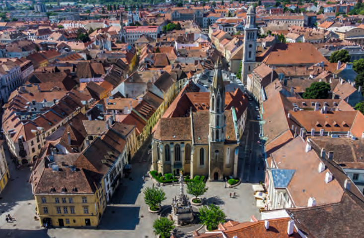
Sopron belvárosa, 2022