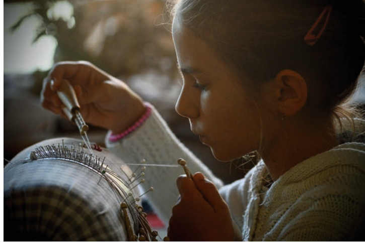
A csipkeverés nagy koncentrációt igényel

Az évfolyamokat osztályfőnökök helyett osztályközösség-vezetők fogják össze, partnerként kezelve a diákokat. A tanárok közül a legtöbben keresztények. Elmondása szerint nem volt nehéz hitüket gyakorló pedagógusokat találni, olyanokat annál inkább, akik számára a néphagyományok is fontosak. Többen az ország távoli pontjáról járnak ide tanítani, van, aki Mezőtúrról, más Nyíregyházáról.