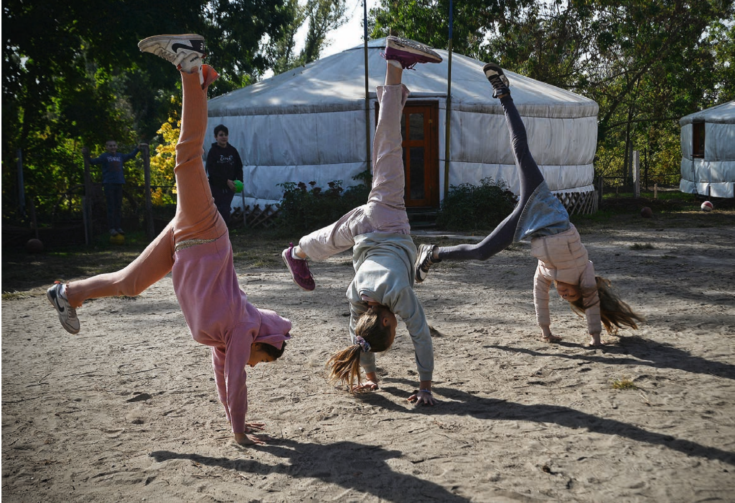
A diákok a szünetekben nem a telefonjukba merülnek, hanem egymással játszanak