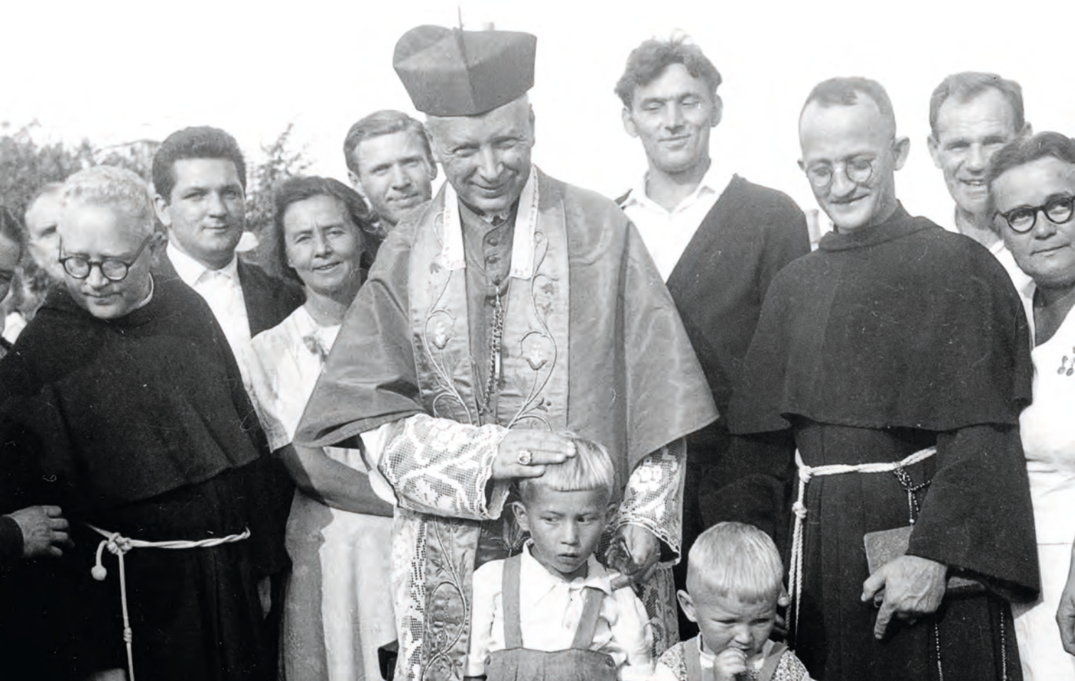
Stefan Wyszyński prímás látogatása a Varsóhoz közeli Niepokalanów ferences kolostornál az 1950-es években