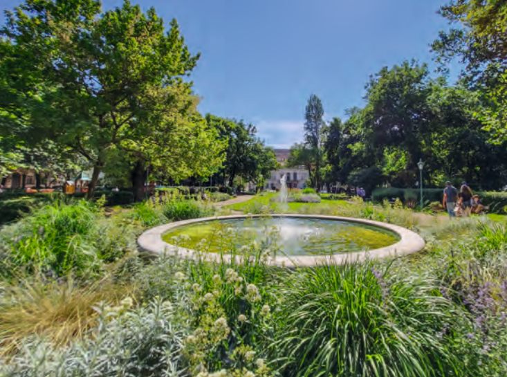
A kert napjainkban. Szemben a palota épülete, amely 1957-től ad otthont a Petőfi Irodalmi Múzeumnak

[...] Tavasszal egész rhododendron-erdő vöröslík itt és azaleák és kaméliák pirosanak, fehérленek. Majd neki kéklenek az orgonák, s virulásnak indul a dudafürt, a zanót s végül az akác.” Nem csupán a növények tették különlegessé a kertet, itt adták át Pest harmadik – ekkor még füves – tenispályáját.