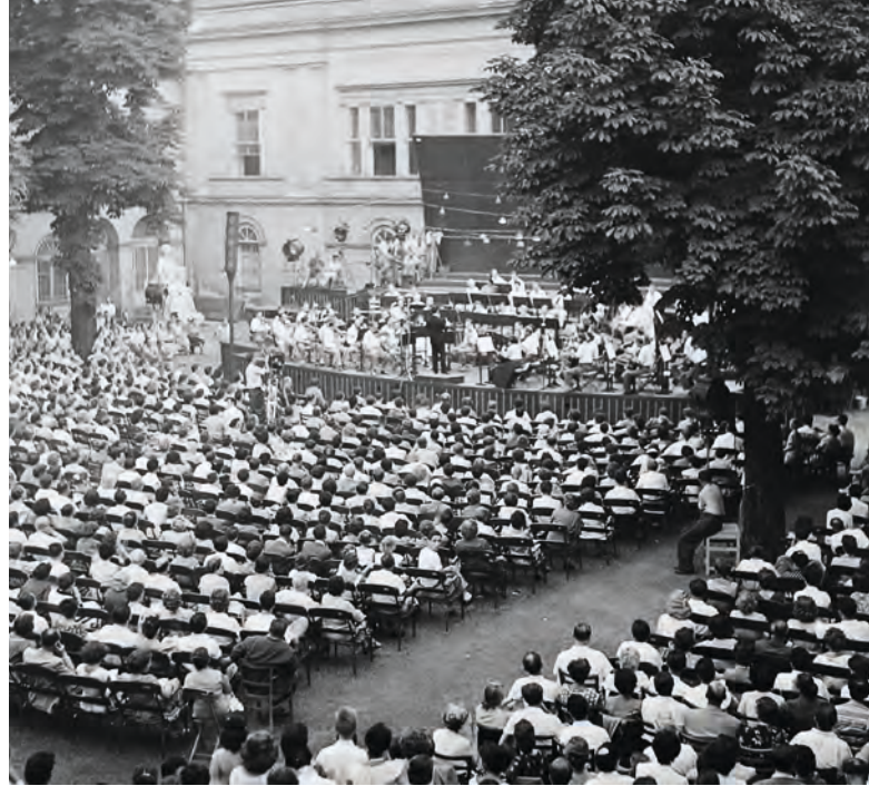
Koncert a kertben 1958-ban