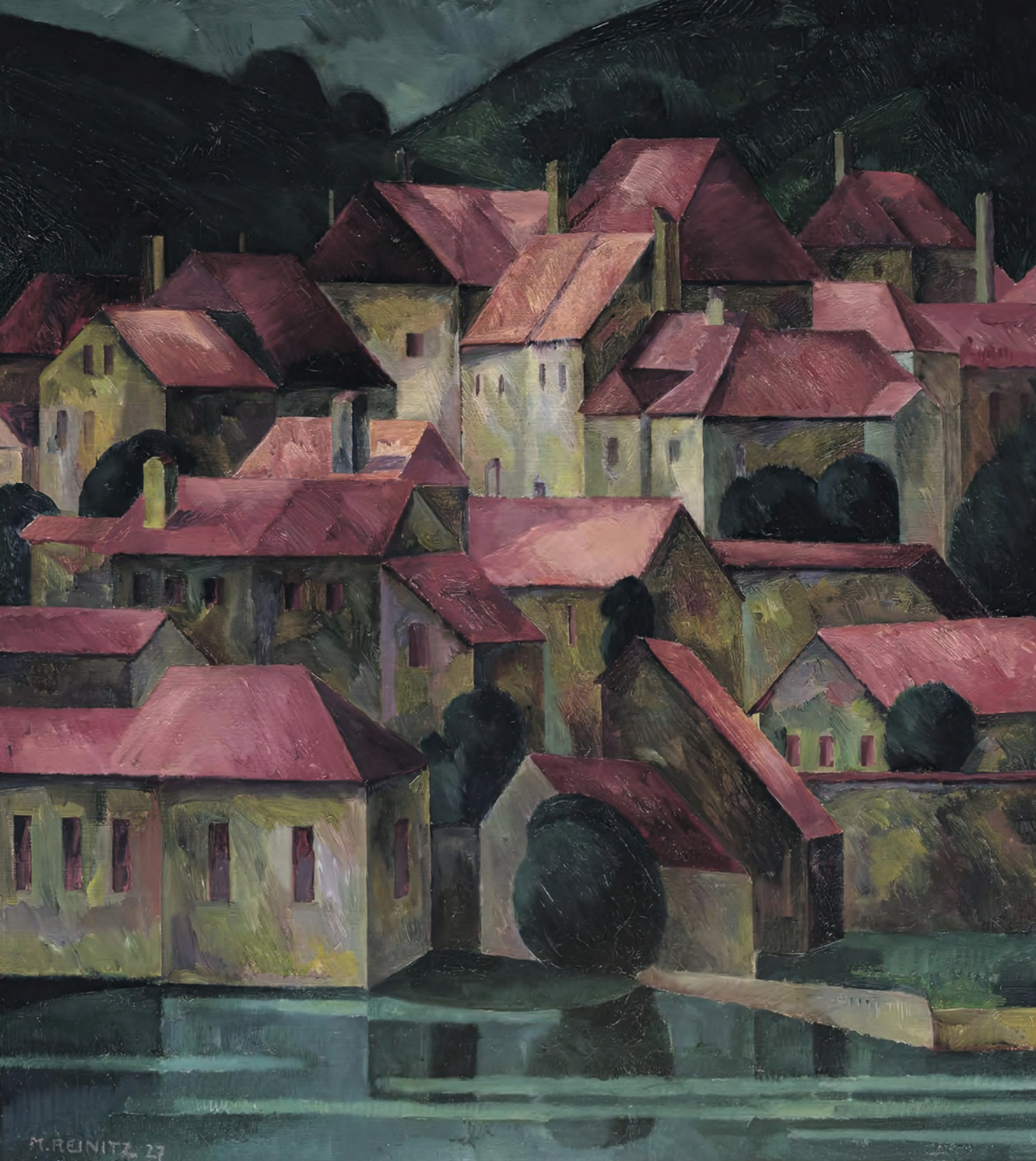
Maximilian Reinitz (1872–1935): Vörös háztetők. Olaj, lenvászon, 61 × 54,5 cm, 1927. A Belvedere (Bécs, Ausztria) gyűjteményéből