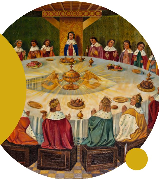
A Szent Grál megjelenése a kerekasztal felett. Karl Rezabeck német fegyenc festménye 1946-ból. Szent Onenne-templom, Tréhorenteuc, Franciaország