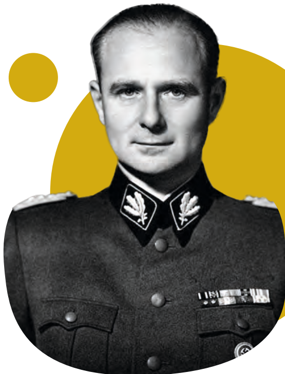
Otto Rahn (1904–1939) katonaportréja