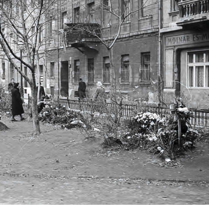
Károlyi-kert, jobbra a Magyar utca házai. Az 1956-os forradalom alatt elesettek ideiglenes sírjai