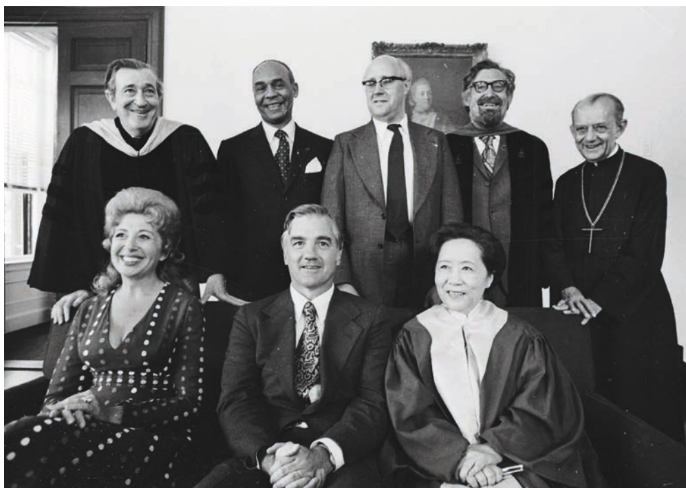
Hélder Câmara (jobb oldal, fent) díszdoktori avatása után készült csoportkép. Cambridge, 1974

reménytelen helyzetét. Szociális heteket szervezett, amelyeken világiak, papok, szerzetesek, püspökök vitatták meg az ország helyzetét és az egyház feladatait. Korábbi, tartózkodóan konzervatív nézeteivel 1937-ben véglegesen szakított, hivatali és papi munkája mellett egyházi lapok szerkesztőjeként hirdette a hit és a társadalmi igazságosság ügyének összekapcsolását. Már ismert közéleti személyiségként 1952-ben Rio de Janeiro segédpüspökévé nevezték ki, jelentős szerepet vállalt a Brazil Katolikus Püspöki Konferencia létrejöttében, amelynek 1964-ig főtitkára volt. Ő volt az 1955-ben, Rióban megrendezett harminchatodik Nemzetközi Eucharisztikus Kongresszus fő szervezője, amelyen számos