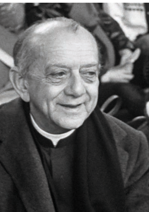
Hélder Câmara (Párizs, 1974)