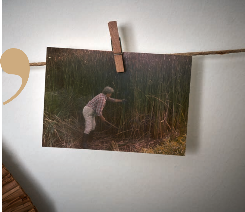
A gyékényarattás pillanatairól fotók mesélnék