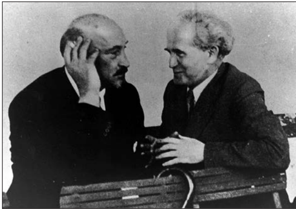
Haim Weizmann és Ben Gurion 1945-ben, Svájcban

a blitzet Londonban – mondta a bizottság előtt tett tanúvallomásában Ben Gurion –, láttam, hogy az angolok számára a hazájuk és a szabadságuk még az életüknél is drágább. Miért feltételezik, hogy mi nem ilyenek vagyunk?”