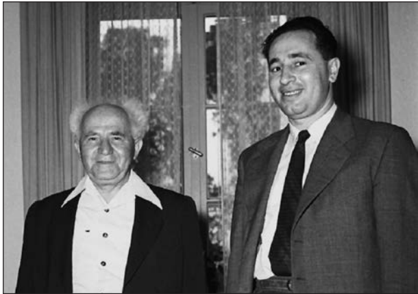
Simon Peresz és Ben Gurion

Nekem két nadrágom volt: egy khaki színű munkaruhám hétköznapiakra és egy flanelnadrágom szombatra. A később történetek 3 fényében érdekes, hogy 1953-ban Lavon szerezte nekem a főigazgatói állást a védelmi minisztériumban. Mint Ben Gurion kormányának tárca nélküli minisztere, Lavon időnként helyettesítette Ben Guriont a védelmi tárcánál. (Ben Gurion a miniszterelnökség mellett védelmi miniszter is volt.) Ekkortájt még csak megbízott főigazgató voltam. Lavon azt mondta, állandó kinevezést akar szerezni nekem.