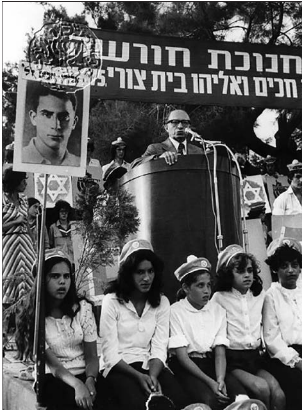
Begin Lehi-emléknapon beszél

Meir Feinstein tárgyalásán is. Az ő megnyilvánulása egyike volt a legélesebb, legfrappánsabb támadásnak: „Önök az akasztófák uralmán alapuló rezsimet akarnak bevezetni ebben az országban. Gonoszsággal párosuló butaságukban, azt képzelik, sikerül megtörni népünk szellemét, ha az egész országból egy akasztófából álló erdőt csinálnak. Tévednek. Meg fogják tanulni, hogy az a szellem, melyet meg akarnak törni, acélból készült, és a szeretet, valamint a gyűlölet tüzeiben edződött meg! A hazaföld és a szabadság szeretete és az elnyomók iránti gyűlölet táplálja ezt a tüzet. Izzó acél ez. Sosem fogják eltörni, saját kezüket pusztítják el! Milyen vakok is maguk, brit tirannusok, még mindig nem jöttek rá, hogy ez a harc példátlan az emberi történelemben? Komolyan azt hiszik, félünk a haláltól, mi, akik évek óta azt halljuk, hogyan hajtják vágóhídra testvéreinket, szüleinket, népünk legjavát? Mi, akik minden egyes nap azt kérdezzük magunktól, miért vagyunk jobbak, mint testvéreink milliói? Miben rejlik az erényünk, hiszen ott lehetnénk velük a félelem napjaiban és a halált megelőző pillanatokban. Ezekre a szakadatlanul ismétlődő