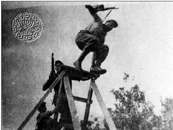
LEHI tagok kiképzésen

csoporthoz és újra megkíséreljék elérni Erec Izraelt. Világossá vált, hogy a zsidók nem adják fel, sőt „széles körű inváziót” terveznek az illegális bevándorlók számára. Ekkora már a Hagana, mely jóval gazdagabb volt az Irgunnál, hiszen a Jewish Agency forrásaival rendelkezett, is bekapcsolódott az emigráció szervezésébe és lebonyolításába.