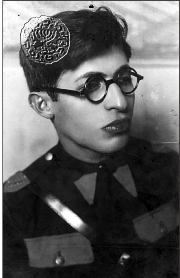
Begin az 1930-as években, Betár uniformisban, Varsóban

Édes Istenem, milyen naivak voltak! Éppen a XX. század szellemisége és technikai, tudományos fejlettsége tette lehetővé, hogy realitás legyen egy egész nép kiirtása, továbbá a zsidó nép volt az a nép, melyért a világ egy lépést sem tett volna! He- lyesebben fogalmazva, egy lépést sem tett évszázadokon át! A felejtés képességének angyala áldott teremtés. Szárnyának érintése begyógyítja legfá- jóbb sebeinket. A felejtés képessége éppoly fontos, mint az emlékezés képessége. Ezért nem szabad dühösnek vagy éppen meglepettnek lennünk, hogy alig néhány évvel az emberi történelemben példát- lan népiirtás után, sokan vannak köztünk, akik szin- te el is felejtették az egészet. De ki kell mondanom, nem engedhetjük át magunkat a felejtés kellemes