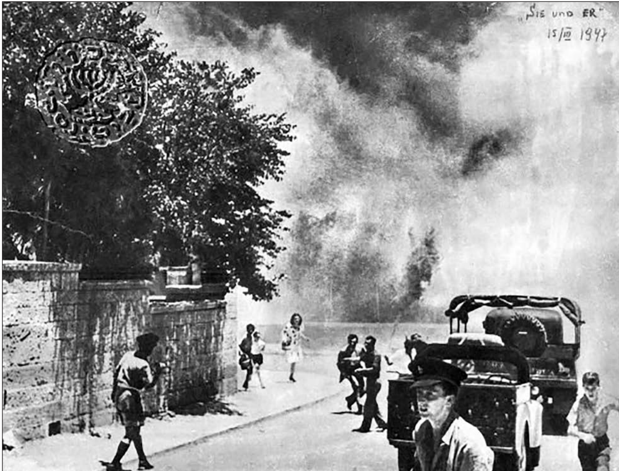
King David lángokban – Jabotinsky Institute

Majd öt év múlva jöhet a függetlenség, természetesen a hagyományos brit és arab barátságra alapozva, melyet egy szerződés erősít meg Ófelsége kormánya, valamint az új „független” kormány közt. Természetesen nem feledkeztek meg a zsidókról sem. Britannia, mint tudjuk, mindig eleget tesz vállalt kötelezettségeinek. Kulturális autonómia, egyenlő jogok és szigorúan a népesség arányainak megfelelően (körülbelül egyharmados) részvétel a kormányban. Arab „kormányzás” brit „tanácsadók” felügyelete alatt.