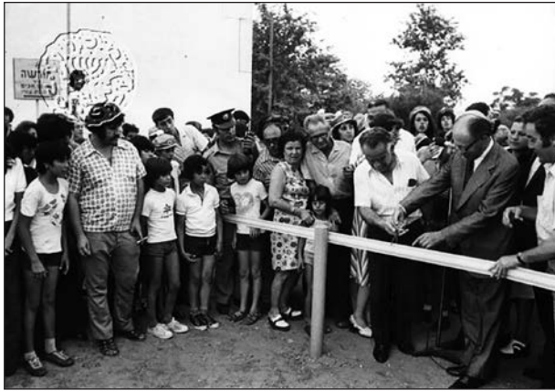
Begin és Jichak Samir Lehi-parkot avatnak 1975-ben

lett volna olyan zsidó erő és szellem, mely kirobantja és sikerre viszi a forradalmunkat. A brit „tervet” végrehajtották volna, vagyis ma nem lenne zsidó államunk, lenne viszont gettónk, melyet ellenségeink megpróbálnák temetővé átalakítani. A felkelés eredménye, számos ok miatt, nem csak a felkelőktől függött. Nem hozott teljes eredményt: az állam csak országunk egy részén jött létre, de megakadályozta a teljes pusztulást.