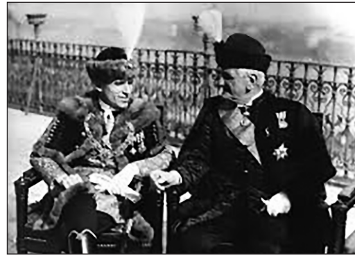
Imrédy Béla és Kánya Kálmán a Miniszterelnöki Palota teraszán 1938. május

A magyarországi mozgalom tevékenységét egy „hangulati” jelenség is megnehezítette: a cionistákkal szemben fokozódott a belügyi szervek bizalmatlansága. A rendőrség már korán felfigyelt az úgynevezett hachsarak tevékenységére: ezek olyan cionista elő/felkészítő központok voltak, ahol az ifjúságot palesztinai fizikai munkára képezték ki. Így, ha csekély mértékben is, de a munkanélküliségen is segíteni tudtak. A hatóságok azonban a bolszevizmus „melegágyaként”, az „ateista-kommunista veszély” egyik fő hazai ágenseként tartották számon őket s e telepek kollektivistikus életformája csak megerősítette az előítéleteket. Az 1930-as évek második felében több hachsara-botrány pattant ki, melyek a külföldi cionista vezetők szemében legalább annyira számítottak, mint a gyűjtési problémák. Ezek a botránnyok főleg a marxista-cionista Hasomer Hacaírt, valamint több kisebb, főként baloldali csoportot (például Dror, Stam Chaluc stb.) érintettek, de egy idő után az egész cionista mozgalom működését veszélyeztették: a szélsőjobboldali sajtó óriási kampányától övezve kellett a hiva-