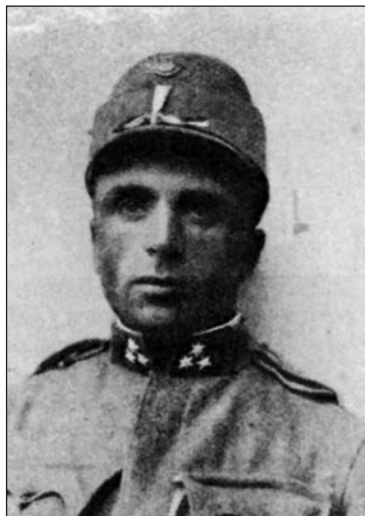
Avigdor Hameiri frontról hazaküldött képei

Megérkezünk a vasútállomásra. Visszaadom őrnöknek a töltényeit. Kezet szorítunk. A tenyere nedves.