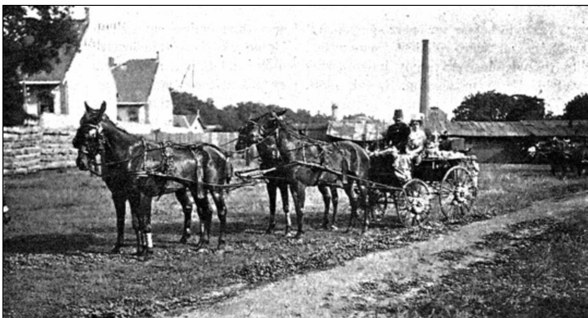
2. kép Virágokkal díszített kocsi az 1907-es korzón. II. 17

Meg kell jegyezni azonban, hogy a fényképész műtermi munkáiból számos alkotás fennmaradt és a Déri Múzeum archívumában mai napig megtalálható, az eseményeken készült képekből azonban – az eddigi kutatási adatok szerint – nem maradt fenn a Debreczeni Képes Kalendáriumban közzétett képeken túl egy sem.