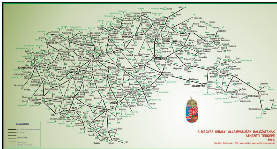
2. kép Magyarország 1940-41. vasútjainak Erdélyi része 4

Ahol nem ment vonat, Mávautóbuszokkal utazhattak tovább, mindez azonban a sok átszállás miatt kényelmetlen volt. Ennek kiváltására mindenféleképpen egy vasútvonalat kellett építeni, amit Szeretfalva és Déda között el is készült. Horthy Miklós kormányzó 1942. december 5-én ünnepélyes keretek között át is adta a vasútvonalat így össze tudták kötni az anyaországot Székelyfölddel.