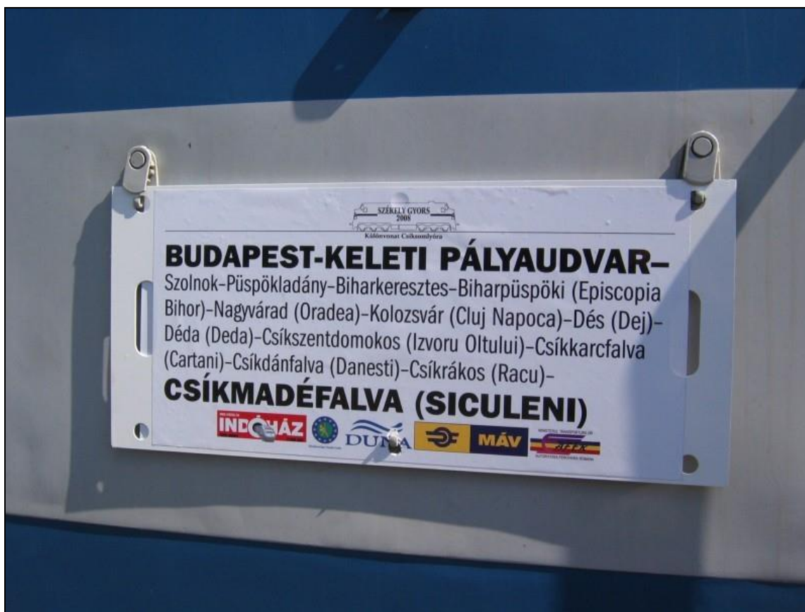
6. kép A „Székely gyors” első napra rendelt útvonala 11

A csíksomlyói búcsúra illetve az őrházhoz és a Pfaff Ferenc által épített gyimesbükki vasútállomáshoz először 2008 pünkösdjén indították el a Székely gyors zarándokvonatát. A vasútbarátok és zarándokok a Keleti pályaudvaron szállhattak fel a vonatra, amely Szolnok, Püspökladány és Biharkeresztes érintésével érkezett meg Erdélybe. Az első nap utazással telt és "nemzeti színű lobogókkal, énekekkel, integetéssel köszöntötték a helybeliek az elhaladó vonatot, Kolozsváron pedig közösen énekelték el a magyar és székely himnuszt, ami sokak szemébe csalt könnyeket." 10 A mozdony a nap végére zarándokutasait eljuttatta Felcsíki szálláshelyeikre, pontosabban Csíkkarcfalvára, Csíkdánfalvára, Csíkmadarásra, Csíkrákosra és Madéfalvára.