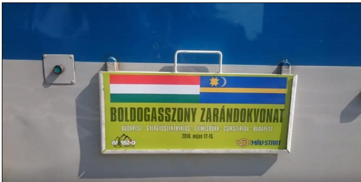
10. kép Boldogasszony zarándokvonat táblája 2016-ban 19