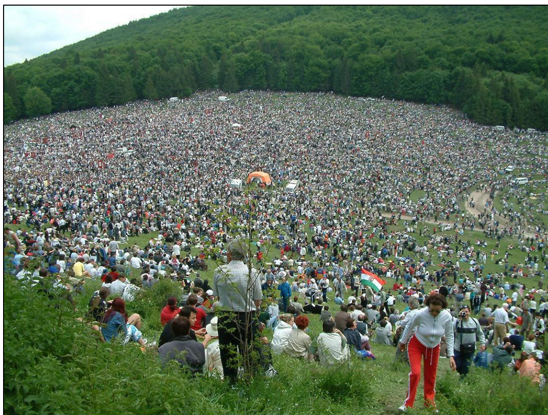
1. kép A csíksomlyói zarándokok tömege 2004-ben 1

Minden pünkösdkor immár 9 éve elindul Magyarországról egy zarándokvonat a csíksomlyói búcsúra. A Székely gyors nevű vonatot 2008-ban azzal a céllal hozták létre, hogy a vonatozás szerelmesei vasúton is eljuthassanak az erdélyi szent zarándokhelyre. Mindenholnan felkerekednek, és részt vesznek a búcsún úgy a hívők – főleg a katolikusok – mint azok, akik az ezeréves határra és a Rákóczi-várra kíváncsiak, de eljönnek azok a vasút barátok és vasúttörténészek is, akik meg akarják nézni a Gyimesbükkön lévő vasúti őrházat.