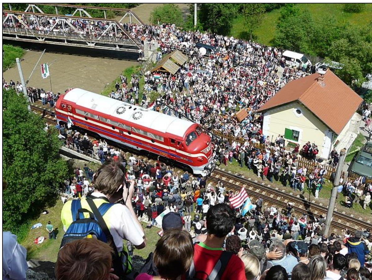
5. kép A Székely gyors NOHAB mozdony a 30.sz. őrház előtt 9