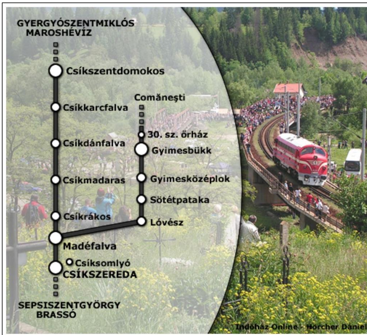
9. kép A Székely gyors térképének Csíkszereda-Gyimesbükki részlete 20