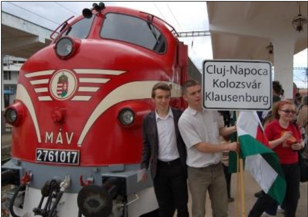
11. kép A Székely gyors Kolozsváron 21

történelmével együtt. A végállomás viszont mindvégig Csíksomlyó, Madéfalva, és Gyimesbük maradt. Mind a mai napig sokan felkeresik a csíksomlyói búcsút, a 30-as számú vasúti őrházat, és a Rákóczi-várat is. Ezeken az utakon azonban nem csak a zarándokok vesznek részt hanem azok is, akik szívből szeretik hazájukat vagy csak szeretnék meglátogatni határon túl élő rokonaikat, vagy esetleg vasútbarátként csatlakozni az utazóközönséghez, ezzel is kedlükre ölelve az ottani magyarságot, amiért őrzik közös hagyományainkat, hitünket és a történelmi szent emlékeket. Higgyünk abban, hogy ez a vonat még sokáig fogja gyimesbükki és Csíksomlyói állomásukhoz vinni a magyarságot és a zarándokokat.