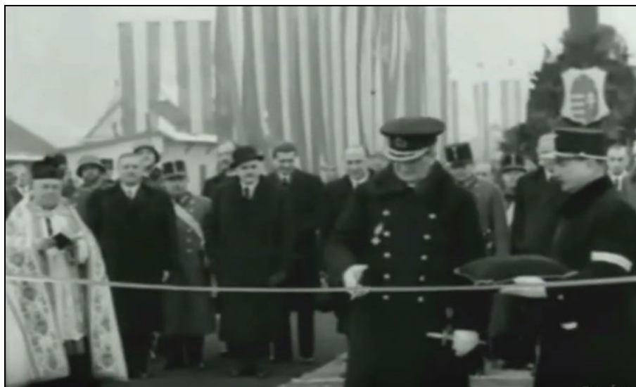
3. kép Horthy Miklós felavatja a Szeretfalva-Déda vasútvonalat, háta mögött a Turán mozdony 5

Ahol nem ment vonat, Mávautóbuszokkal utazhattak tovább, mindez azonban a sok átszállás miatt kényelmetlen volt. Ennek kiváltására mindenféleképpen egy vasútvonalat kellett építeni, amit Szeretfalva és Déda között el is készült. Horthy Miklós kormányzó 1942. december 5-én ünnepélyes keretek között át is adta a vasútvonalat így össze tudták kötni az anyaországot Székelyfölddel.