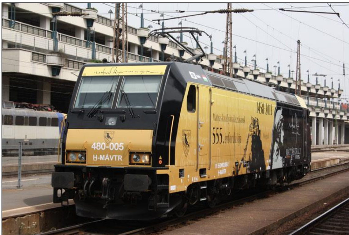
8. kép A Hunyadi Mátyás emlékére feldíszített mozdony 17

A „Gábor Áron” Traxx mozdony 2014-ben vitte el utasait Székelyföldre, míg 2015-ben a Csíksomlyó Expressz és Székely gyors össznemzeti zarándokvonatot, amely Szombat-helytől indulva Budapesten és Debrecenen keresztül érkezett Erdélybe a Rákóczi Ferencet megidéző Traxx lokomotív húzta. A mozdonyok matricázására és feldíszítésére 2013-tól 2015-ig grafikusok és a vasutat kedvelő baráti körök is pályázhattak, amelyeket komoly zsűribizottság értékelt. 18 A zarándokvonat díszítésére 2016-ban nem hirdettek pályázatot viszont akkor sem maradt díszítés nélkül a vonat, ekkor ugyanis a Szent Márton matricás Traxx mozdony húzta megszokott útvonalán Debrecent elkerülve Püspökladány-Biharkeresztes-Nagyvárad útvonalon a szerelvényt.