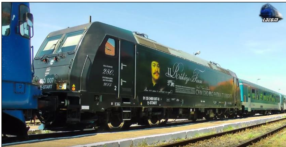
1. kép A 2017-es Székely gyors-Csíksomlyó expressz 7

A gyors közlekedés érdekében később motorvonatokat is rendeltek, amelyek 1943. július 1-én álltak üzembe. Az egy motor- és két személykocsiból álló, 502/503 számú gyorsmotorvonatok hétfőként, csütörtökönként és szombatonként a Nyugati pályaudvarról 7:02-kor indultak és 19:17-kor érkeztek meg Sepsiszentgyörgyre. Visszafelé szintén reggeltől estig közlekedtek. 6 A gyorsmotorvonatok a keleti front közeledése miatt viszont csak 1944 nyaráig közlekedhettek. Erdély és Partium újból Romániához került, ismét román vonatok közlekedtek, erdély teljes területén, és így újból beszűkültek a magyar hagyományápolás keretei. Mindezek következtében Csíksomlyói búcsút is csak 1990-től tarthatták meg újból.