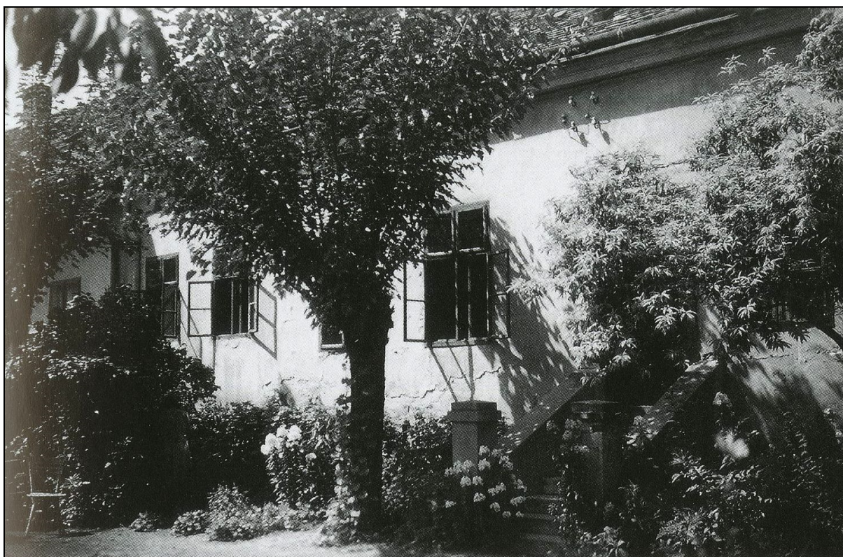
7. kép A Füvészkert utcai lakás 22

Ekkor már a Füvészkert utca 18. számú – akkor Baltazár Dezső utca –, épület udvaros házrészében laktak, amely előzőleg a Református Kollégium diákkórháza volt. „A Füvészkert utcai házban apám paradicsomkertet csinált, áradt az illat az ágyásainkból. Volt egy öreg körtefánk, volt egy eperfánk, rengeteg-rengeteg eperrel, barackfánk is volt, sok gyümölcs. Apám ültetett két csemeteplatánt, az egyiket Agancsos fájának, a másikat nekem. Megöntözte és megáldotta őket, az ároni áldással.” 21