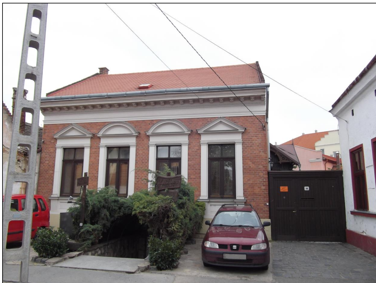
3. kép A Domb utca 16. számú ingatlan napjainkban 8

Debrecen Megyei Jogú Város építészeti archívumában – továbbiakban Mikrofilmtár –, ebből az időszakból olyan tervrajz, amely az adott lakás beazonosítására vonatkozóan bizonyító erővel bírt volna, nem volt fellelhető. A kutatómunkát nehezítette továbbá az a tény, hogy a korábbi térképeken – de még az 1978-ban készült légi felvételen ugyancsak láthatóan, az adott telek nagysága sokkal nagyobb volt mint napjainkban, illetve több épület is állt a portán. A napjainkban már nem létező épületek bontási dokumentációi viszont szerencsénkre a Mikrofilmtárban – bár tervrajzok nélkül –, de megtalálhatók, amelyekből azonban csak annyit