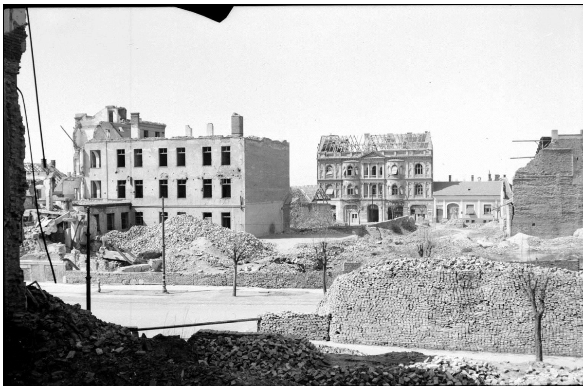
8. kép A lebombázott Hunyadi utca 24. szám és környéke 23

tok 1944. március 19-én bevonultak Magyarország területére, az iskolákban a tanítást befejezték. Szabó Magda ekkor visszajött Debrecenbe, az ostromot itt érte meg a Kollégium pincéjében.