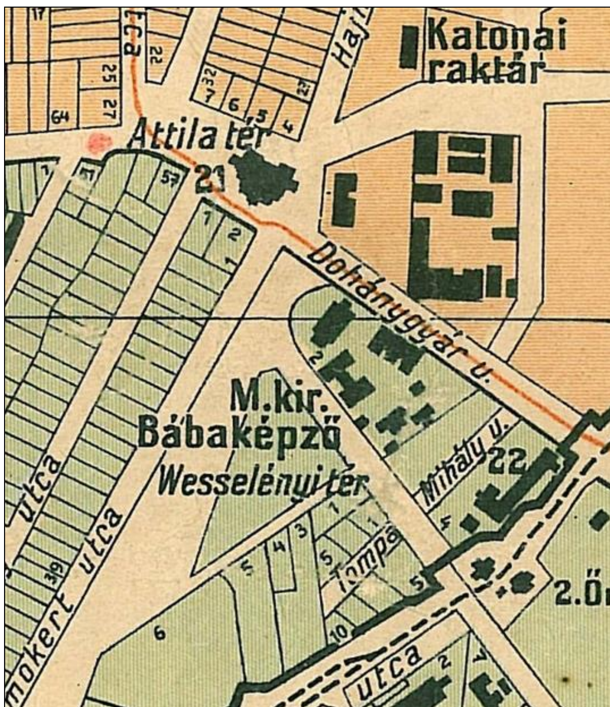
1. kép A Bábaképzde Debrecen 1925 2

„Arrafelé, ahol az utca végződött, feküdt valahol a rejtelmek háza is, túl-túl a téren, kicsit jobbra, a dohánygyár környékén, az épület, amelyet megmutattak egyszer, s amiről azt