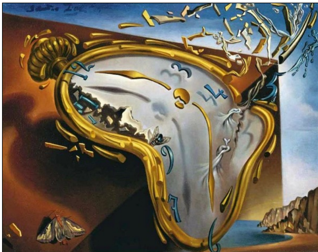
Salvador Dalí: Elfolyó idő

Ezek a percek már órákká dagadnak naptáram falai közt évekbe fulladnan tapodom az időt. Rendet kéne tenni már e sok kusza bejegyzés között Lassan nincs több üres oldal szállnak az évek s a hónapok Nehéz éjjelekre jönnek mindújabb nappalok Forgok velük én s így folyik velem a lét minden óra peremén Szörnyű Idő, hát már ki sem ismerlek úgy elfolyik mellettem minden annyira sebesen