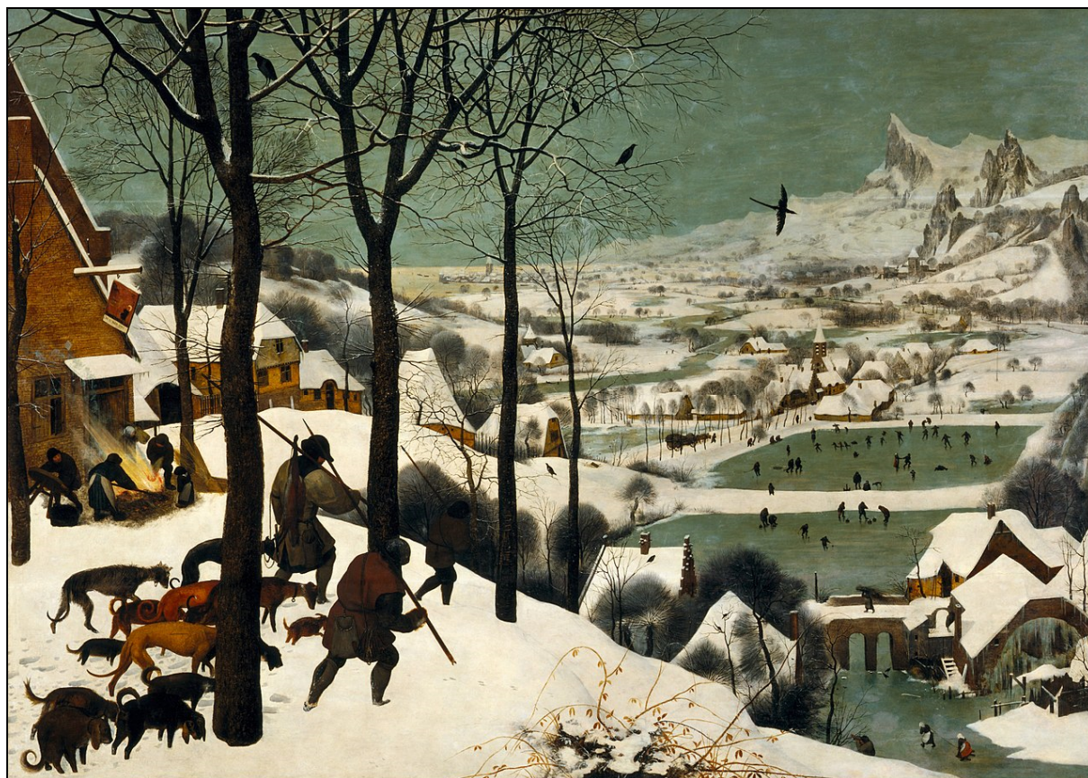
Pieter Bruegel: Vadászok a hóban (Jagers in de Sneeuw)

farkasfogak tátongnak, s fagyos szellő oldalaz, szarvasbőrbe burkolt tag szakad, s ömlik a hó, s hóba a vér vörösen. 3