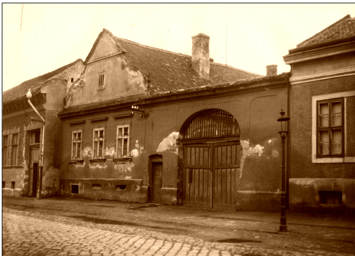
12. kép A Bajcsy-Zsilinszky utca 42. számú copf stílusú módos cívisház. Az utolsó XVIII. századi íves oromzatú épület a belvárosban. Vigyáznunk kell rá! 13

Megörököltünk jónéhány cívisházat a XVIII-XIX. század időszakából, de még a XX. század első felében is létrejöhettek azt a bizonyos „ cíviskaraktert ” magukon viselő ingatlanok. A több évszázadon átívelő kortörténetnek köszönhetően viszont az épületek több periódus stílusjegyeit is hordozhatják. Ilyen például a XVII-XVIII., valamint a XIX. század első felére átnyúló puritán copf-barokk, a XIX. század első felére keltezhető klasszicista stílus – mind a mai napig látunk rá példákat elég, ha csak a Nagytemplomra gondolunk –, tovább haladva az időben a XIX. század második felében kivirágzó romantikus, historizáló-eklektikus, klasszici-