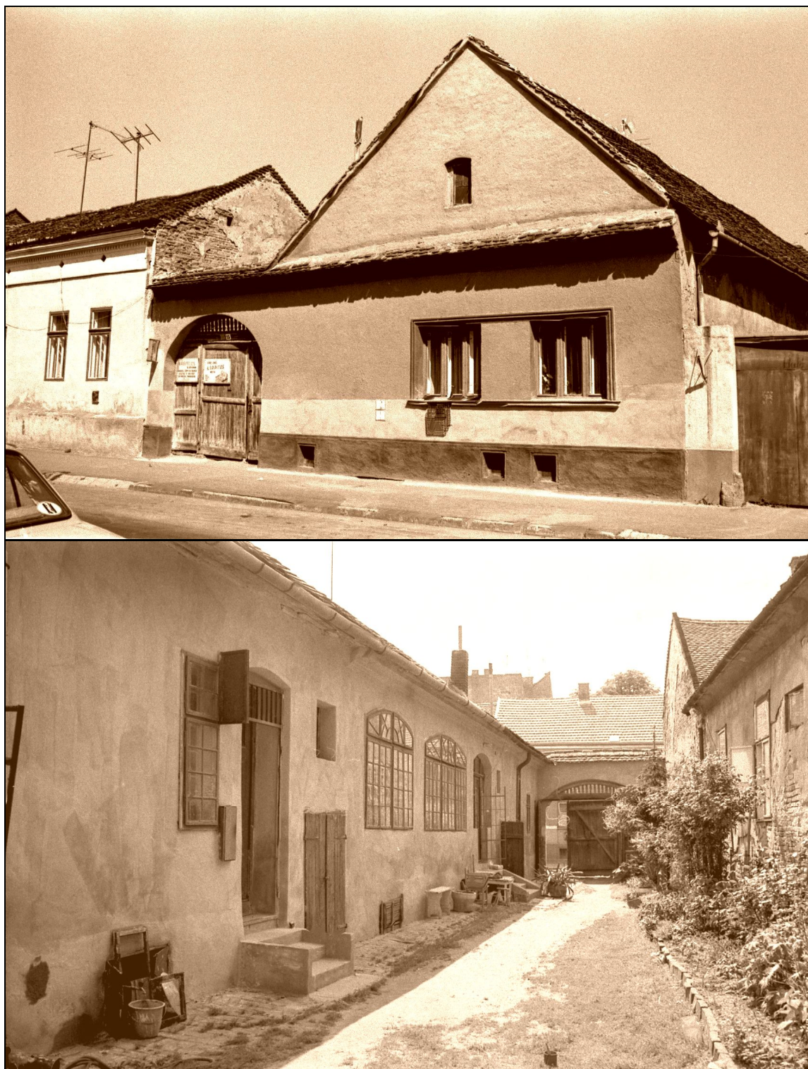
38-39. kép Archaikus fésűfogas telekelrendezésű, jómódú úgynevezett „basacívis-ház” az 1760-as évek előtti időkből. Bajcsy-Zsilinszky Endre utca 15. szám 35