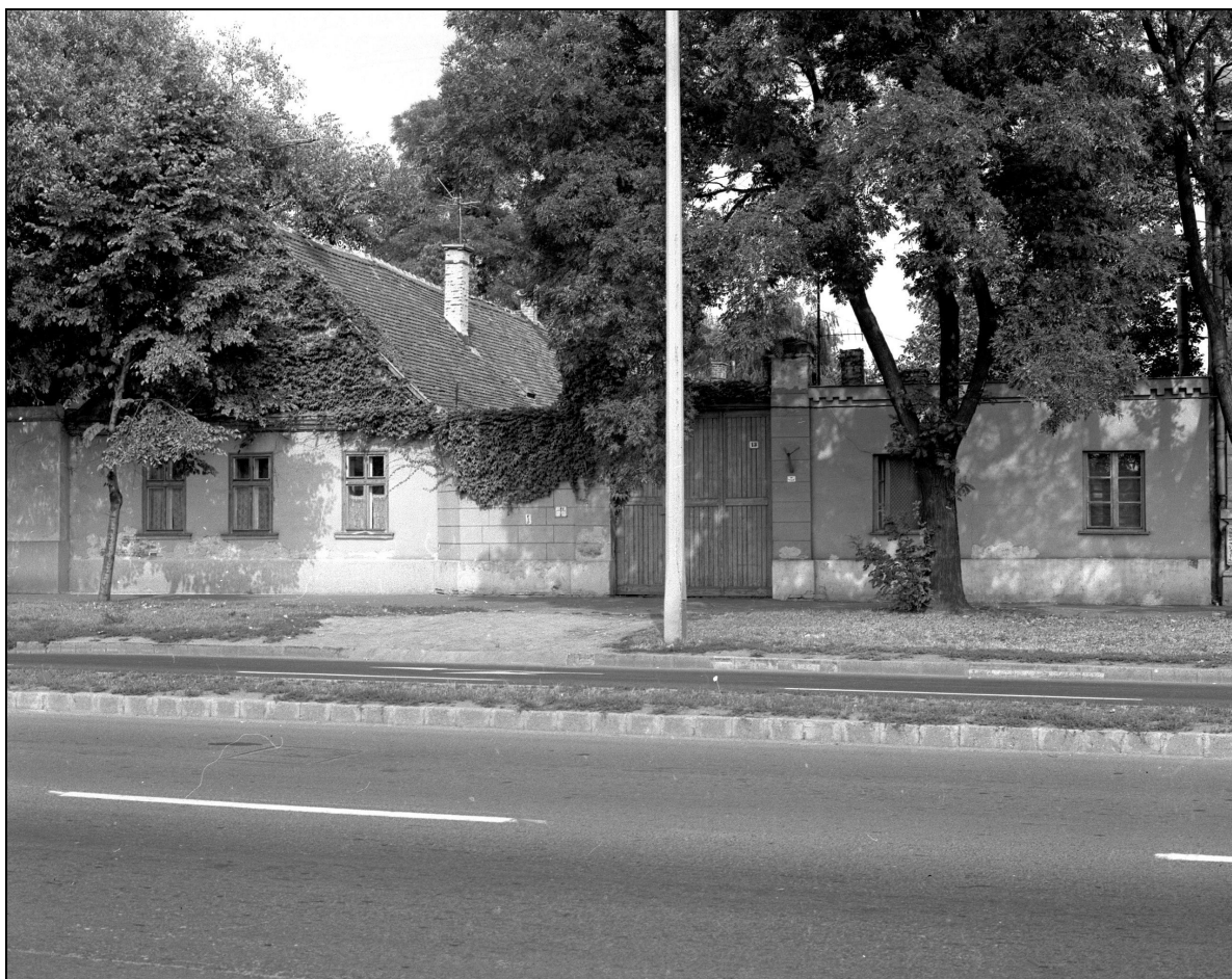
17. kép A Rákóczi utca 13. számú archaikus fésűfogas telekelrendezésű cívisház az 1970-es években, már sima, egyenes záródású oromzattal 20

A következő cíviskarakter réteg képviselői: 2. Zártsorú, puritán kivitelű cívisházak: Védettségüket tekintve már elfogadottabbak, jellemzően utcával párhuzamos állásúak, puritánabb, letisztultabb jellegű épületállományról beszélhetünk, amellyel megváltoztatták a korábbi elterjedt térhasználatot, telekstruktúrát és formát. Zömében a XIX. század első felétől terjedtek el. Jó példa erre a Szent Anna u. 29. számú ingatlan, amely szintén valamikor a XVIII. század végén, vagy a XIX. század elején épülhetett. Külön érdekessége, hogy ez nem egy, hanem két cívisház, amelyet aztán összetoldottak. Jól látható mind a mai napig az egykori kapuzat helye, amit aztán beépítettek.