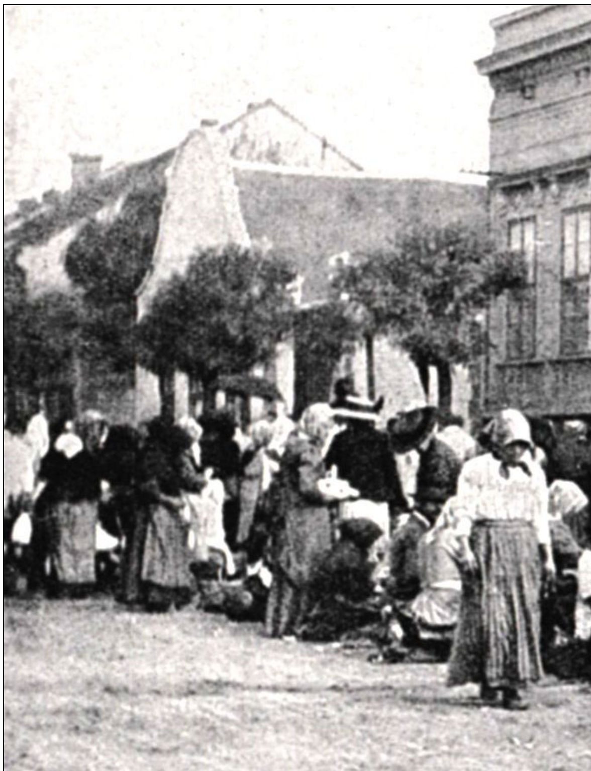
16. kép A Rákóczi utca 13. számú archaikus fésűfogas telekelrendezésű épület 1920-ban, még íves barokkos oromzattal 19