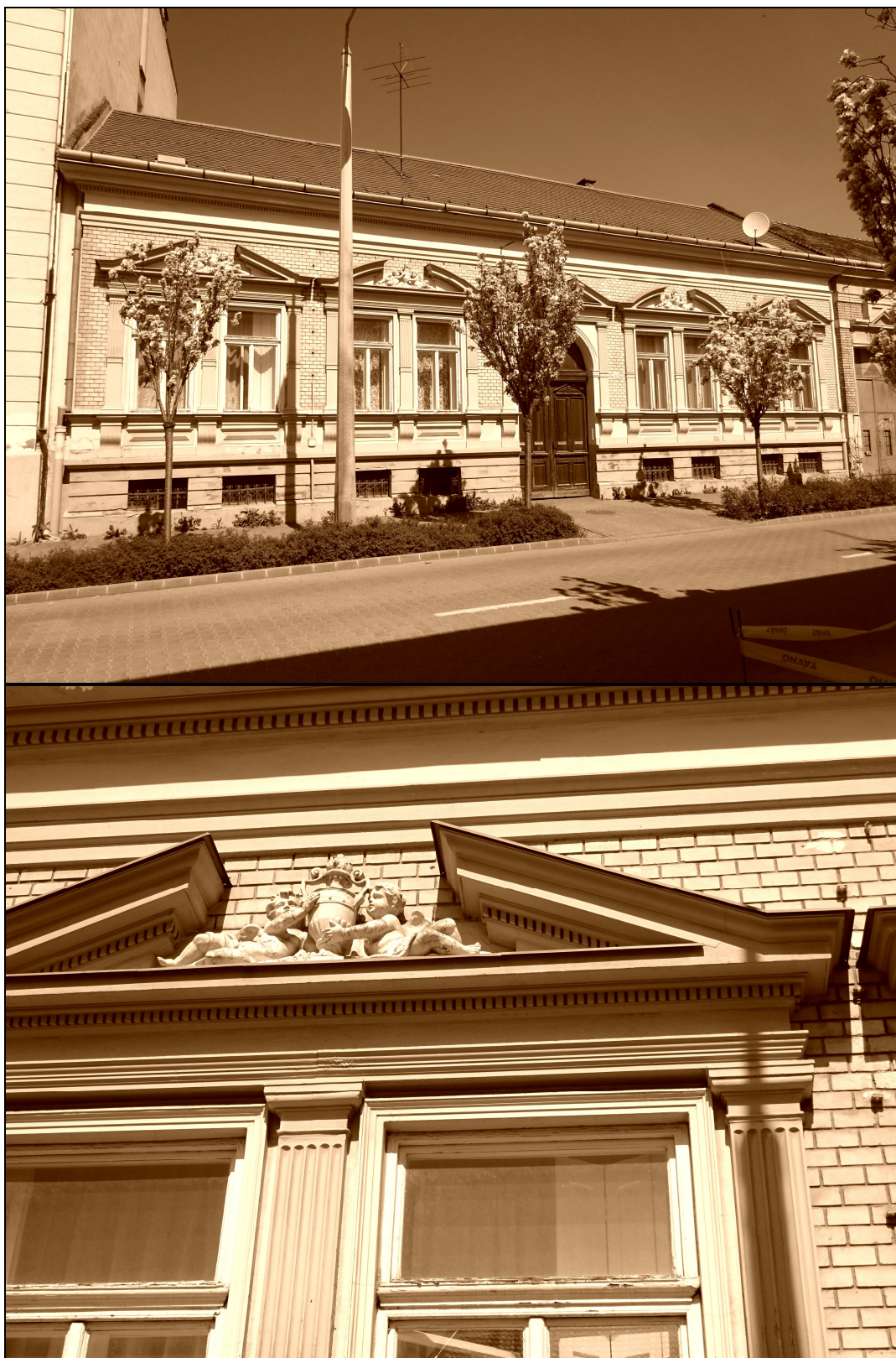
19-20. kép A Bajcsy-Zsilinszky Endre utca 33. számú díszes zárt sorú cívisház 22