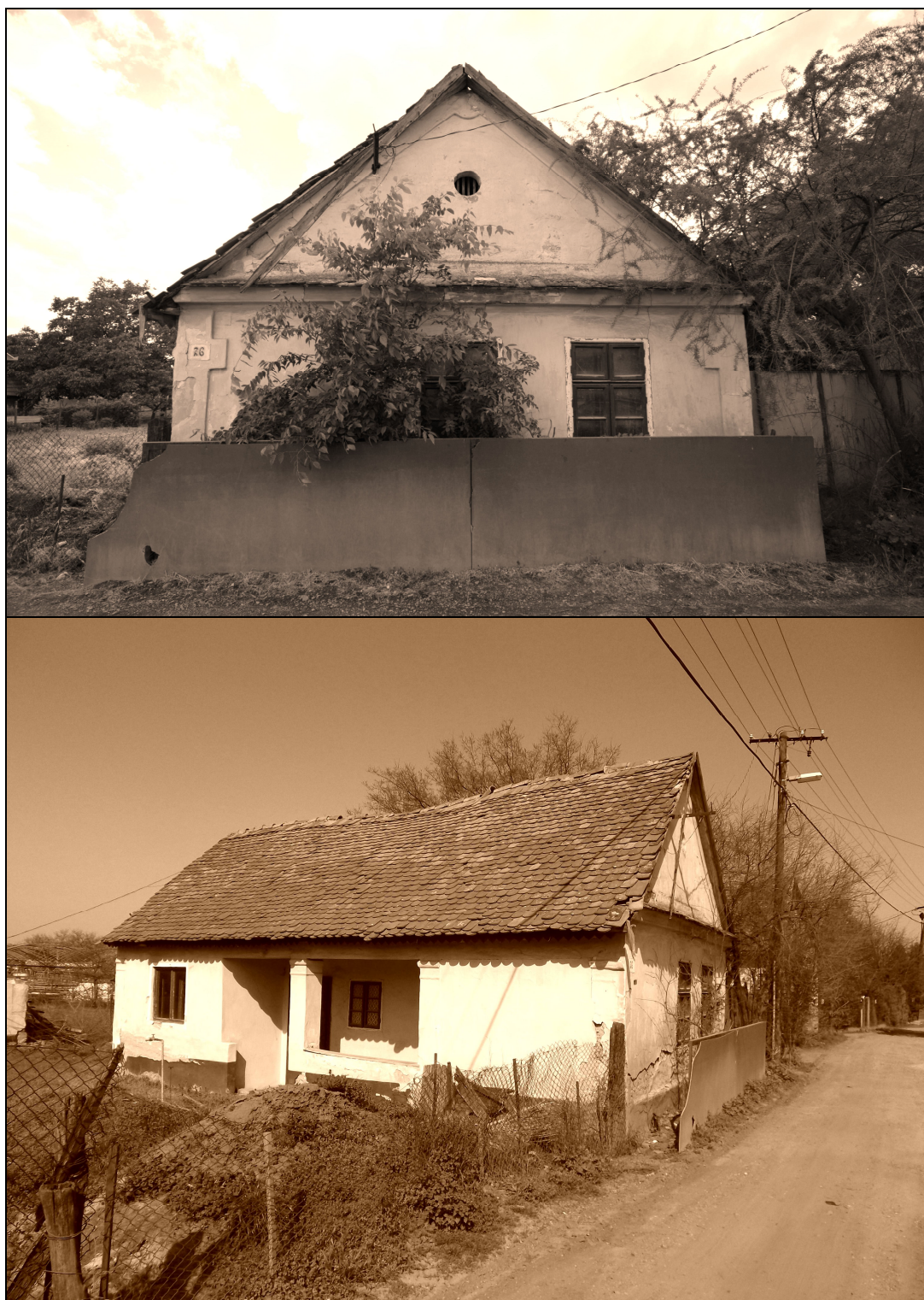
30-31. kép Egykori présház, a Köntöskertben. Bezerédj utca 26. szám 28