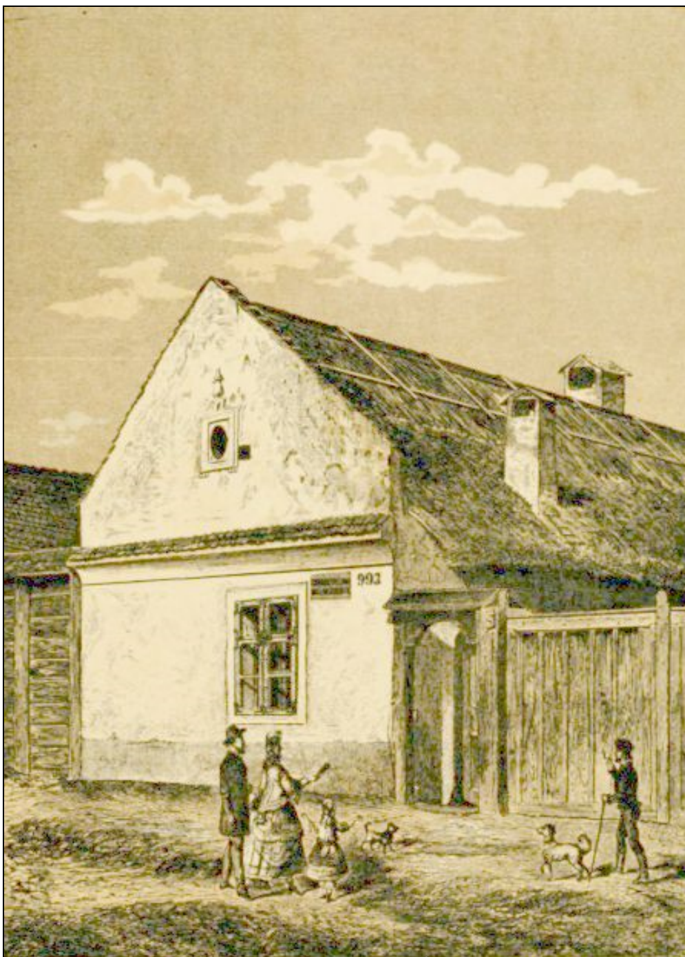
8. kép Csokonai Vitéz Mihály egykori lakhelye. Napjainkban Darabos utca 19. szám 10

felmérések azt mutatják, hogy az 1882-1912. között kialakított zárt sorú utcafront mögött megmaradt a fésűfogas ház pincéje és hátsó traktusának külső falazata! A Széchenyi u. 6. szám alatti Diószegi-ház az 1600-as végén már biztosan állt. Utcai kerítését téglából rakták,