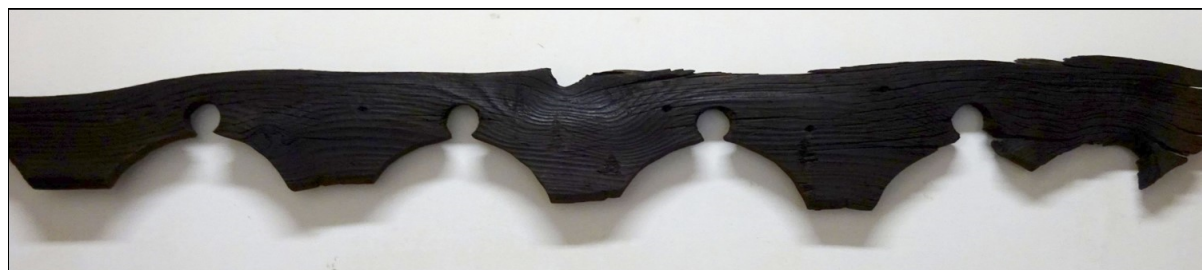
40. kép A Borz utca 19. számú ingatlan kerítésének záró díszsormintája 37

A cívisházak értékeit nem csupán dokumentációval lehet megőrizni, hanem a fragmentumok gyűjtésével, mentésével is. A Baross utca 9. számú elbontott épület fa esővetőit – hiszen csatornák korábban nem voltak ezeken a házakon – sikerült megmenteni, a Borz utca 19. szám alól pedig be tudtuk gyűjteni egy fakerítés ívdíszsorát is. Sőt, a Böszörményi út 16. számnál az egész egykori faoromzatot sikerült leemelni. A ház külön érdekessége volt ez, hiszen Debrecenben talán az utolsó olyan épület lehetett, ahol a népi építészetből ismert faoromzat megélte városunkban a XXI. századot!