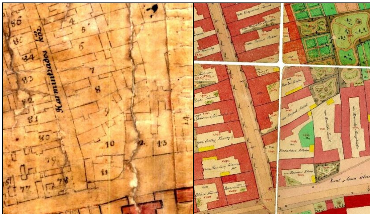
6-7. kép A mai Batthyány utca – egykoron Harminczados köz – részlete a DvT. 34-es jelzetű XVIII. század második felére keltezhető, valamint a DvK. 24-es 1872-es datálású térképeken 9

rölegesen álló formában valósult meg, majd a XVIII. század vége, valamint a XIX. század eleje felé, az 1802-es, illetve 1811-es nagy tűzvészek után egyre inkább előtérbe került az utcával párhuzamosan elhelyezkedő építkezés.