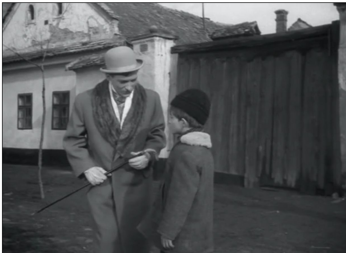
35. kép Részlet a „Légy jó mindhalálig” című filmből. Háttérben a Cserepes utca 23. szám 33

Nem mellesleg ez az a ház, ahol a „Légy jó mindhalálig” című 1966-os filmet részben forgatták, ugyanis e helyen élt a vásznon megidézett regénybeli Dorogi család! Napjainkra azonban már eltűnt a filmben még látható fakapu, a padláslyukak díszei is elporladtak az idők során, maga a padlásfeljáró és a kemence sincs már meg, az épület hátsó traktusa pedig összeomlott. A belső tér bejárásakor egyébként évszázadokat léphettünk vissza az időben, hiszen nem voltak benne gázvezetékek, nem volt bevezetve a víz, nem volt benne a mai kor ízlésének és komfortjának megfelelő fürdőszoba és konyha sem, tehát mint egy zárvány részint még mind a mai napig mutatja a ház – és lakói - korábbi világát. Szerencsére a filmnek, a fotóanyagnak köszönhetően, valamint hogy még be tudtuk jutni és fel tudtuk mérni az épületet, ha csak virtuálisan megidézve is, de valamilyen formában megmaradhat a ház az utókor számára.