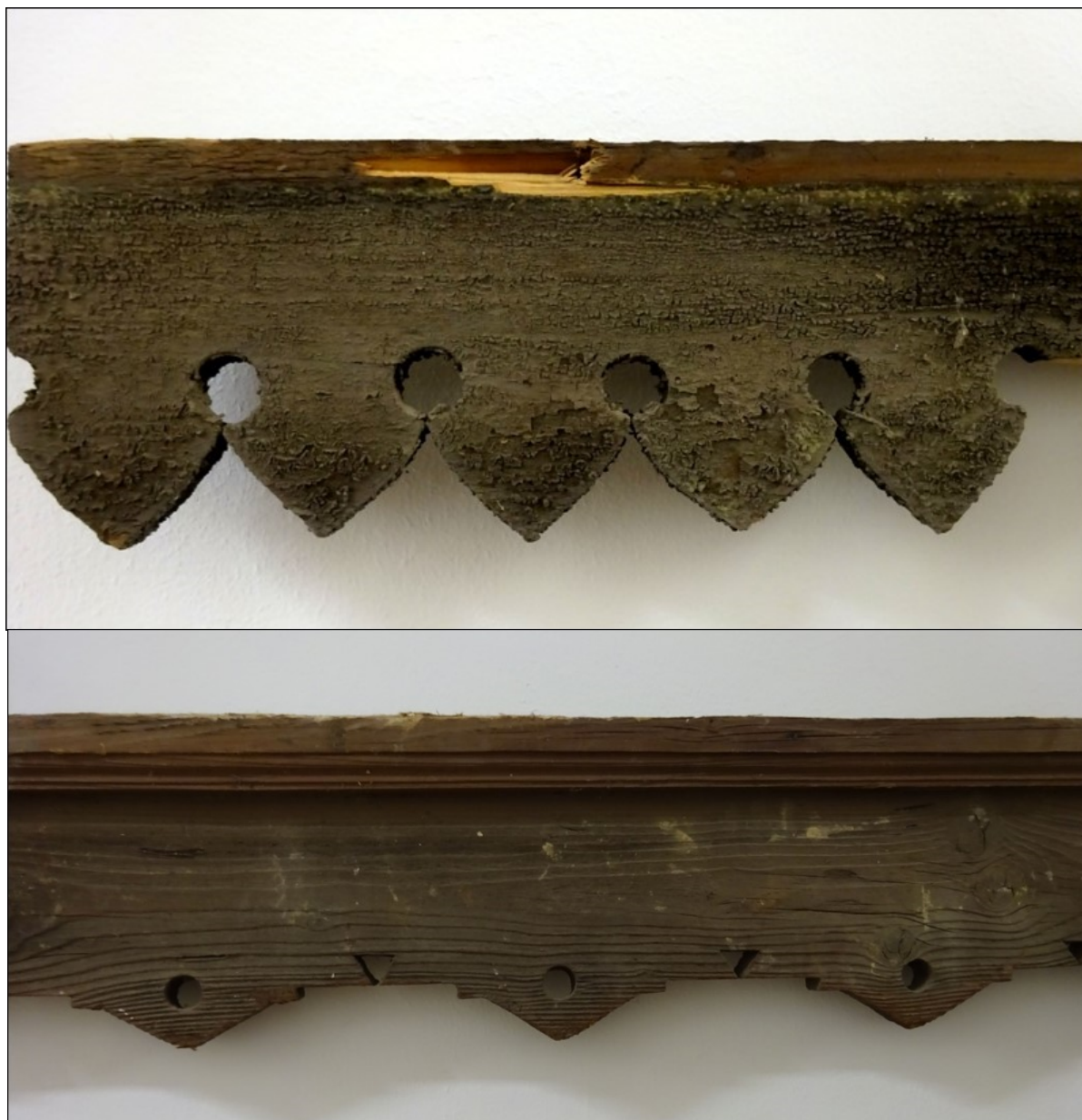
41-42. kép A Baross utca 9. számú ingatlan díszes esővető deszkái 38

A gyűjtés tehát a bontott, vagy bontásra ítélt házak anyagmentését jelenti elsősorban, de még ez a munka is a kezdetén tart. Távlati célként megfogalmazható azonban egy építészeti fragmentumtár létrehozása, amely bárki számára látogatható módon mutatná be a megőrzött értékeket. Felvetődik viszont a kérdés: mindezeket túl milyen lehetőség van még a cívisházak