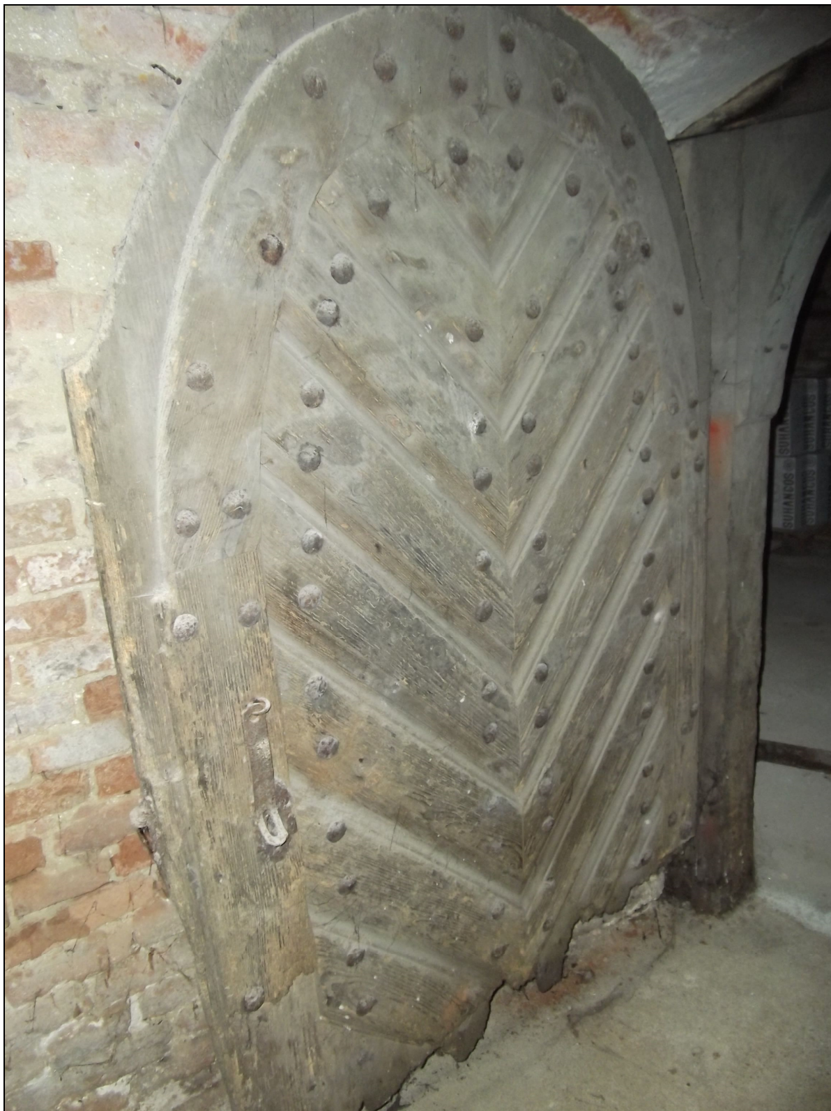
24. kép A Csapó utca 27. számú cívisház ódon pincéjében álló barokk kidolgozású fakapu 25