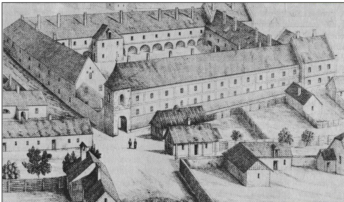
1. kép A Debreceni Református Kollégium egykori épülete az 1802-es nagy tűzvész előtt 3

keztek, ezen felül a Bellegelőn esetleg egy-egy tanyával, ugyanakkor a Hortobágyra kihajtott igen komoly jószágállománnyal is bírtak. 4 Ez a tulajdonviszony, valamint a református hitben való meggyőződés olyan önérzetes emberi tartást adott az itt élőknek, amelyet mindezek összessége alakított ki az idők során. 5