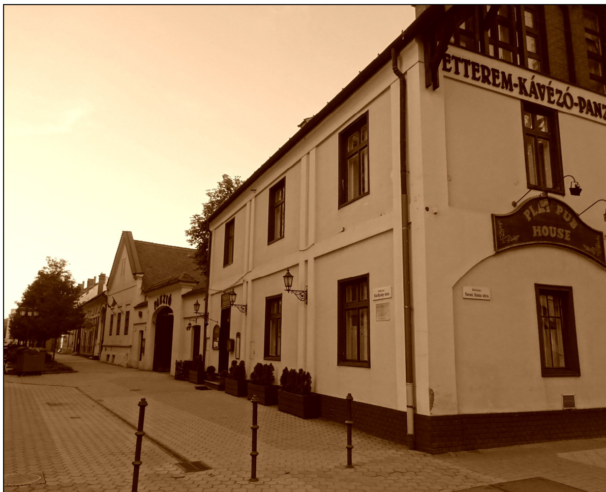
15. kép A XVIII. századi és azt megelőző korok jellegét magán viselő Batthyány utca 24. és 26. számú ingatlanok 16

gasság, majd a tömbök szintszámai is megemelkedtek. Mindezek azonban jellemzően csak az 1802-es, valamint 1811-es nagy tűzvészek után válhattak csak általánosan elterjedté.