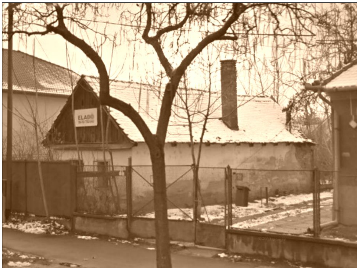
32. kép Egykori présház, a Csígekertben. Böszörményi út 16. szám 30