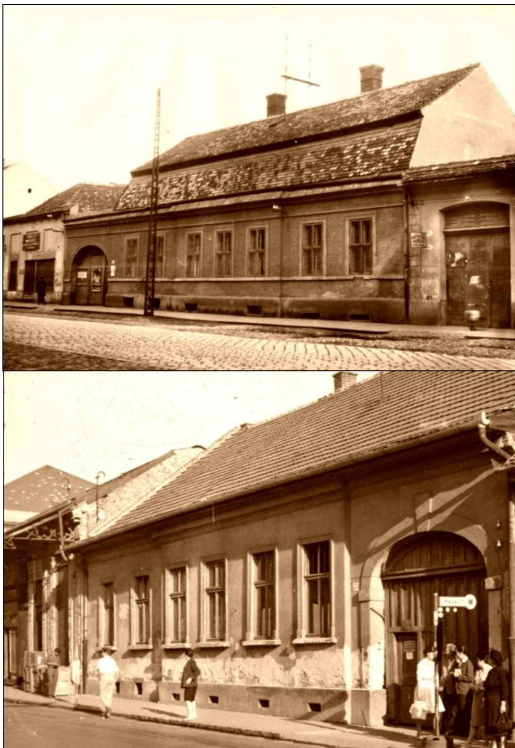
10-11. kép Simonffy Sámuel, Debrecen város főbírájának egykori lakóháza, napjainkban Széchenyi utca 10. szám, valamint a Széchenyi utca 4. számnál található lelkészlak 12