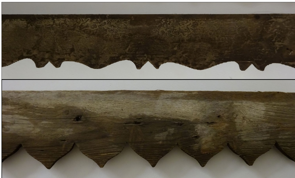
43-44. kép A Böszörményi út 16., és a Bezerédj utca 26. számú ingatlanok díszes esővető deszkái 39