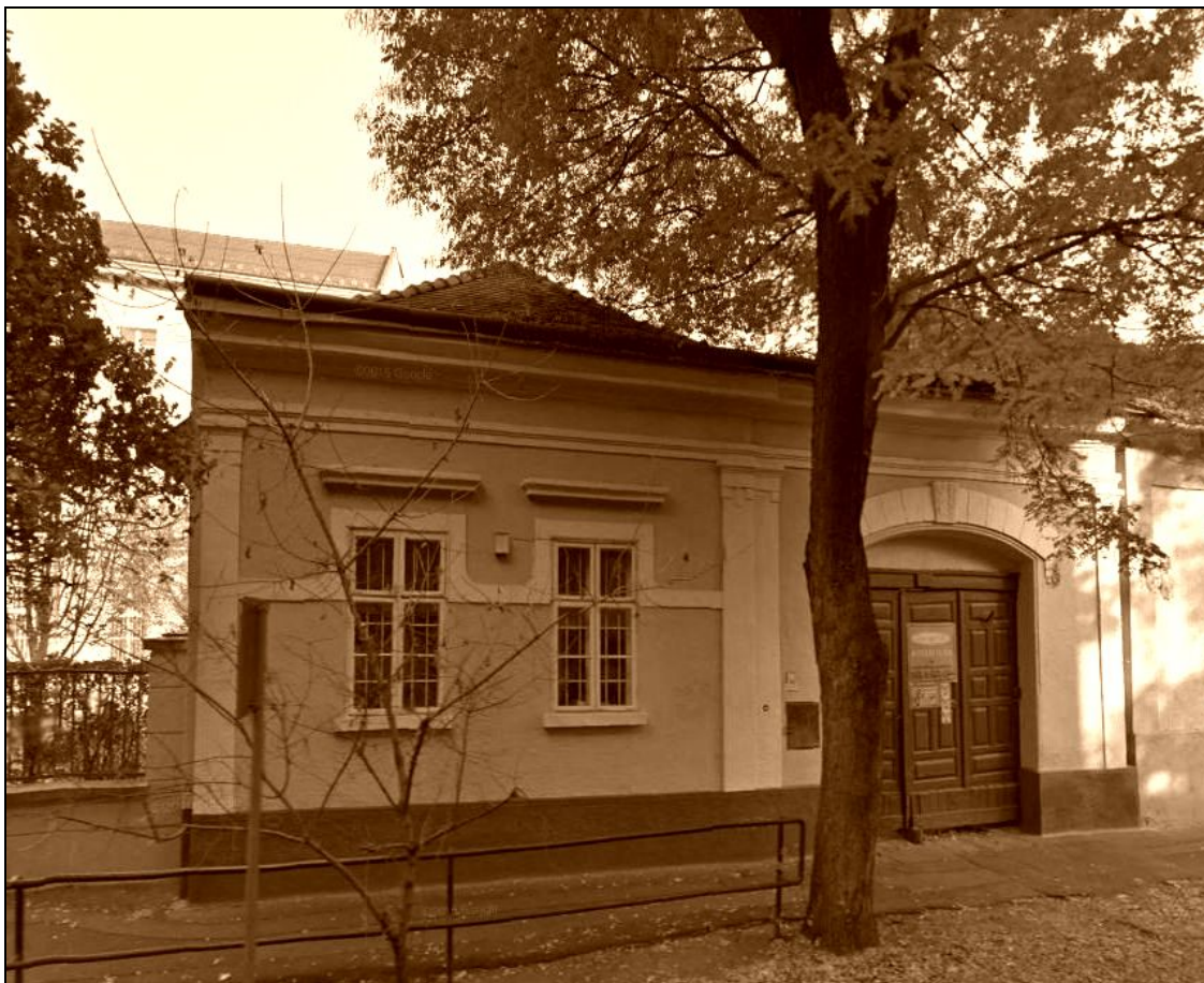
13. kép A Varga utca 6. számú copf stílusú cívisház az 1760-as évek előtt már állt 14

tervgazdaság, az iparosítás, majd a fogyasztói társadalom begyűrűzése semmisítette meg mindazt, ami a cívisek életmódjához még túlélő szegmense volt.