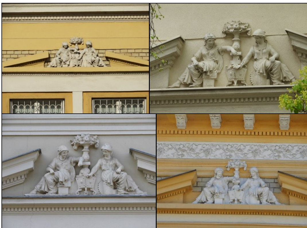
2-5. kép A Rákóczi utca 21., 65., a Bajcsy-Zsilinszky Endre utca 51., és a Garai utca 28. számú ingatlanok típusstukkói 8

Debrecenben viszonylag sok olyan cívisház maradt fenn, ami díszes homlokzattal készült, javarészt pedig az eddigi kutatások alapján 1880-1890-es évekre datálható. Ennek a korszaknak az építészeti jellege azonban csakis addig tudott és volt képes megjelenni, amíg volt rá megfelelő mennyiségű anyagi forrás. A gazdasági világválság, Trianon, az I. és a II. világháború idején viszont már annyira nem jellemző, hogy magánemberek akkora pénzállománnyal rendelkezzenek, hogy minél díszesebb épületet emeltesse. Az építészeti kedv, s így maga a fellendülés korszaka is tehát az 1867-es kiegyezéssel vehette kezdetét, az 1896-os millenniumi korszakkal érte el csúcspontját, kifutása pedig a kései 1920-1930-as évekre datálható, ezáltal pedig relatíve nem igazán tekinthetőek „réginek”, hovatovább igencsak hasonló képet mutatnak ebből a korszakból más városok épületállományával.