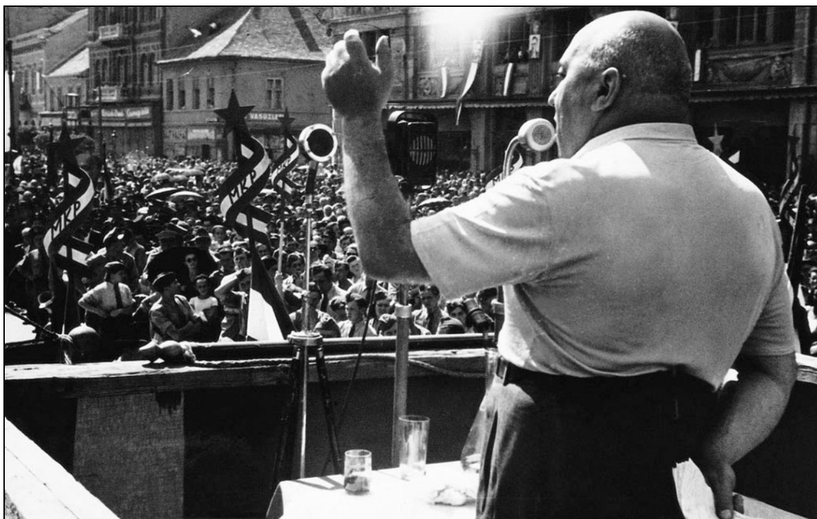
14. kép Rákosi Mátyás Debrecenben a Magyar Kommunista Párt 1947-es választási nagygyűlésén 15