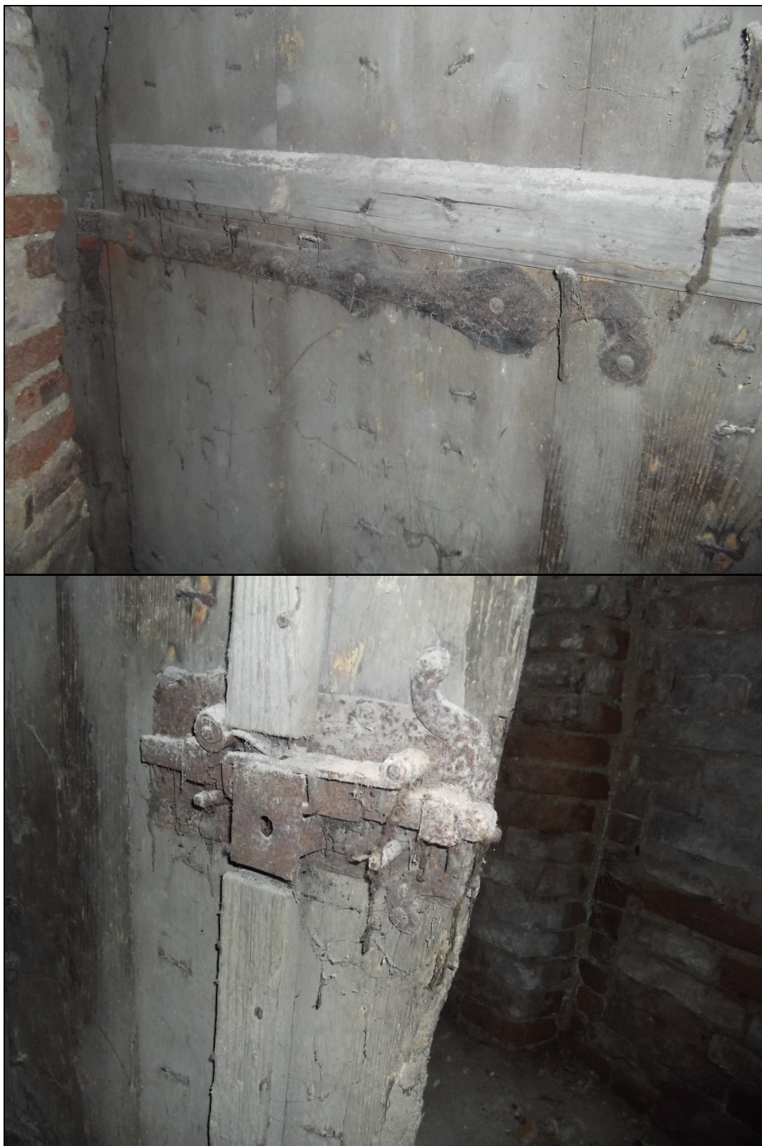
28-29. kép A kapu egyik mives kovácsolt vasalata és zárszerkezete 27