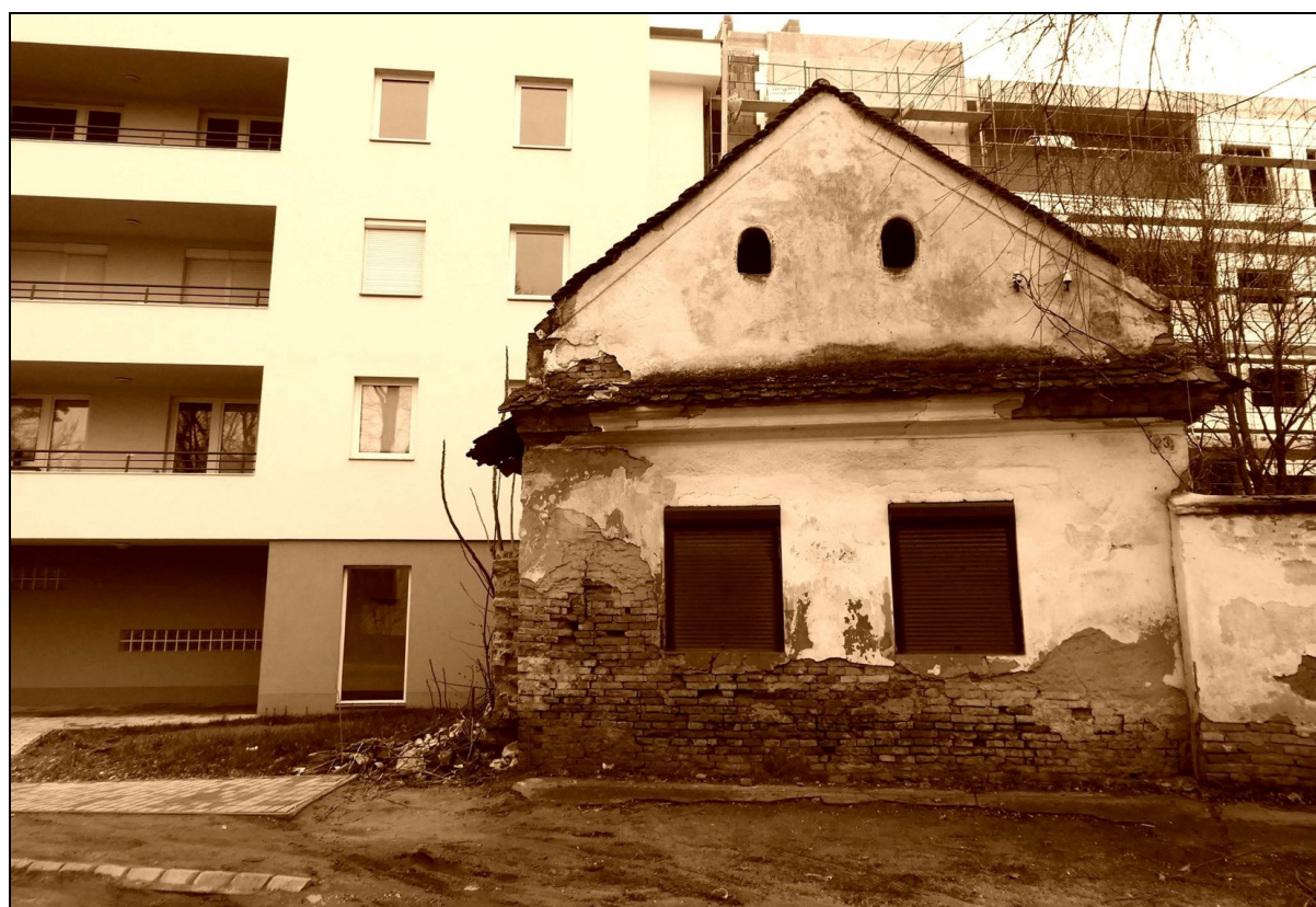
34. kép Módosabb cívisház feltehetően a XVIII. század első feléből. Cserpes utca 23. szám 32

„Cíviskók” után essen szó néhány archaikus cívisházzról is... A fentebb emlegetett Rákóczi utca 13. számú ingatlan már átengedte helyét a város modern struktúrájának, és a Cserpes utca 23. számú, szintúgy az 1760-as évek előtti időkre keltezhető ház is lassacskán összeroskad, átadva saját zárkózott kis világát az enyészetnek. Helyzete napjainkra szinte már menthetetlen, hiszen az elkerülő út éppen arra halad majd, de ha nem is abba az irányba vezetnék a nyomvonalat, akkor is olyan romossá és hiányossá vált az ingatlan, hogy eredeti helyén és állapotában való megőrzése már igencsak nehezen lehetne rentábilisnak tekinthető... Megmenthető egy-két vasalat, vagy téglá, a felmérések alapján pedig elkészült a ház rajzi anyaga is... Az épület ezáltal tehát viszonylag jól dokumentálttá vált, és így akár rekonstruálható is lehetne, annak ellenére, hogy olyan sok archív terv nem maradt fenn róla.