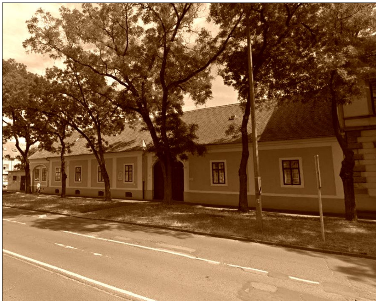
18. kép A Szent Anna utca 29. számú puritán zárt sorú cívis ház 21

A cíviskarakter utolsó egységébe sorolhatók: 3. „Cifra-cívisházak” : Ezek a tömbök jellemzően már viszonylag jól dokumentáltak, amelyek többsége védettséget is élvez. Urbánus jelleget mutatnak, utcával párhuzamos állású, stukkódíszes házak, zömében a XIX. század második felétől terjedtek el, nagyobb számú megjelenésük pedig az 1880-1890-es évektől mutatható ki. Általában az emberek mentális térképében ez a réteg rajzolódik ki a legerőteljesebben, amennyiben cíviskarakterről beszélünk, pedig éppen ez az, ahogy azt már korábban említettük, amelynél már inkább ismétlődhetnek a stukkók típusmintái sőt, akár egyéb más városokban is megtalálhatóak lehetnek ugyanazon motívumkincsek... – nyilvánvalóan azért