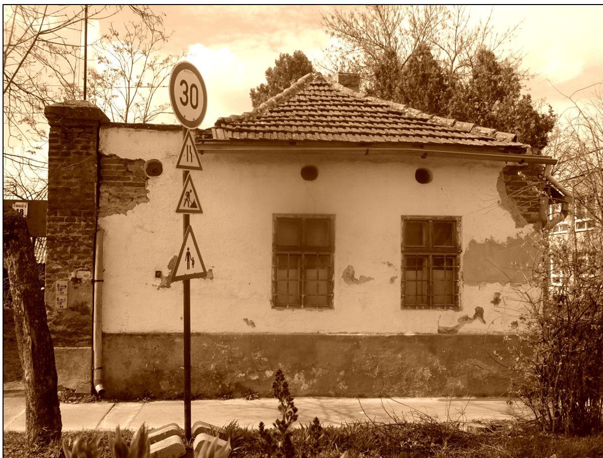
33. kép Puritán cívisház feltehetően a XVIII. század első feléből. Faragó utca 18. szám 31

A már említett Bezerédj utca 26. számú présház felmérését 2016-ban a Debreceni Egyetem Műszaki Karának hallgatóival együtt elvégeztük. Az épület ma már nincs meg... A diákokkal közösen 2017-ben megkezdtük a Böszörményi út 16. számú ház dokumentálását is, 2018-ra ezt az épületet is elbontották. Ugyanebben az évben nekiveselkedtünk a Faragó utca 18. számú telken is a feladatnak, ahol számítógépes modellen még a nádfedelet is sikerült rekonstruálni! Szerencsénkre ez a ház még áll.