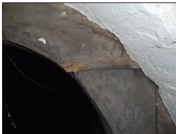
25-27. kép A kaputok szemöldökgerendájának középső motívuma, és az 1746-os felirat 26