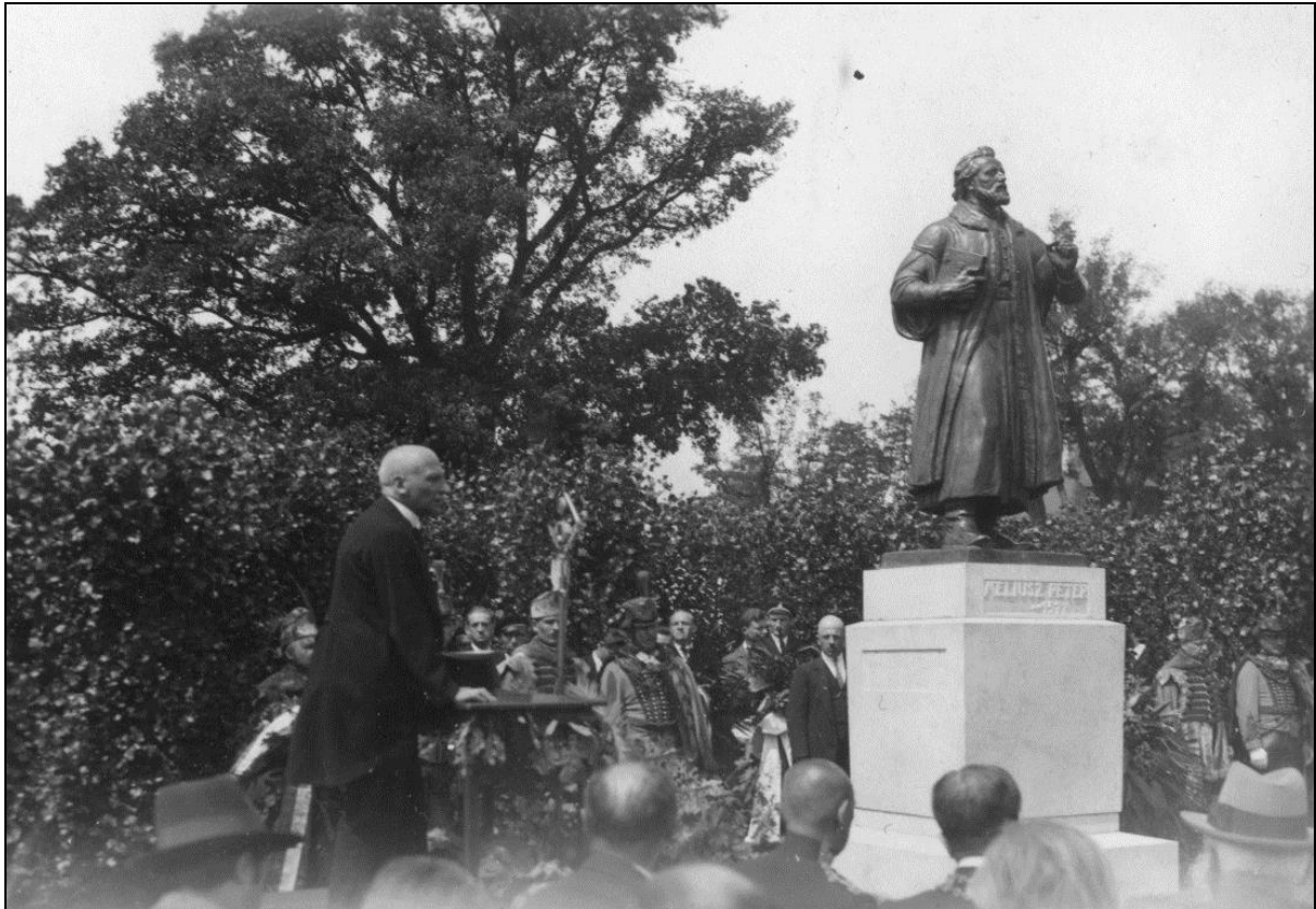
8. kép Dr. Szily Kálmán államtitkár beszéde Méliusz Juhász Péter szobrának avatóünnepségén 1934. V. 14-én 15

„A négy szobor közül az első... íme készen áll, ezt a vallás-és közoktatásügyi miniszter... nevében ezennel átadom Debrecen szabad királyi város közönségének. Kérem a polgármestert, hogy vegye a szobrot a város birtokába, őrzésébe, oltalmába.” – mondta Szily Kálmán államtitkár. 14