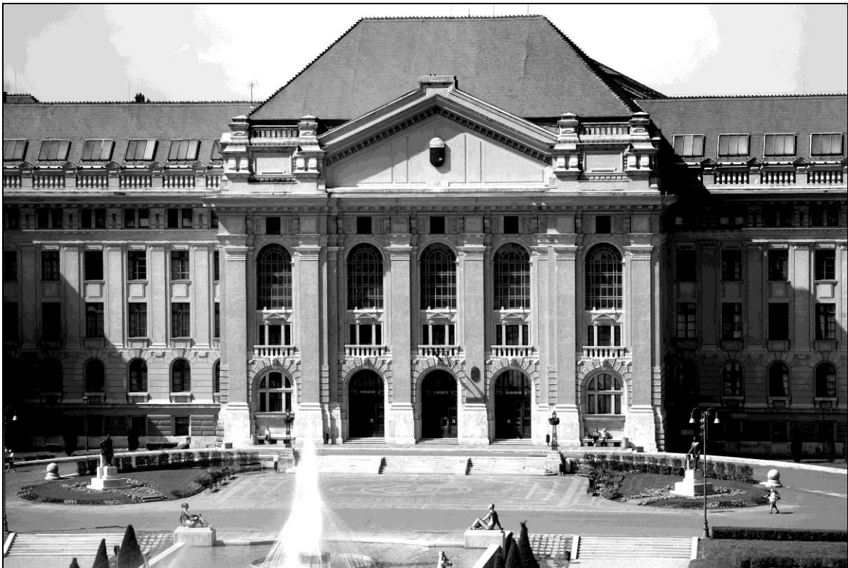
1. kép A Debreceni Egyetem Főépülete és a város egyik legimpozánsabb tere 1

Gyertyánsövény, tiszafák, bronzszobrok, kétlépcsős medence, szökőkút, több mint 33 ezer négyzetméteres francia mintájú park – már 85 éve alkot elválaszthatatlan egységet a Debreceni Egyetem Főépületével a város legimpozánsabb tere.