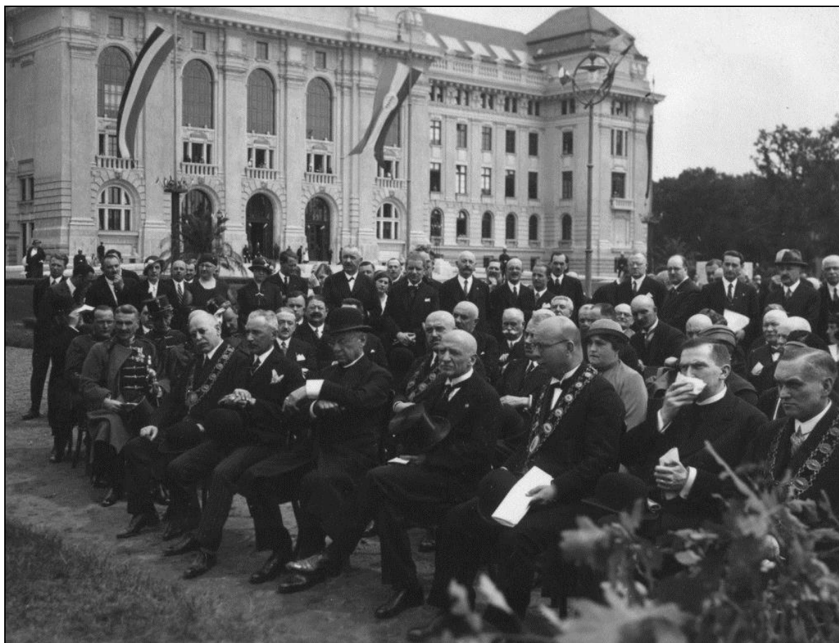
7. kép A szobor avatóünnepségének közönsége 1934. V. 14-én 13

„...Méliusz igazi szobra mi vagyunk: Debrecen, a maga iskolájával, a naga magyar eszményével, a maga örök lelkével. Az ércszobor csak jelkép, mi vagyunk a valóság... Lehet, hogy Méliusz nélkül is megmaradt volna ezen a helyen egy magyar város, amelyet Debrecennek hívnak, de az a város nem volna a Kollégium városa és nem volna az Egyetem városa.” – mondta emlékbeszédében Révész Imre, a református hittudományi kar tanára és prodékánja. 12