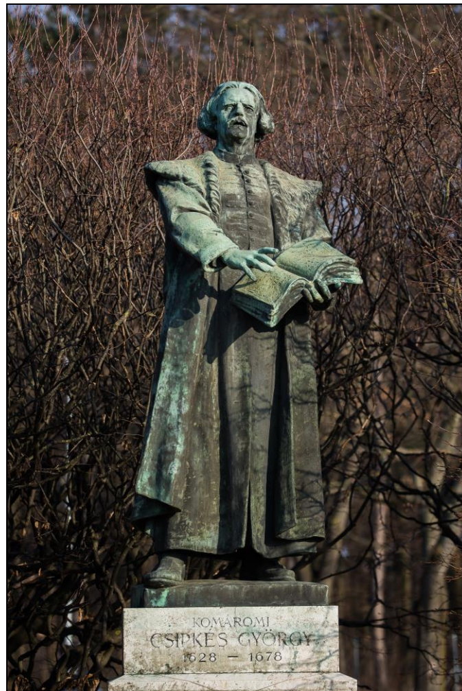
10. kép Komáromi Csipkés György szobra az egyetemi parkban 19