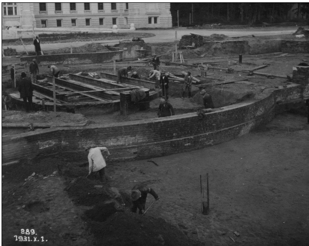
2. kép Az épülő medence 1931-ben 3

A Főépület 1932-es felavatásával a munkálatok nem értek véget, a szomszédos területeken sportpálya, professzori villák (8 villa Györgyi Dénes tervei szerint) épültek, és az épület előtti park rendezése is megkezdődött. A Főépület előtt alakították ki Debrecen legnagyobb – 231 méter hosszú és 144 méter széles – terét, amelyet Klebelsberg Kunó kultuszminiszter elképzelése és megbízása alapján Kertész K. Róbert államtitkár tervezett, középpontjában a 65x20 méteres vízmedencével. Az új tér természetesen igazodott az 1923-ban Debrecen város megbízásából Borsos József főépítész és Pohl Ferenc főkertész elképzelése szerint készült Nagyerdő-rendezési tervhez is. 2