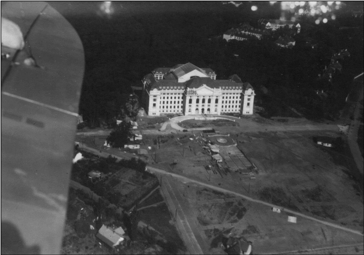
4. kép Az egyetem főépülete és az előtte elterülő tér rendezése, feltehetően valamikor 1931-ben. 4