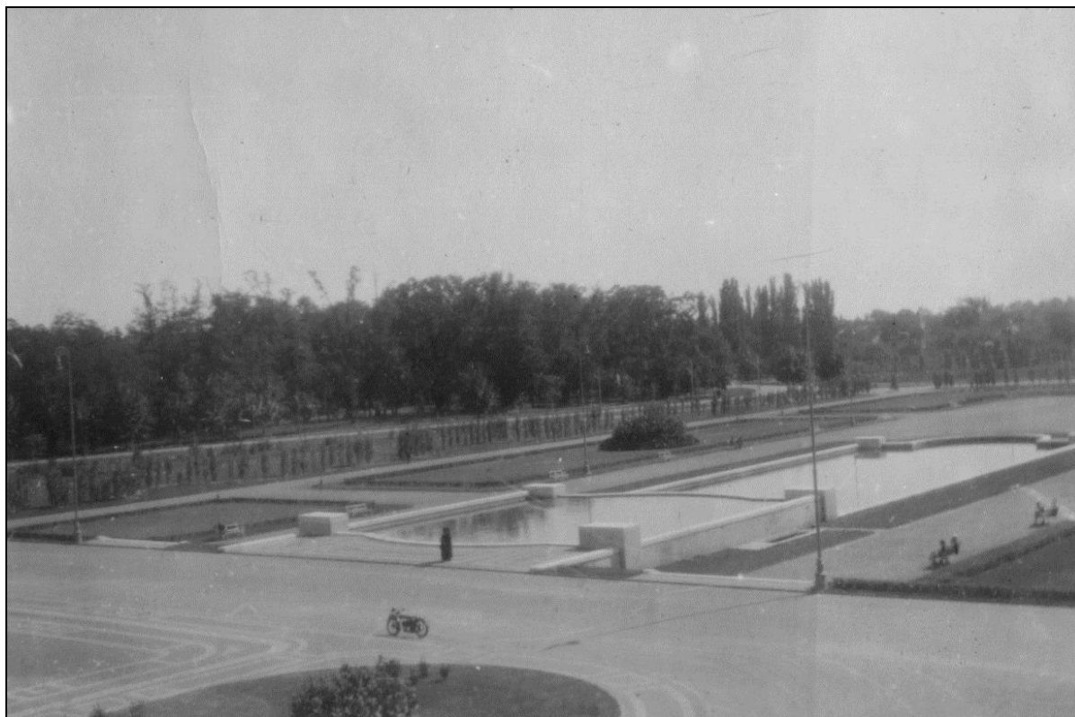
5. kép Az egyetem parkja még szobrok nélkül, valamikor 1931-1934. között 9

Az egyetemi építkezések művezetőségének jelentése szerint egyébiránt 1931 első felében folyamatban volt a téren a medence kialakítása, az aszfaltozás és a kőjárda burkolatok készítése, és megkezdődtek a műkertészi munkálatok is. 8