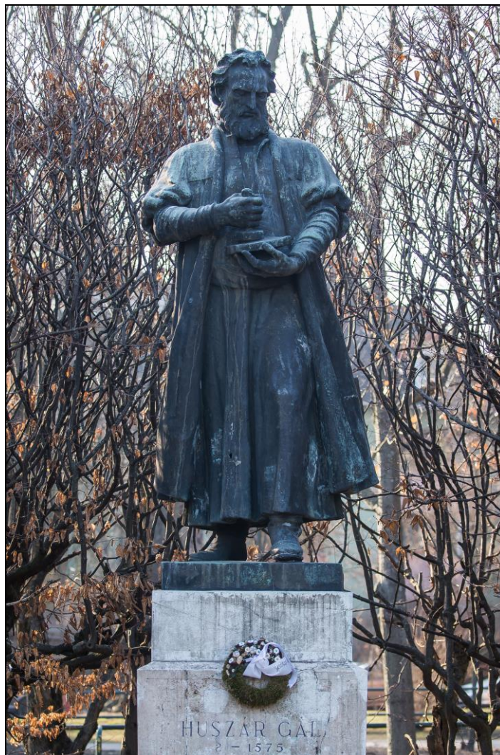
11. kép Huszár Gál szobra az egyetemi parkban 21

A hazai és debreceni egyház- és vallástörténet négy meghatározó alakjának állítanak emléket a szobrok, kapcsolódva az egyetem gyökereihez, és egyben őrizve a város hagyományait is. Bár a négy mű négy különböző szobrász alkotása, mégis egységes együtttest alkot.