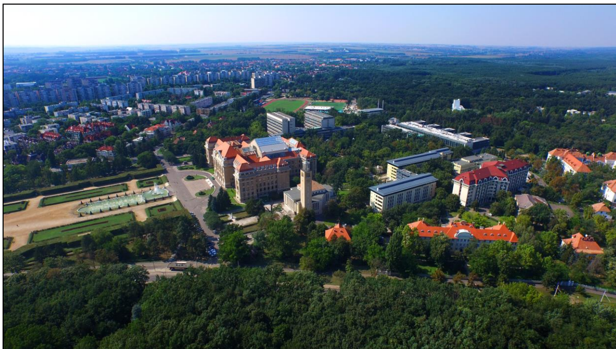
13. kép A Debreceni Egyetemfőépülete és parkja madártávlatból 24

A tér – bár ma sem tulajdona, de – része az egyetemi lét mindennapjainak, hiszen jó időben itt tanulnak, pihennek, beszélgetnek a hallgatók, akik a sikeres államvizsga után meg is mártóznak a szökőkút jéghideg vizében.