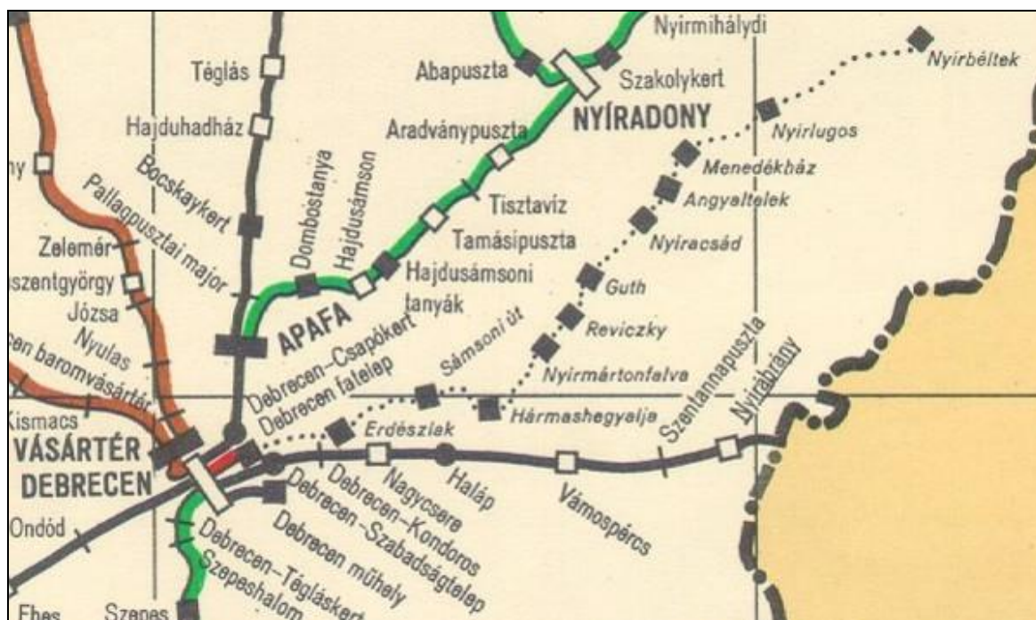
10. térkép A Zsuzsi-vasút teljes hosszban való ábrázolása egy térképen 177

vonat pedig nem csak a városból kirándulókat, hanem a Debrecen környéki falvak és tanyák lakosságát is beszállította a városba, ami 1924-ben Gútig, 1946-ban Nyírlugosig, 1950. november 19-étől pedig már Nyírbéltekig közlekedett.