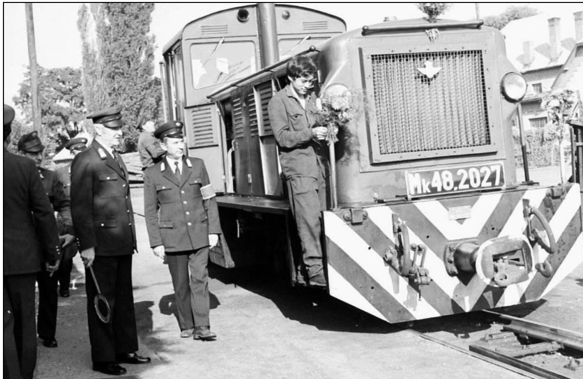
13. kép A megkoszorúzott Zsuzsi-vonat 181

A Zsuzsi-vasút „kivégzését” 1977. augusztus 31-ére tűzték ki. A vasút mentén élő lakosságot nem értesítettek a vonal megszűnéséről, így nem készültek fel a változásra. Az utolsónak indított Debrecentől Nyírbéltekig közlekedő vonaton több helyi lakos lehajtott fejjel búcsúzott: az asszonyok sírtak-zokogtak, a férfiak levették a kalapjukat a megkoszorúzott szerelvény előtt. A mozdonyvezető búcsúzóul hangos kürtszóval köszönt el a tájtól. Nyírbéltekhez érve utoljára szállt le a tanyasi utazóközönség, majd a szerelvény tehervonatként indult vissza Debrecen-Fatelep felé.