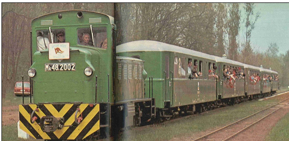
40. kép A Debreceni Úttörővasút 189

műveket lefestették, új épületeket emeltek fel – köztük a fából készült Debrecen-Fatelep állomást és a Hármashegyajjai végállomást. A régi állomást az Április 4-e úti felüljáró építése miatt azonban lebontották, csak a régi fűtőház maradt meg emlékül. Pullai Árpád közlekedési- és postaügyi miniszter 1978. május 1-jén viszont ünnepélyesen átadta a Debreceni Úttörővasutat.