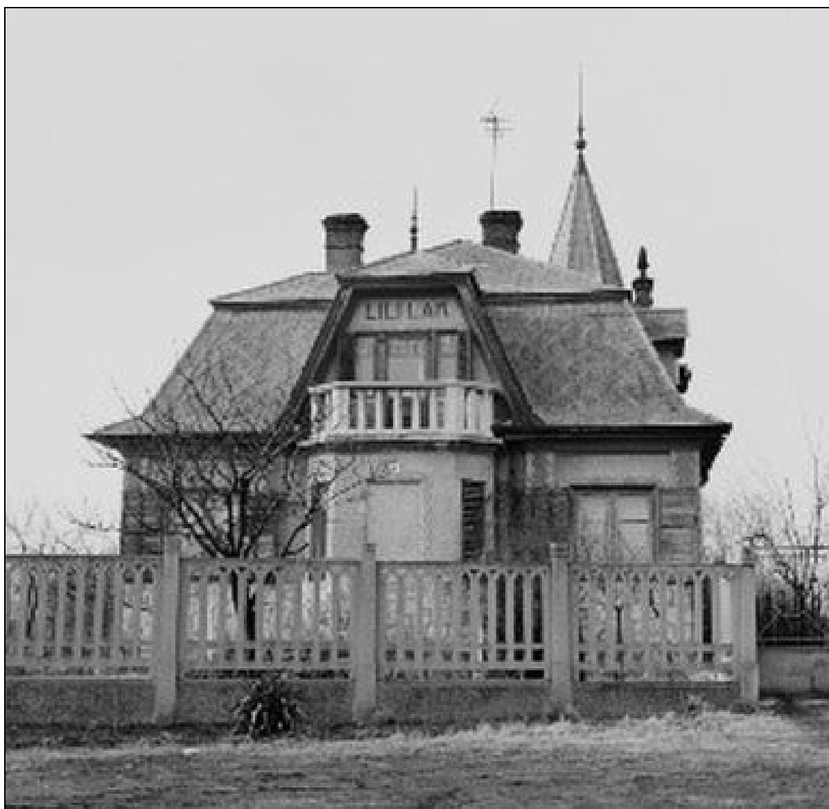
7. kép Lili-lak – Jerikó utca 36. szám 11

A korabeli sajtó a szanálások előtt a kertiségeket úgy mutatta be, hogy ezeken a területeken romos, nyomorúságos körülmények között éltek az emberek. Igen, voltak ilyen házak is, de nagyon szépek is. Ez utóbbira néhány példa. Ilyen volt a Jerikó utca 36. szám alatti Lili-lak, amelyet csak a lakótelep építése közben bontottak le. Amíg az építkezés nem érte el a telket, addig az építők munkások használták öltözőként és étkezőhelyként.