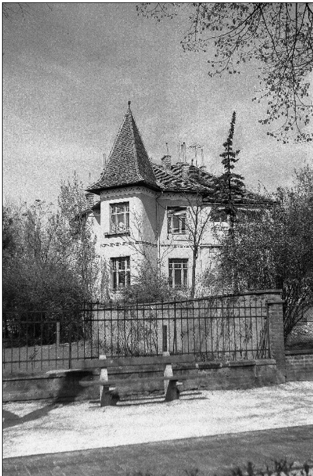
9. kép Stegmüller villa – Simonyi út 14. szám 13