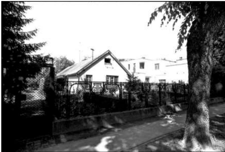
2. kép Komlóssy út 42. szám 5

voltak rajta az eredeti párkánykiképzések, a díszítések formai kialakításai. A tiltakozások ellenére 1977-ben lebontották pedig többen is javasolták, hogy szőlészeti, borászati múzeumot alakítsanak ki benne.