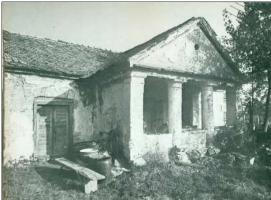
3. kép Présház a Jerikó utca 34. szám alatt 6