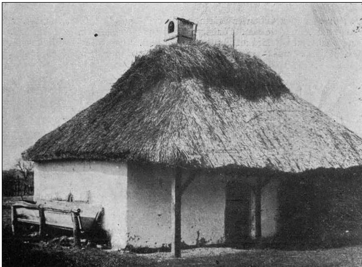
1. kép Pajta a Sestakertben 4

árkon kívül is kisebb viskók, földbevéjt kunyhók és egyre komolyabb prэшázak, amelyeket itt-ott lakhatásra is használtak. Debrecenben a prэшázakat pajtáknak is hívták. Ezek eleinte vályogfalúak, illetve nádfedelesek voltak. Ilyen pajtákat fényképezett le Balogh István 1947-ben. Leírása szerint ezekben már szabadtűzhelyeket is kialakítottak.