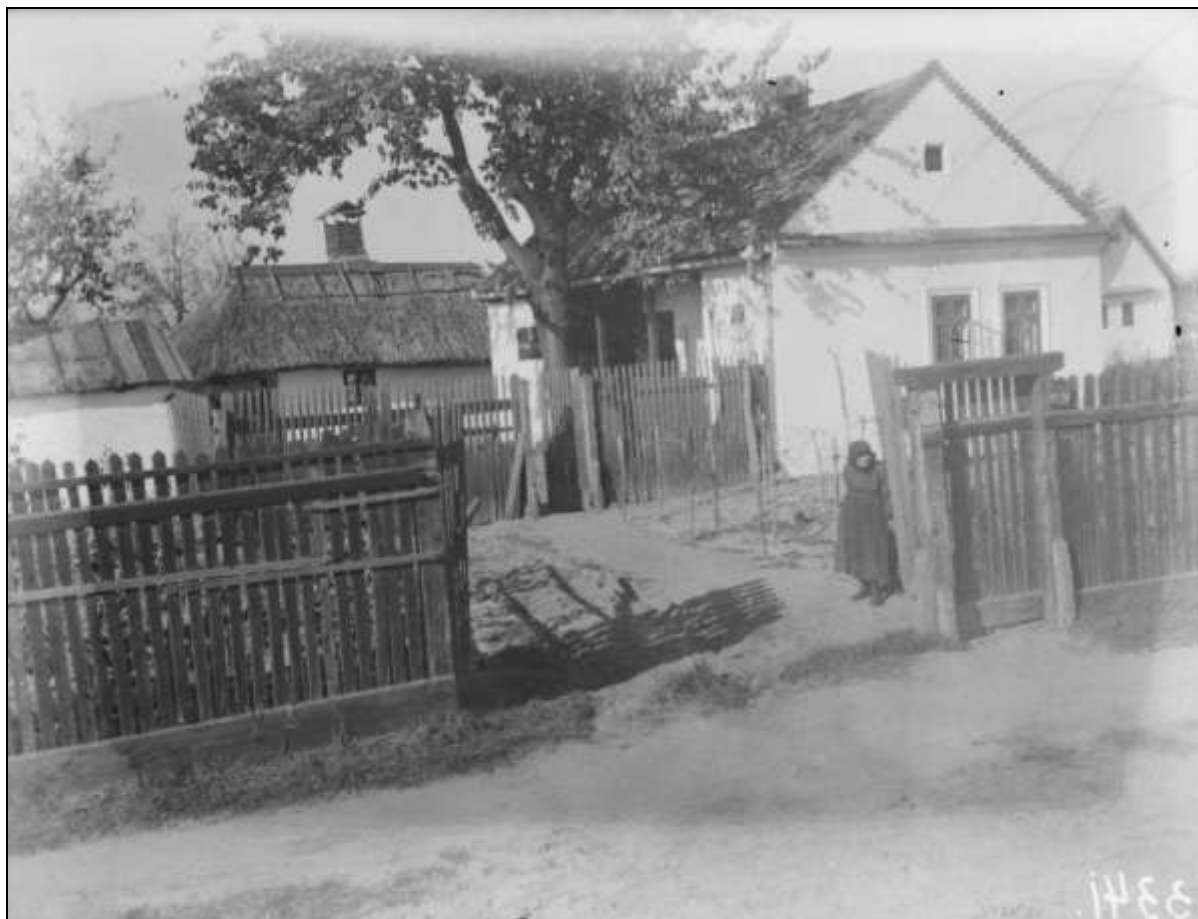
4. kép Nádor utca 10. szám alatti kettős udvar 7

Az Alföldön sok helyen jellemző volt a kettős udvar, ahol általában a külső udvart az állatok számára tartották fenn. A lakóház többnyire a belső udvarban állt, de később már az ólakat is ide költöztették, és a külső udvarból kertet alakítottak ki. Az utcáról tehát csak két kapun, illetve a kerten át lehetett a belső udvarra hajtani. Ilyen debreceni udvar volt egykor a Nádor u. 10. szám alatt is, amiről 1937-ben fényképet készítettek. Ehhez hasonló több helyen is volt, főleg a kertségek szélső utcáiban.