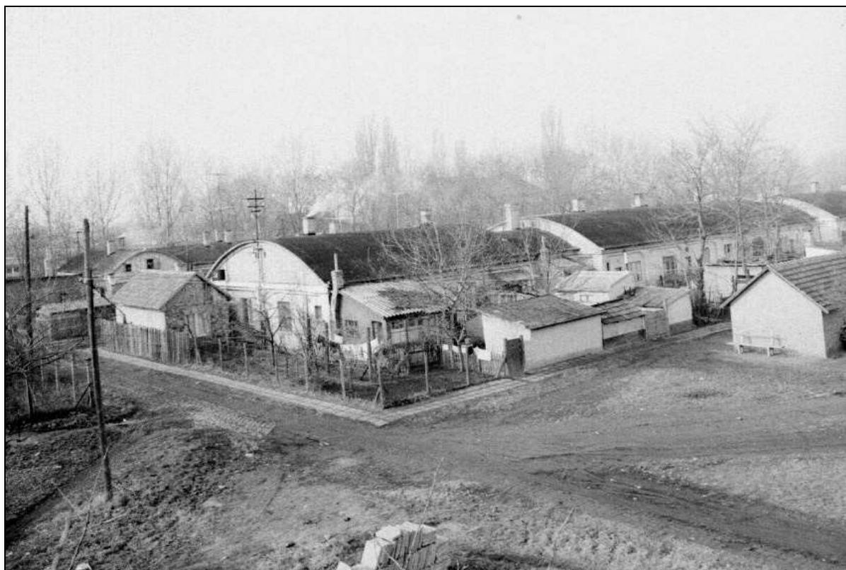
16. kép Salvator katonai barakk 19