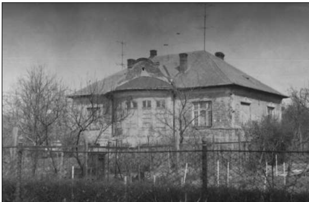
8. kép Herczeg villa – Domokos Lajos utca 15. szám 12

Az Aczél utca 19. számú ingatlan Aczél Géza a város főmérnökének háza volt. A helye üresen áll, hasonlóan mint a Borsos-villát érdemes lett volna megmenteni. A Domokos Lajos utca 15. számú ház a Borsos villa mellett állt. A lakótelep építése idején még meg volt, az építésvezetőség használta, ma játszótér van a helyén.