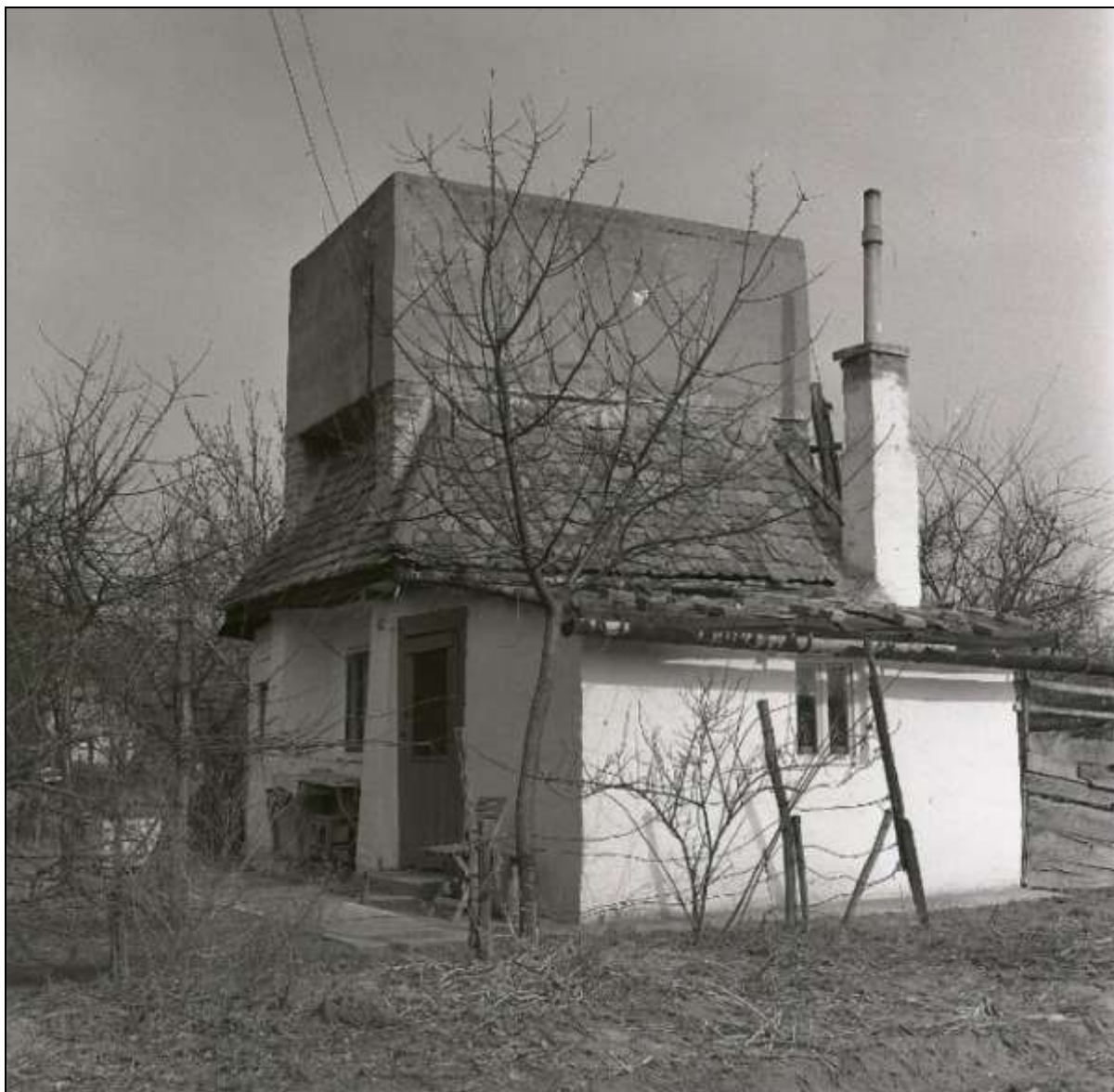
5. kép Böszörményi út 105. szám 8

A Böszörményi út 105. szám alatt egy érdekes ház állt, amelynek a tetején egy hatalmas beton víztartály volt. Tulajdonosának nagyobb területen pöszmétés kertje volt, és annak öntözésére gyűjtötte benne az esővizet.