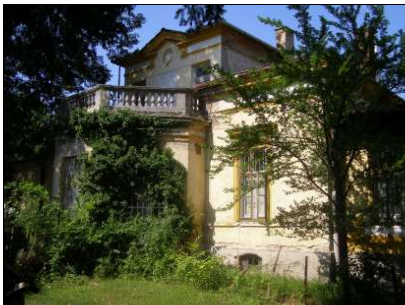
13. kép A Simonyi út 32/A. szám 16