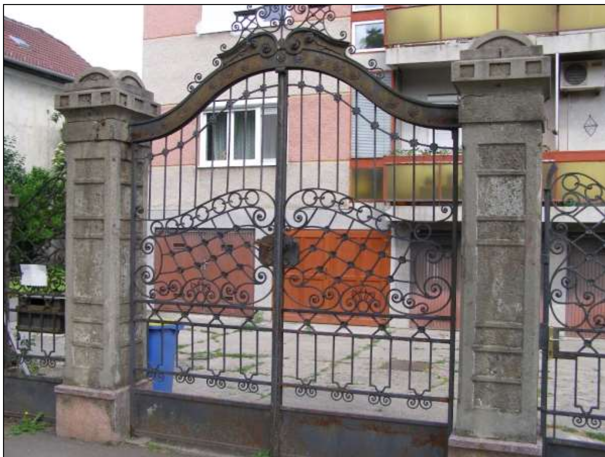
17. kép A lebontott Than villa megmaradt kapuja 20