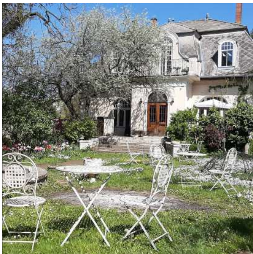
14. kép A Mihalovits villa 17