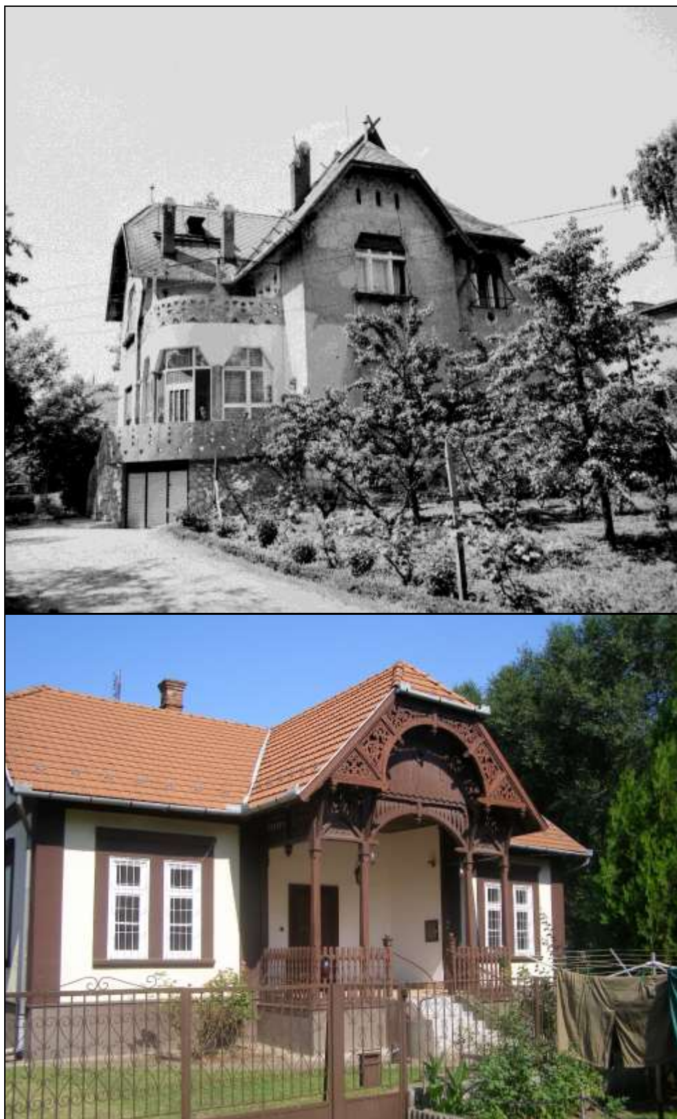
10-11. kép Szentpéteri Kun villa és a régi épület – Simonyi út 40. szám 14