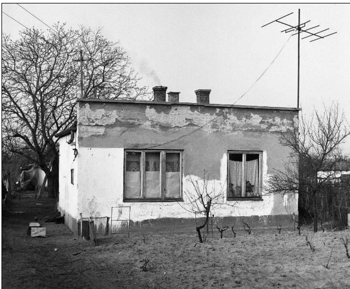
6. kép Lehel utca 44. szám 10

A Debreceni Városi Könyvtár feldolgozó csoportja 1963-ban a Lehel utca 44. szám alatt nyert elhelyezést, egy mindössze 56 m 2 -es épületben. „Az épület egy szanálásra ítélt családi ház volt. A szűk, burkolat nélküli utcába a posta gyakran nem vitte ki a könyveket, hol a sár, hol a por akadályozta. A téli hónapokban előfordult, hogy hetekig nem tudtak kiszállítani, illetve eljuttatni a feldolgozott könyveket a könyvtári egységekbe. A ház egy esőzés után életveszélyessé vált.” 9 Ennek ellenére még évekig dolgoztak itt a könyvtár dolgozói. Átköltözésük után, a szanálásig még lakóházként szolgált az épület.