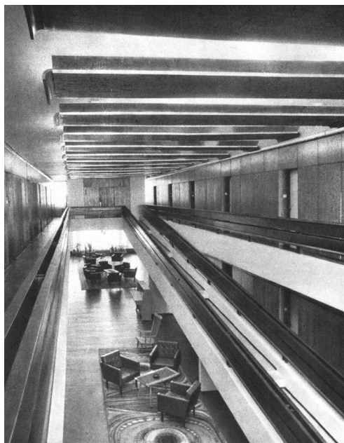
2. kép A kelenföldi nyugdíjsház társalgója (tervezők Spiró Éva és Újhelyi Jenő)