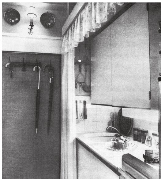
Forrás: Pongrácz Zs. : Házak-nyugdíjasoknak i. m. 13.

A panaszok egy másik csoportja az újságírói, építési beszámolókból, leírásokból fontos helyet kapó közösségi terekkel szemben fogalmazódott meg. Egyöntetűnek