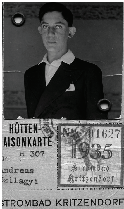
9. Szilágyi Endre, 1935.