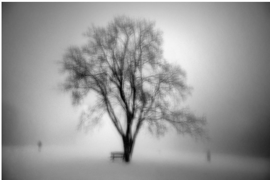
5. Vancsó Zoltán: Budapest, Hungary, 2010 | from the series Landslides – Exploring the Void | Az Álomvölgy – Az üresség felfedezése című sorozatból.