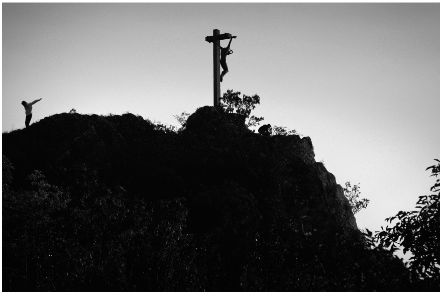
1. Vancsó Zoltán: Pécs, Hungary, 2015 | from the upcoming series Haikus | A Haikus című készülő sorozatból. © Vancsó Zoltán © HUNGART, 2016.