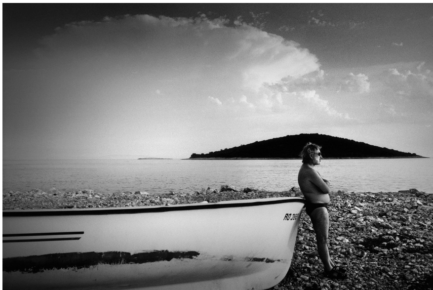
4. Vancsó Zoltán: Adria, Croatia, 2003 | from the series Still Movies – Mediterraneans | Az Állófilmek – Mediterráneum sorozatból.