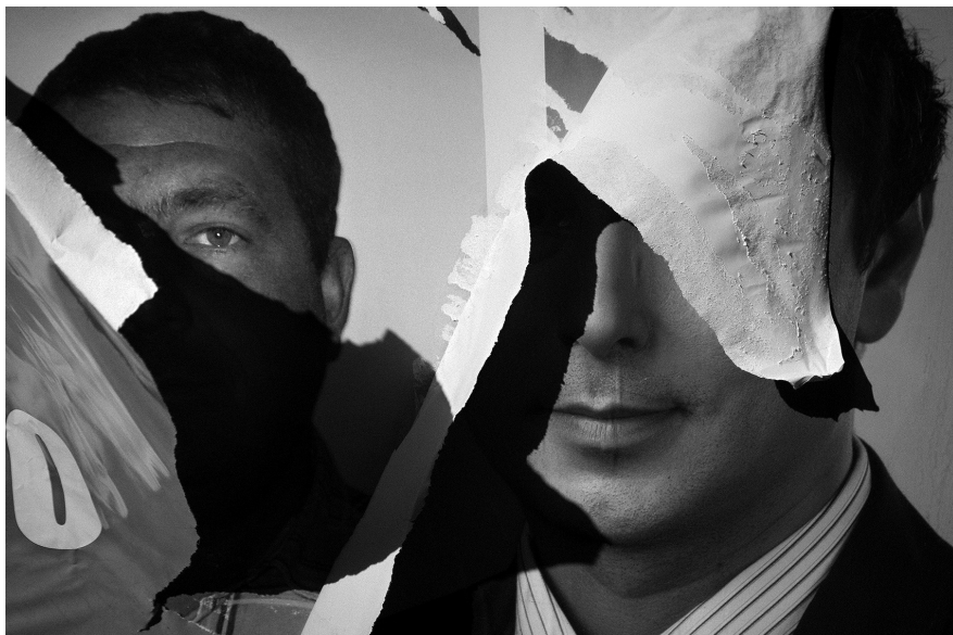
6. Vancsó Zoltán: Unknown Place, Bulgaria, 2011 | from the upcoming series Haikus | A Haikus című készülő sorozatból.