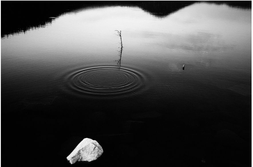
XXI. Vancsó Zoltán: Romania, 2009 | from the series Between Nothingness and Eternity | A Nemlét és örökkévalóság között sorozatból. © Vancsó Zoltán © HUNGART, 2016.