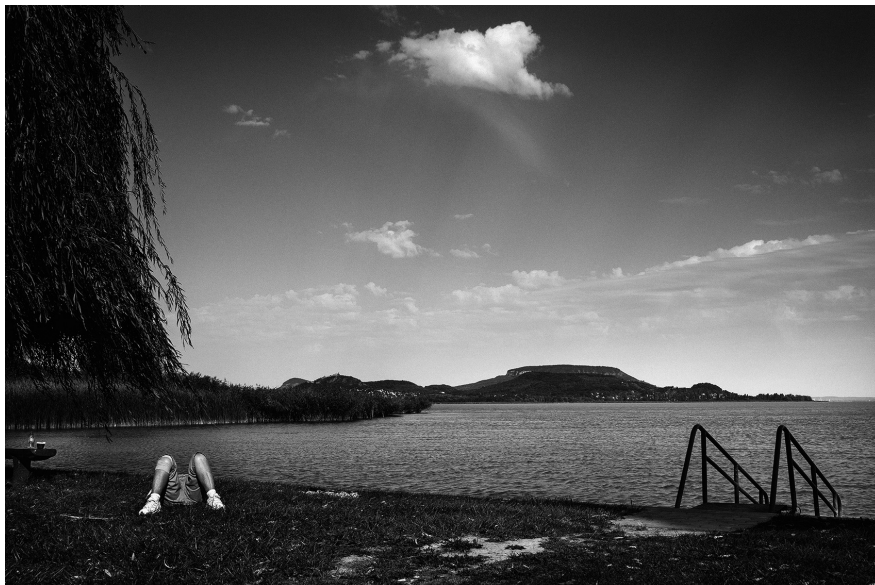
XXII. Vancsó Zoltán: Balatonederics, Hungary, 2015 | from the upcoming series Off Season – Metamorphosis | Az Utószezon – Metamorfózis című készülő sorozatból. © Vancsó Zoltán © HUNGART, 2016.