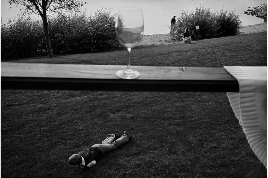
XVII. Vancsó Zoltán: Budapest, Hungary, 2012 | from the series Between Nothingness and Eternity | A Nemlét és örökkévalóság között című sorozatból. © Vancsó Zoltán © HUNGART, 2016.