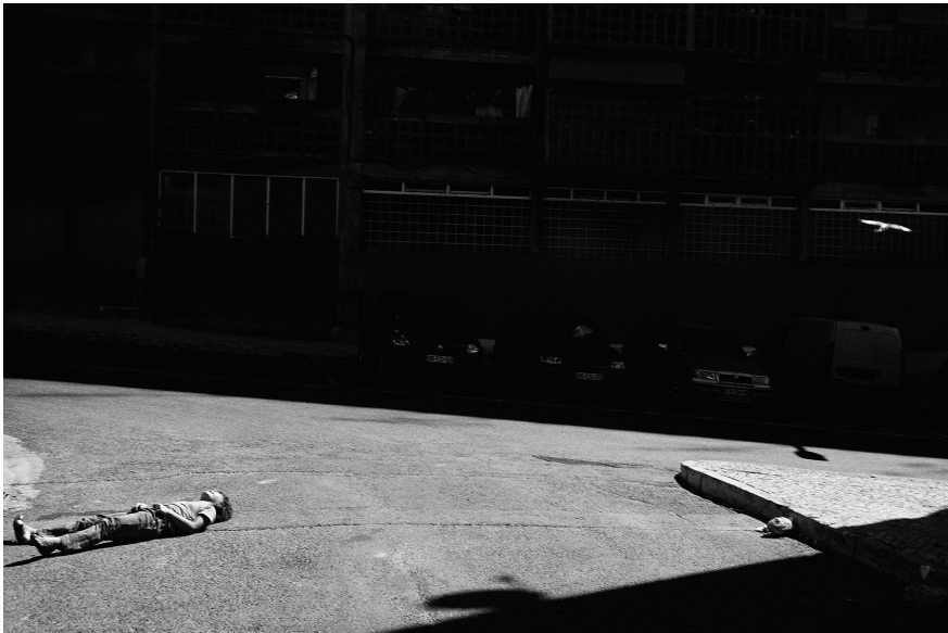
XXIII. Vancsó Zoltán: Lisbon, Portugal, 2014 | from the upcoming series Haikus | A Haikus című készülő sorozatból. © Vancsó Zoltán © HUNGART, 2016.