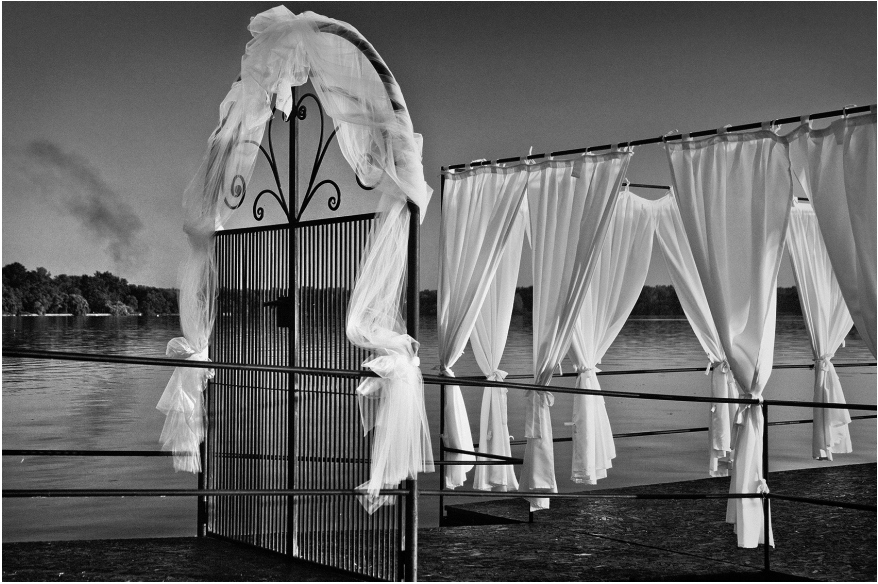
XXVII. Vancsó Zoltán: Tata, Hungary, 2010 | from the series Between Nothingness and Eternity | A Nemlét és örökkévalóság között című sorozatból. © Vancsó Zoltán © HUNGART, 2016.