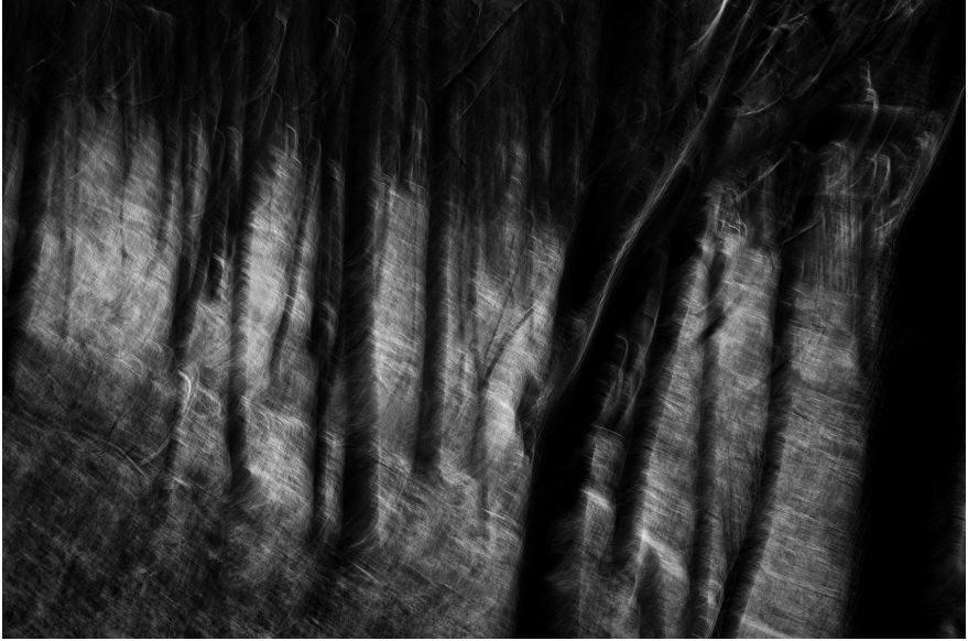
XXV. Vancsó Zoltán: Pilis, Hungary, 2010 | from the series Landslides – Exploring the Void | Az Álomvölgy – Az üresség felfedezése című sorozatból. © Vancsó Zoltán © HUNGART, 2016