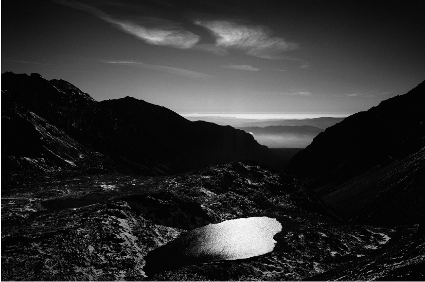
XX. Vancsó Zoltán: Tatras, Slovakia, 2014 | from the upcoming series Haikus | A Haikus című készülő sorozatból.