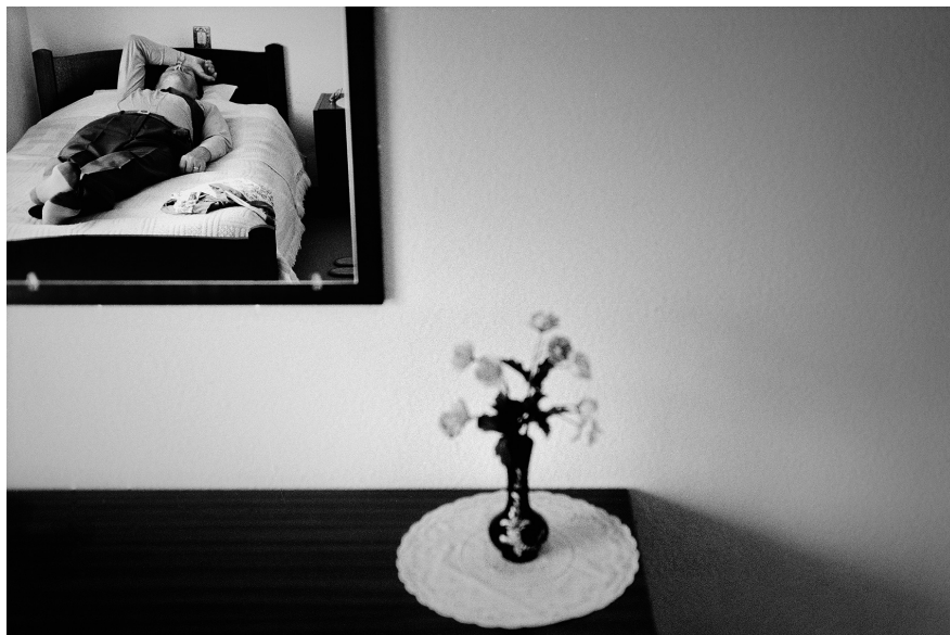
XXIV. Vancsó Zoltán: Fatima, Portugal, 2003 | from the series Still Movies – Silent Stills | Az Állófilmek – Csendes képek sorozatból.