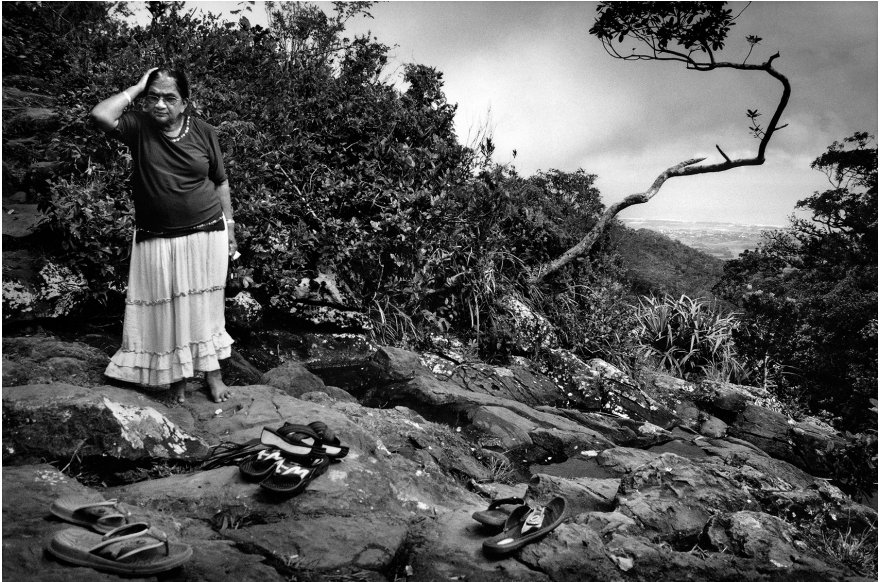
XIX. Vancsó Zoltán: Black River Gorges, Mauritius, 2008 | from the series Unintended Light | A Szándéktalan fény című sorozatból.