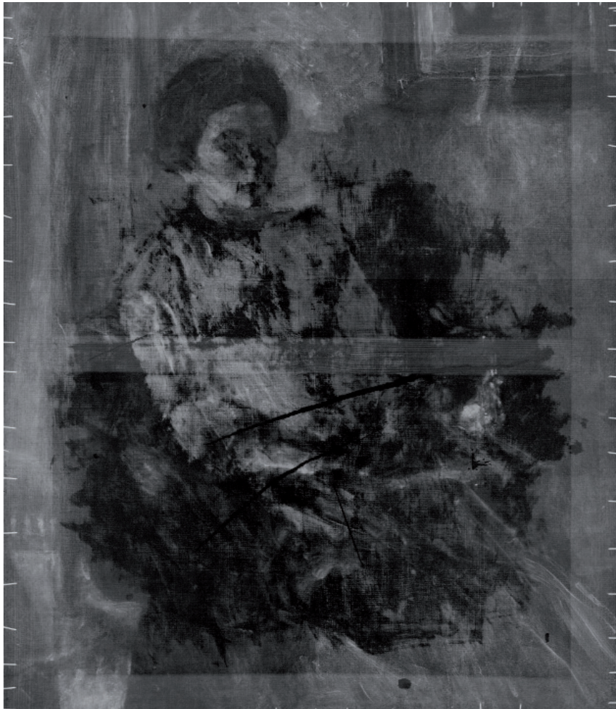
VI. Infra reflexiós felvétel a Varró István arcképe alatt rejtőzködő női portréről.