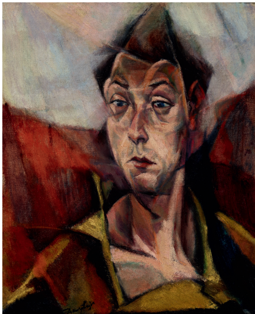
V. Tihanyi Lajos: Önarckép, 1914. Olaj, vászon; 56 x 45 cm. MNG, ltsz.: 62.31T © Szépművészeti Múzeum - Magyar Nemzeti Galéria, Budapest.