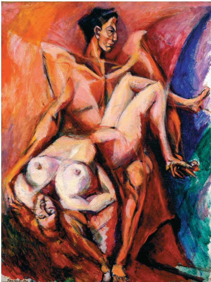
II. Tihanyi Lajos: Kompozíciós vázlat (férfi- és női alakkal), 1911–1912. Olaj, vászon; 119 x 90 cm. © Magántulajdon.