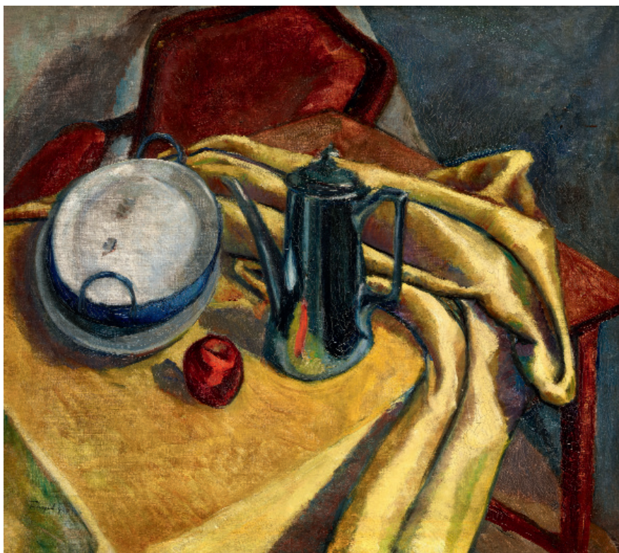
IV. Tihanyi Lajos: Nagy sárgaterítés csendélet, 1909. Olaj, vászon; 87 x 97,5 cm. © Magántulajdon.