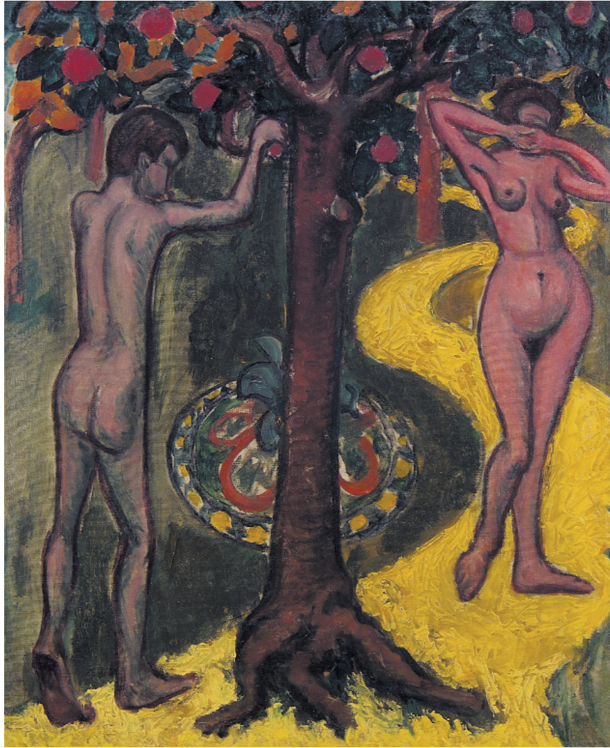
I. Tihanyi Lajos: Ádám és Éva (a Pont Saint-Michel hátoldalán), 1907. Olaj, vászon; 65 x 55 cm. © Magántulajdon.