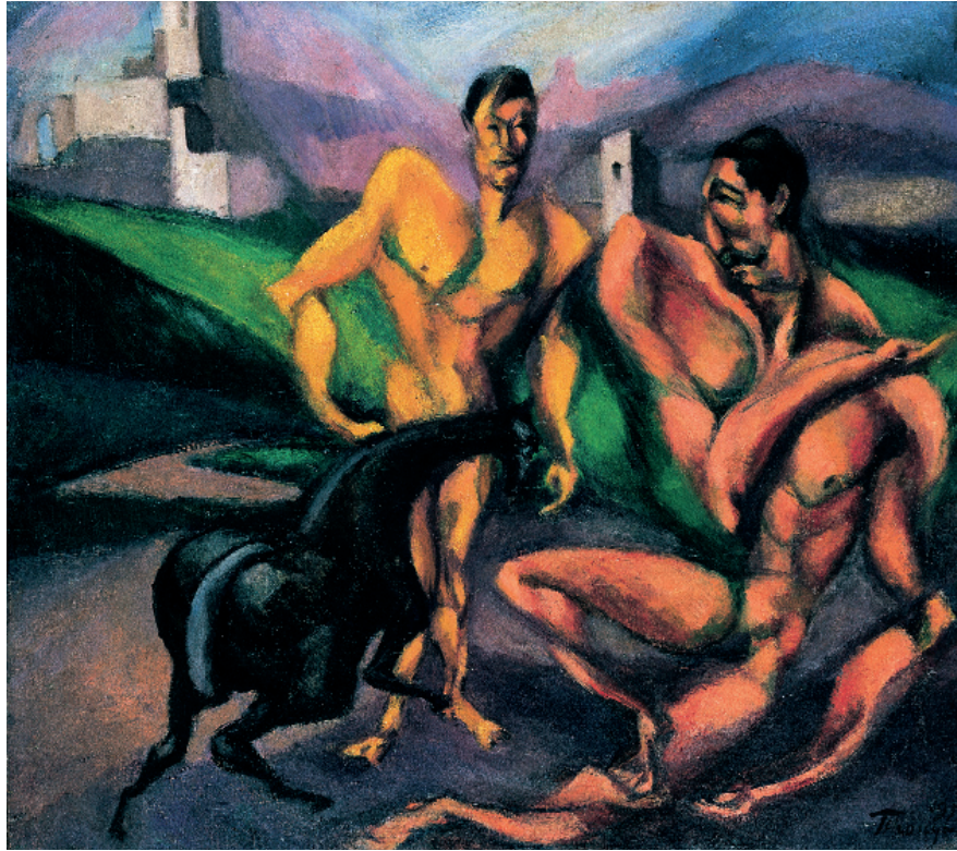
III. Tihanyi Lajos: Kompozíciós vázlat két alakkal, 1912. Olaj, vászon; 78 x 86 cm.