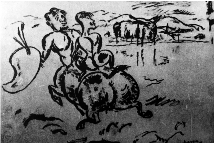
1. Jules Pascin: Tihanyi Lajos a Kernstok-kentaur hátán, 1912 körül. Grafika. Repr. Herman Lipót: A művészsztal. Budapest, 1958. 45. kép.

A klasszikus előképek strukturális alapon történő újrahasznosításának gyakorlatát Cézanne vezette be. A módszer lényege, hogy ezeket az előképeket olyan nyersanyagként tekintette, amit a felhasználás aktusában előbb lerombolt, majd újradefiniált. Arra törekedett, hogy a dekonstruált előkép ne eredeti értelmében legyen hiteles. Klaus Herding ezt a műveletet „autentikus provokálásnak” nevezi: „Nem az előképhez való közeledés autentikus, hanem az attól való eltávolodás.” 7 Ennek egyik szemléletes igazolását kapjuk, ha összevetjük az Émile Bernard 1904-es fotódokumentációján 8 látható A nagy fürdőzők III. című kompozíciót ugyanennek a képek tíz évvel később, 1905-ben továbbfejlesztett változatával – amely jelenleg a Barnes Alapítvány tulajdona. 9 Az archív felvételen a kompozíció bal oldalán még egy szakállas, mitológiai férfialak arányos anatómiai konstrukciója látható, amely hűen igazodik antik szobor előképéhez. Emiatt feszültség keletkezett a „szabályos” férfitest és a dekonstruált női aktok között, amit Cézanne úgy oldott fel, hogy „destruálta” a férfialak klasszikus arányait, majd átgyúrta azt nővé. Az átformált „kompozíciós elem” homogénebb módon illeszkedik az érzékiségtől mentes bábuk ornamentális rendjébe. E figurák nemi