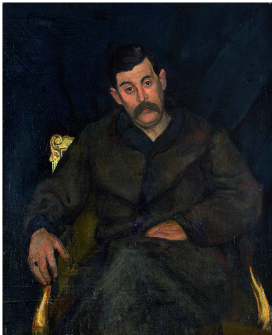
VII. Berény Róbert: Varró István arcképe, 1918. Olaj, vászon; 100 x 86,5 cm; j.b.f.: Berény 1918.