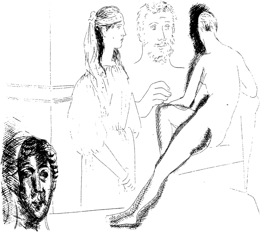
2. Pablo Picasso: Illusztráció Balzac Le chef-d'oeuvre inconnu c. művéhez, 1927; maratott rézkarc, egyetlen állapot; először megjelent: Honoré de Balzac: Le chef-d'oeuvre inconnu. Eaux-fortes originales et dessins gravés sur bois de Pablo Picasso , Paris, Ambroise Vollard éditeur, 1931.

Vessünk egy pillantást például arra a lapra (2. kép), amelyen jobbra a háttal forduló könyöklő aktfigura finoman megkettőzött testkontúráját a bal oldalon végig egyenletes és keskeny keresztirajozás kíséri végig – ez hol belülről (mintegy a test modellálásaként), hol kívülről (a térbeli mögöttre való vonatkoztatásként) kapcsolódik a szabatos körvonal(ak) futásához. Nincs evidenssé tett alap, amelytől a figura önmagáért valóan elemelkedne – aminthogy ez a megkülönböztetés a figura jobb oldalán nem okoz fennakadást. A szoros szemlélet rendre inkonzisztenciákat és folytonossághiányokat tapasztal tehát. A figura feje mögött a sűrűre szőtt vonalhálós folt elsőre pórén absztrakt kontrasztfóliának tetszik – mintha csupán olyan mélységi háttér volna, amelynek az a dolga, hogy a plasztikus test jelenvalóságát engedje érvényesülni. De vegyük észre itt is a picassói forma ambivalens, ha tetszik, próteuszi mivoltát! Mert azzal, hogy a folt vizuálisan fölnagyítva megismétli a fej alakzatát, az a benyomás keletkezik, hogy a figuratest árnyékot is vet maga mögé.