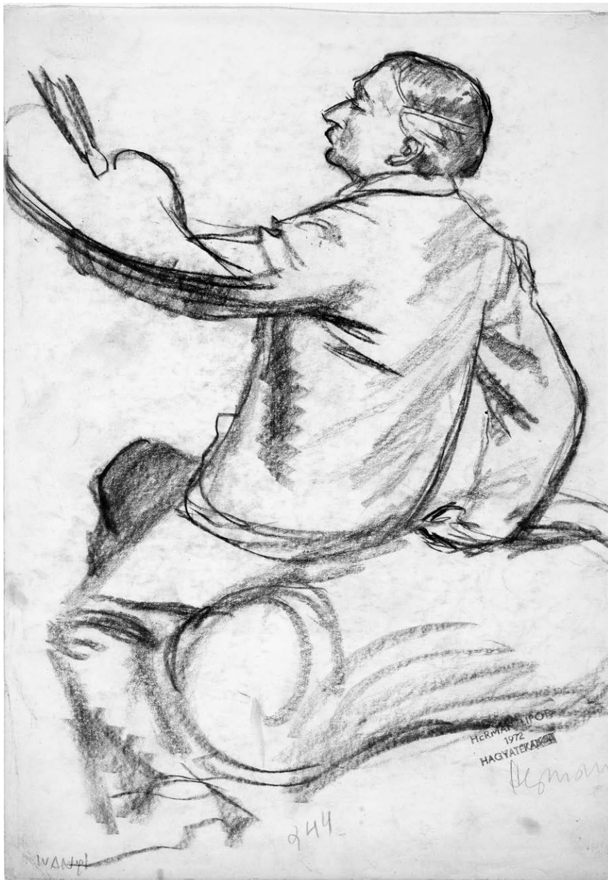
Herman Lipót: Iványi Grünwald Béla, 1944. Grafit, papír, 310 x 215 mm.

Magyar Nemzeti Galéria, Grafikai Osztály, ltsz.: F 75.56