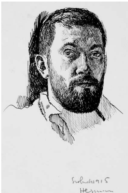
4. Herman Lipót: Portrévázlat, 1915.