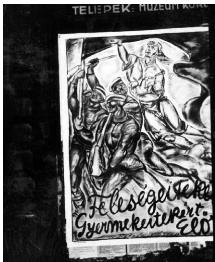
6. Pór Bertalan plakátja a pesti utcán, 1919. május 1.