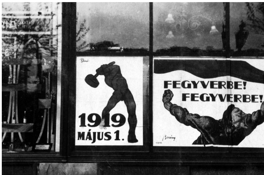
9. Bíró Mihály és Berény Róbert plakátjai, 1919. május 1.