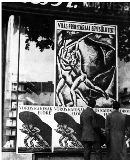
7. Pór Bertalan és Tábor János plakátjai, 1919. május 1.

ez a művésztelep elkezdhette-e egyáltalán a működését a nyár folyamán, arról nincsenek ismereteink.