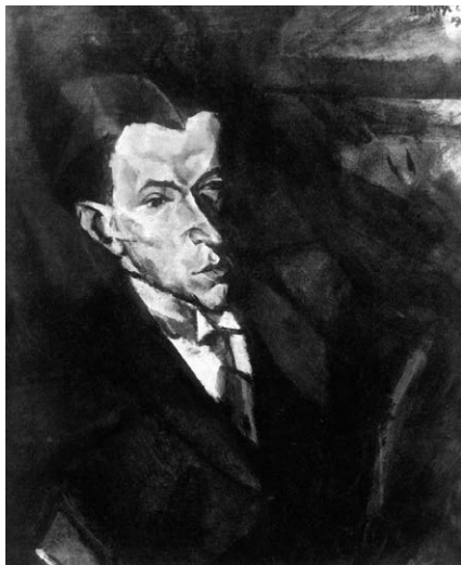
3. Tihanyi Lajos: Szamuely Tibor portréja, 1913. Olaj, vászon. Lappang.