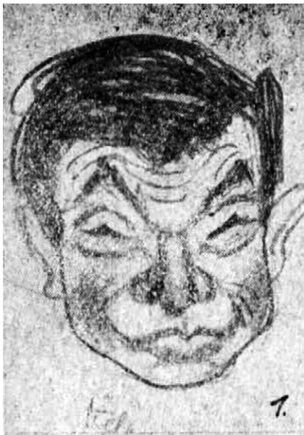
10. Kelen Imre: Tihanyi Lajos, 1919. Lappang. Repr. Színházi élet , 1919. május 11–17., 28.