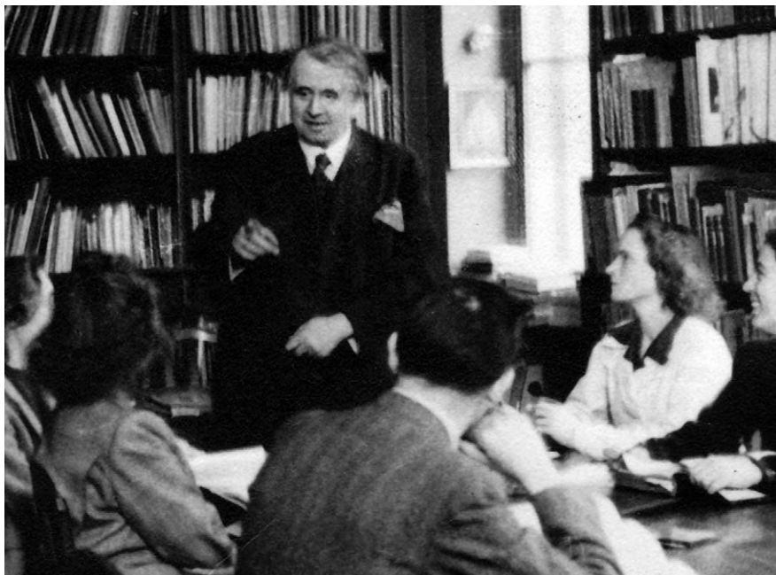
4. Gerevich Tibor szemináriumot tart.

datlan olasz mestereit, A. Colosanti társszerzővel pedig a Pálffy-gyűjteménynek ugyancsak publikálatlan olasz képeit.