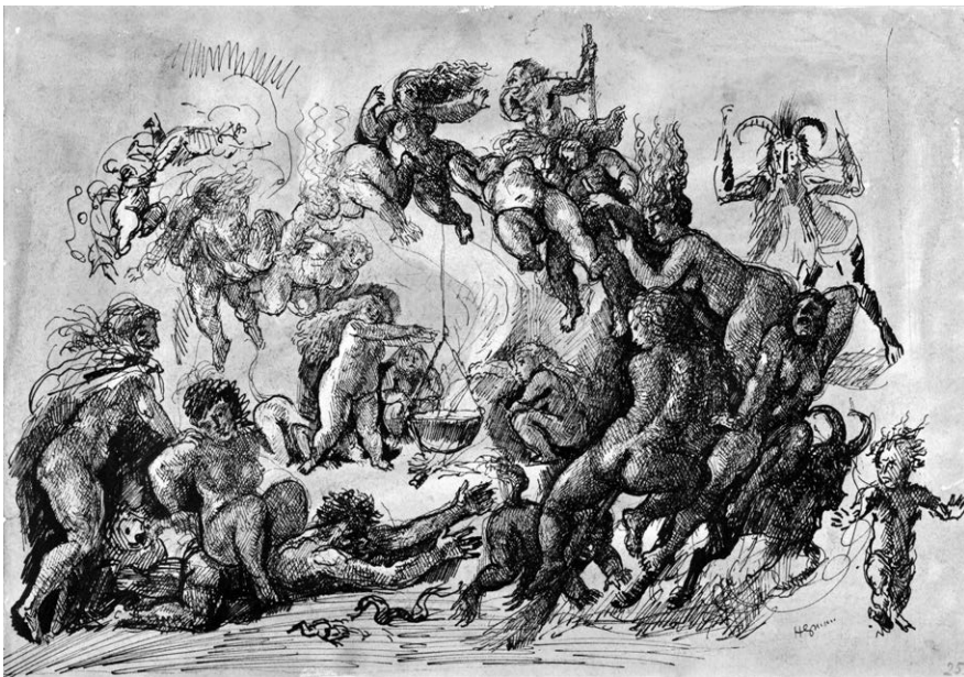
Herman Lipót: Multság (Walpurgis-éj), 1925. Papír, tus, akvarell. 305 x 420 mm.

Herman Lipót gyűjtemény, ltsz.: 83.150. © Vachott Sándor Városi Könyvtár, Gyöngyös © Fotó: Szekeres Anna © HUNGARI, 2018