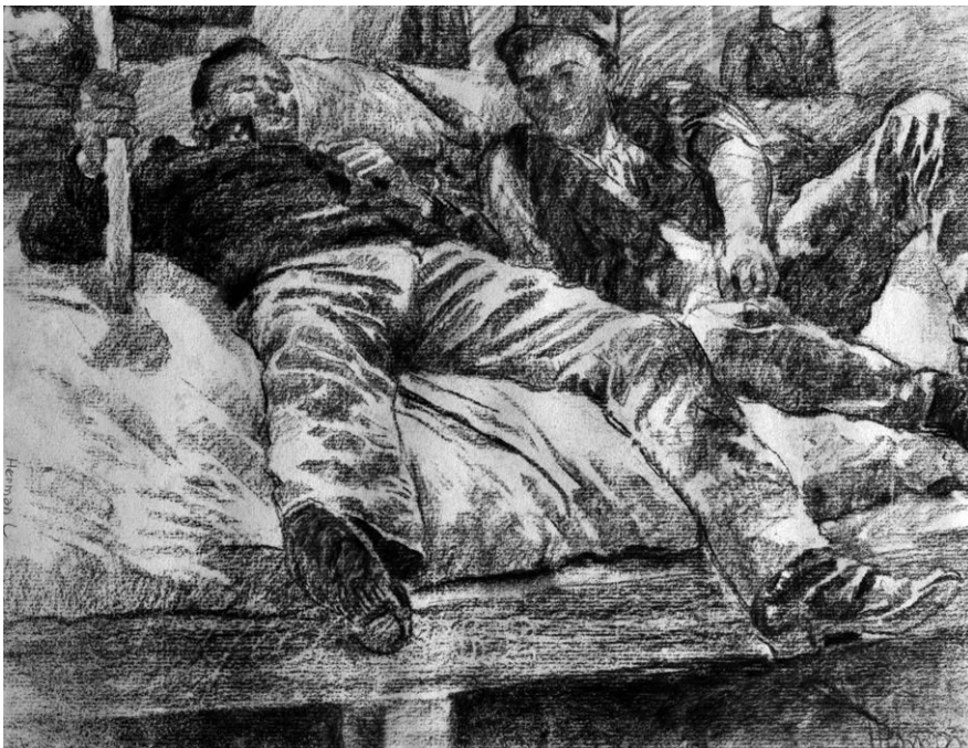
Herman Lipót: Pihenők (Heverő férfiak). Papír, grafit, 390 x 510 mm.