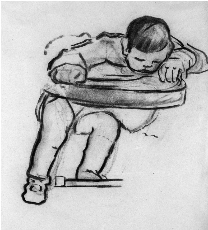
Farkas István: Judit, 1928, papír, szén, 540 x 420 mm, mgt.